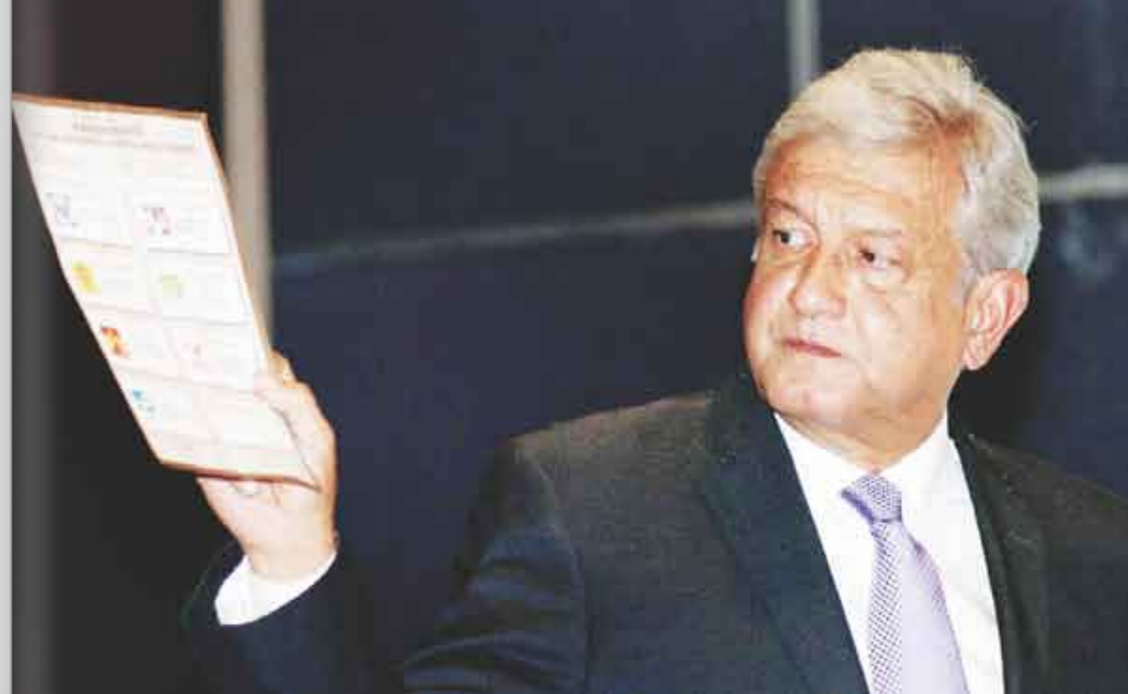
Debilidad. AMLO sin pruebas contundentes, prepara campaña para 2018.

“Ahora bien, ¿por qué AMLO dice que son cinco millones de votos y no seis o siete millones? Lo