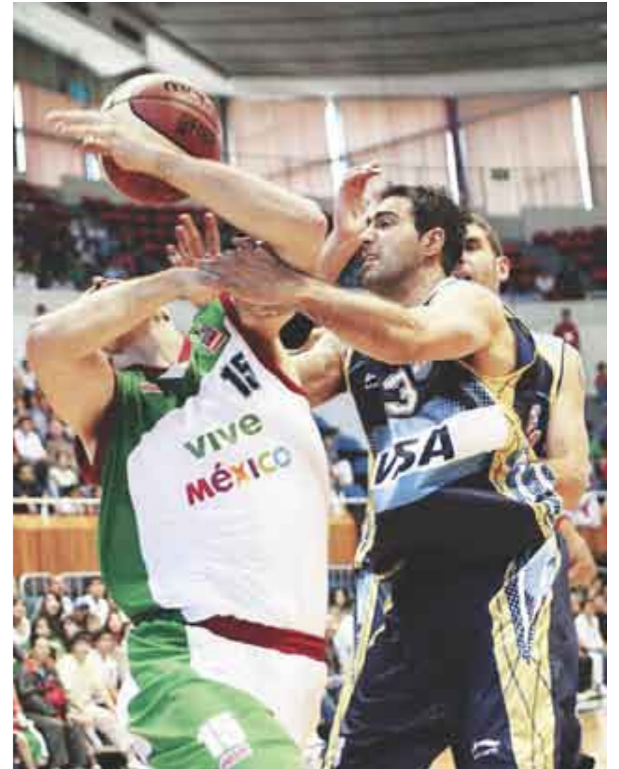
México. Bajísima calidad en deportes de conjunto.

porque hubo un fracaso fuerte en esos juegos, y fue cuando más dinero se le invirtió al deporte paradójicamente. En esa edición olímpica se pronosticaron nueve medallas, y sólo se logró una: la de Carlos Mercenario. Por eso, Salinas de Gortari le dio el control a Vázquez Raña; posteriormente, en los Juegos de Atlanta 1996 la actuación de la delegación mexicana fue de lo peor, porque sólo se consiguió una medalla de bronce, la del marchista Bernardo Segura. Luego de ese suceso le regresaron los recursos a la Conade. Pero el