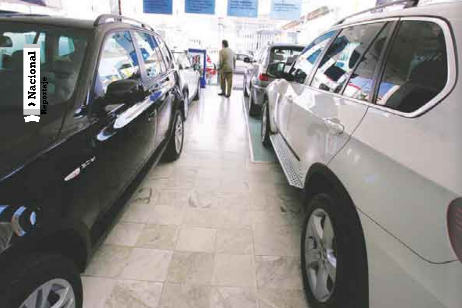
Blindaje, seguridad sólo para unos cuantos.

diendo del que requiera el cliente. El más bajo es el tres, que protege de ataques con armas de fuego de poca potencia (hasta Magnum 44) y tiene un precio mínimo de 530 mil pesos; el nivel cuatro se utiliza como defensa contra armas de fuego largas (hasta AK-47) y su costo aproximado es de 860 mil pesos; el blindaje de nivel cinco es contra armas de fuego largas de mayor poder (hasta AR-15) y tiene un valor de 995 mil pesos.