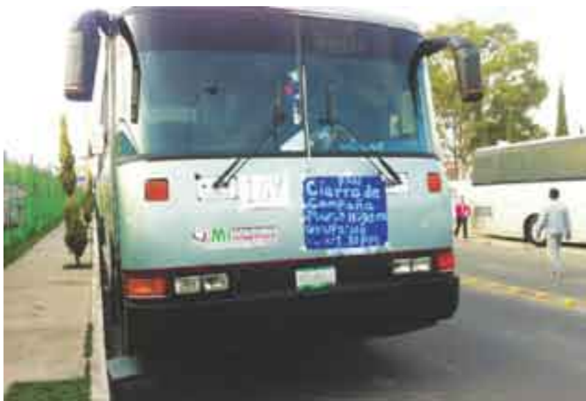
Priismo local se vende al panismo.