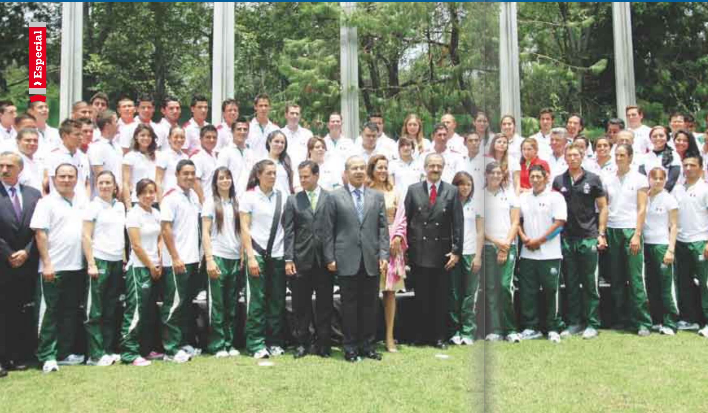
País de contrastes. Ciento trece millones de mexicanos y sólo 102 seleccionados.

blicas en las escuelas ni en las universidades que promuevan la práctica del deporte. Actualmente ya existen universidades privadas que sí han impulsado el fútbol americano y otras disciplinas, pero no son suficientes”, dijo.