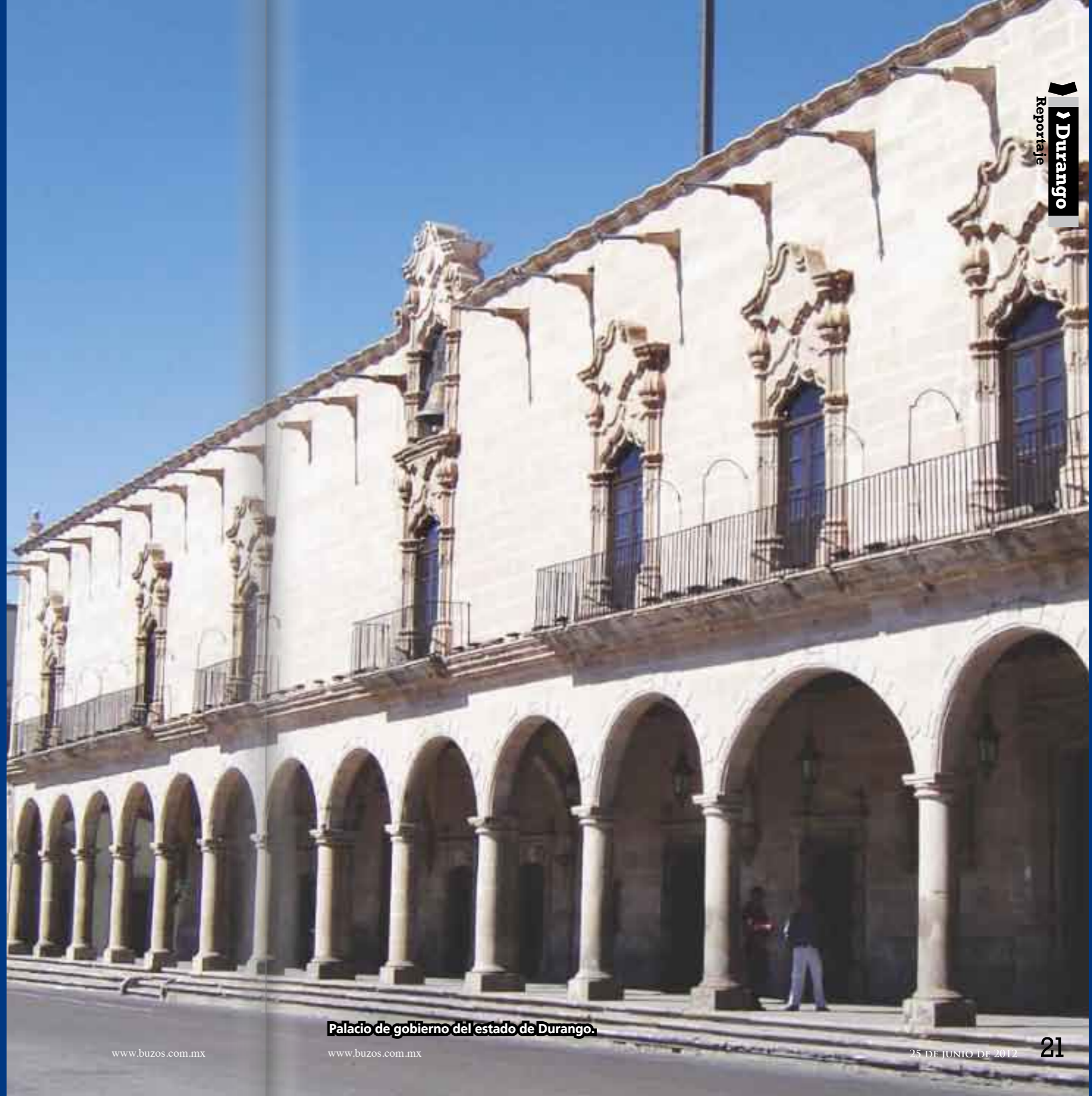
Palacio de gobierno del estado de Durango.