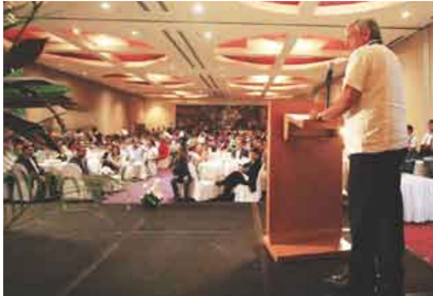
En un evento con integrantes de la Coparmex.

Luego de destacar que, en su opinión, la televisora forma parte de un complot para apoyar la