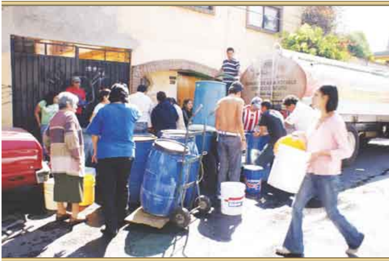
Distribución hidráulica en la "ciudad de vanguardia".

realizó la Evaluación de la Política de Acceso Domiciliario al Agua, la cual reportó una reducción del servicio de agua potable en las 16 delegaciones del Distrito Federal, y señaló como las más afectadas Milpa Alta (seis viviendas de cada 100), Xochimilco (cinco de cada 100) y Tlalpan (una de cada 100).