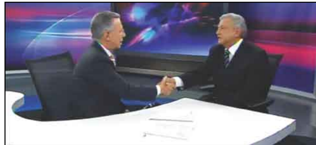
AMLO se reconcilia con la “mafia”.

Una de las supuestas evidencias que observa es que la mayoría de las encuestadoras no lo colocan como puntero de la competencia como en 2006, y por