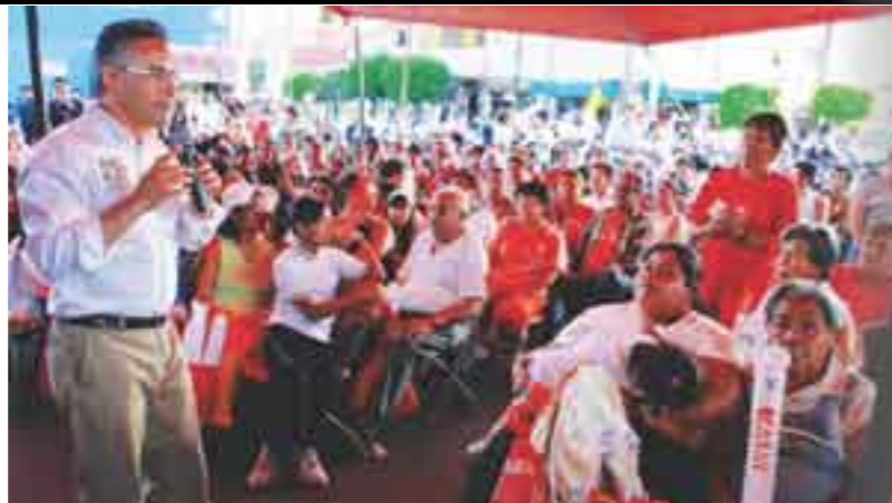
Tlalnepantla, Estado de México

Añadió que gestionará los recursos para la construcción del túnel, además informó que está trabajando con la Comisión de Agua del Estado de México, en un proyecto de adecuación con diferentes obras de infraestructura hidráulica a realizarse en el Río San Javier, que permitan desahogar de forma eficaz las aguas residuales.