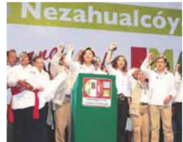
Nezahualcóyotl, Estado de México

Ganaremos la elección haciendo buena política, que suma y transforma realidades; que aglutina y une para mejorar la calidad de vida de la gente, aprovechemos el potencial de las personas para crear oportunidades, añadió.