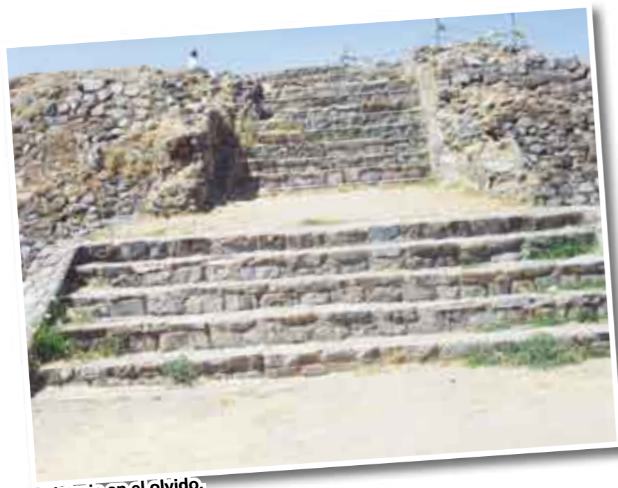
Historia en el olvido.

En Jalisco existen zonas arqueológicas como Los Guachimontones, ubicada en el municipio de Teuchitlán, a un par de horas del centro de Guadalajara. Su relevancia histórica y cultural, así como su inmejorable ubicación turística, posibilitaron la definición de