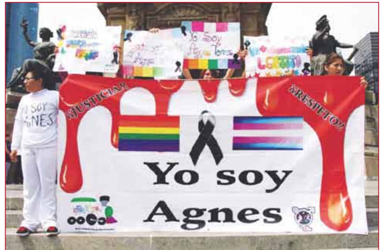
Activistas, contra la homofobia de sectores conservadores poblanos.

En el diagnóstico, “Mi salud, Informe sobre Homofobia y Diagnóstico Comunitario”, que realizó la asociación Vida Plena Puebla, se identifican los principales cinco problemas que enfrenta la comunidad gay en la zona conurbada con la capital poblana: violencia,