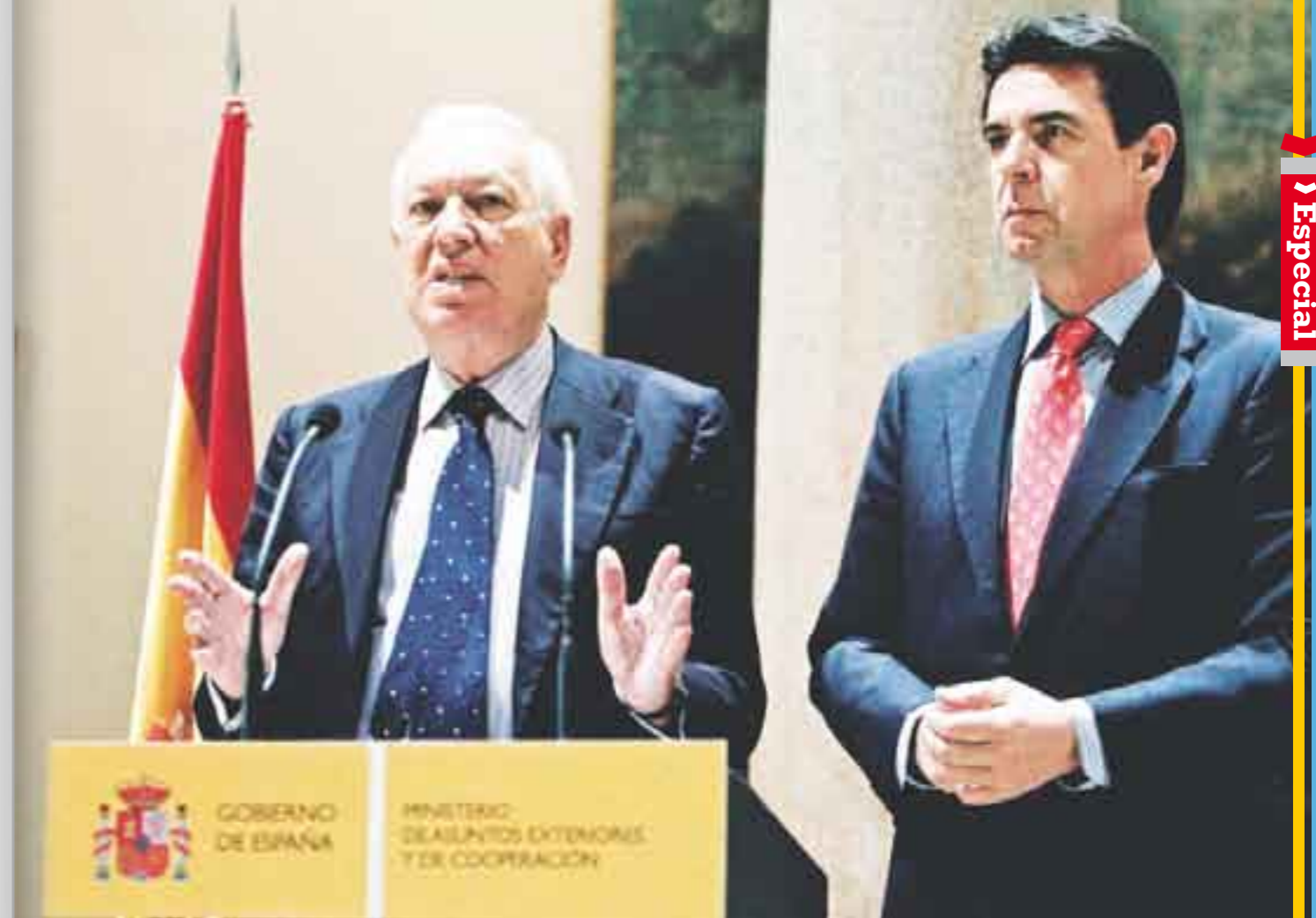
José Manuel Soria, ministro de Industria español. El enojo español.

Luego de que Argentina tomara el control de la petrolera, la reacción española fue inmediata. Uno de los primeros que manifestó su rechazo a la medida fue el ministro de Industria, Energía y Turismo de España, José Manuel Soria, quien la calificó como “hostil y discriminatoria”.