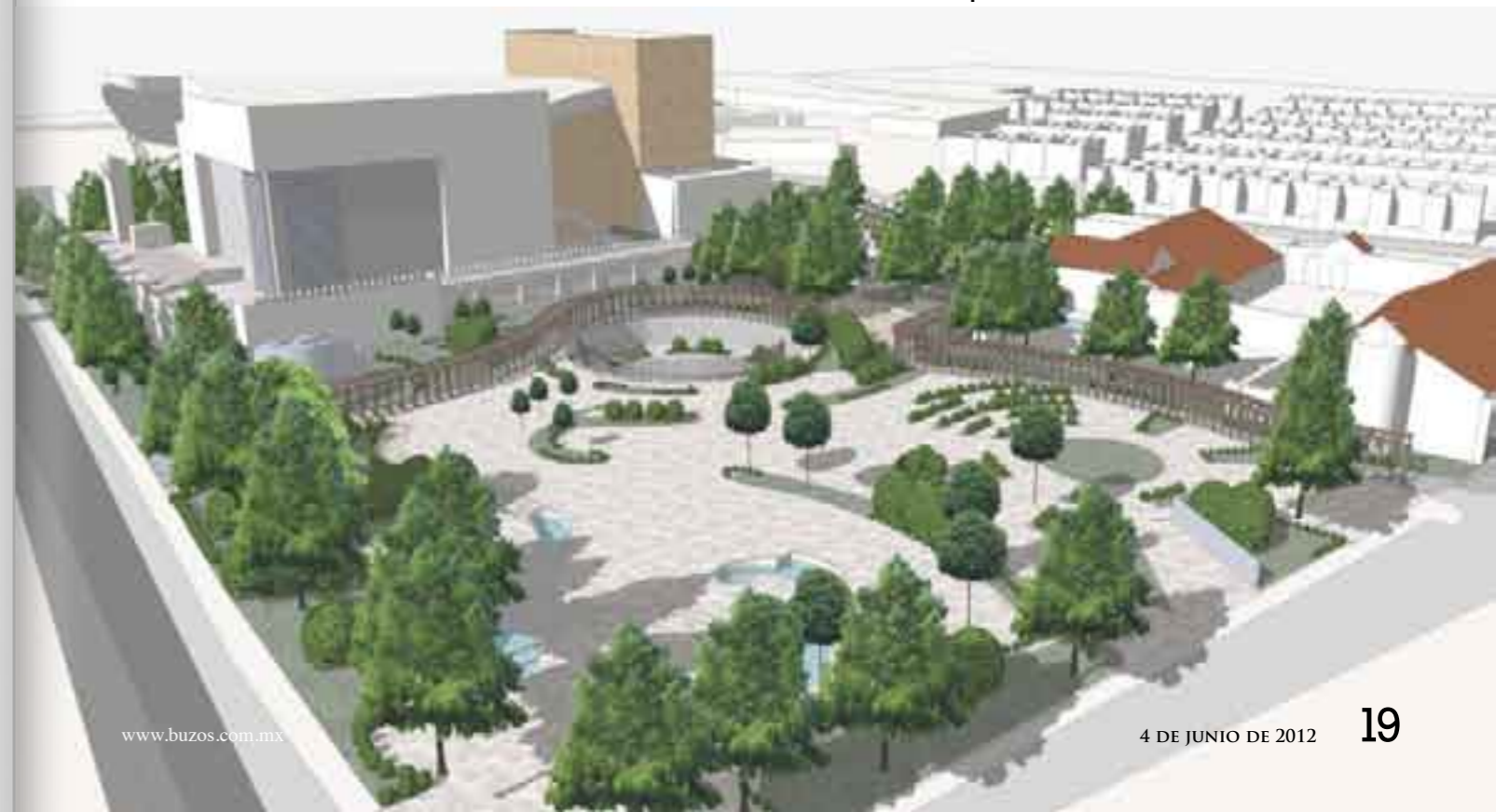
Maqueta del nuevo Rancho San José.

Las normas de la Secretaría de Desarrollo Social (Sedesol) indican que las obras de mejoramiento del espacio físico y social, como el parque urbano, el museo local y el auditorio, son indispensables a