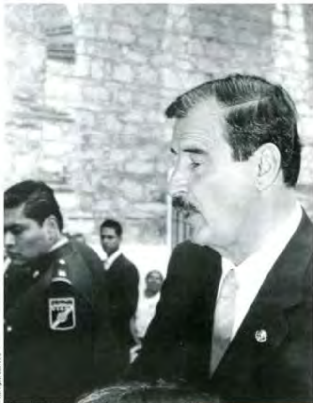
El Presidente Vicente Fox no obtuvo los resultados que hubiera deseado

que se busca es hacer eco. Es decir, se busca que exista un receptor para que capte el mensaje. En este sentido, se le está enviando un mensaje muy claro al presidente Vicente Fox Quezada. Se trata de que el mandatario pueda percatarse de que en Puebla existe un apoyo por parte del gobernador y su séquito, para poder darle viabilidad política a su proyecto, y también a los del propio gobernador. Buscar ser la sede del ALCA, pero sobre todo, darle viabili-