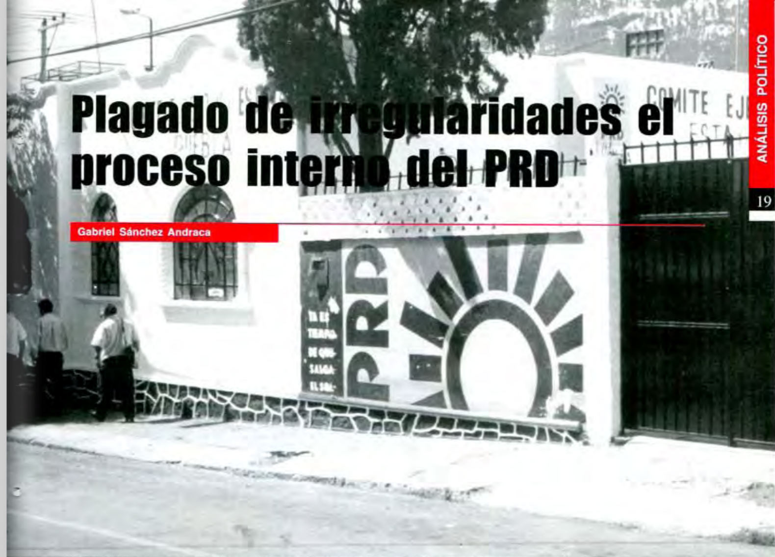
El proceso interno del PRD, estuvo plagado de irregularidades, tantas, que están poniendo en peligro al PRD como tercer fuerza política.

El proceso interno para designar dirigentes nacional, estatal y municipal del PRD, estuvo plagado de irregularidades, tantas, que están poniendo en peligro al de la Revolución Democrática como tercera fuerza política en el estado; tantas, que el servicio electoral nacional se ha visto obligado a anular las elecciones en la mayor parte de los municipios donde se llevaron a cabo, por no garantizar el mínimo de limpieza y credibilidad.