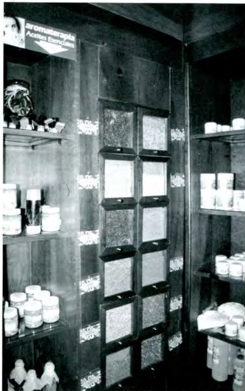
40 mil millones de dólares, esto es lo que se llevan algunos laboratorios que utilizan la botánica de nuestro suelo.