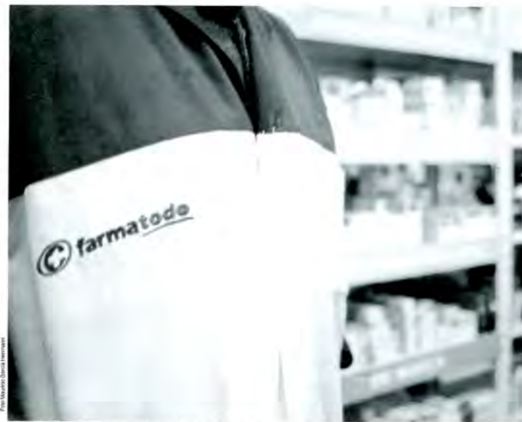
Cerca de 7,000 medicinas provienen de los conocimientos de la herbolaria

Por esos digo que es una salida racional a la crisis, pero hay que hacer un modelo, un proyecto, hay que sustentarlo, fundamentarlo y financiarlo. Tengo entendido que se aprobaron más de doscientos millo-