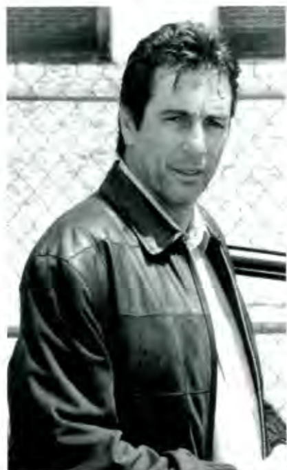
Director Técnico: Tomás Boy

Durante el comienzo de un torneo o campeonato, cualquier equipo tiene las mejores perspectivas y deseos, nunca se trabaja para perder y menos ser el peor equipo del final de la campaña. La gran mayoría de los equipos se sienten en las finales y hasta campeones; esto no es malo, al contrario es de lo más sano, sobre todo en el aspecto mental. En el primer partido si no se dan las cosas como se plantearon hay muchas excusas para justificar el mal resultado: (todavía están duros los jugadores, arrancamos fríos, el arbitro nos apuñalo, etc.). Pero al llegar a cierta racha negativa el primero que se siente fuera es el técnico, que ya no encuentra excusas para justificar el mal