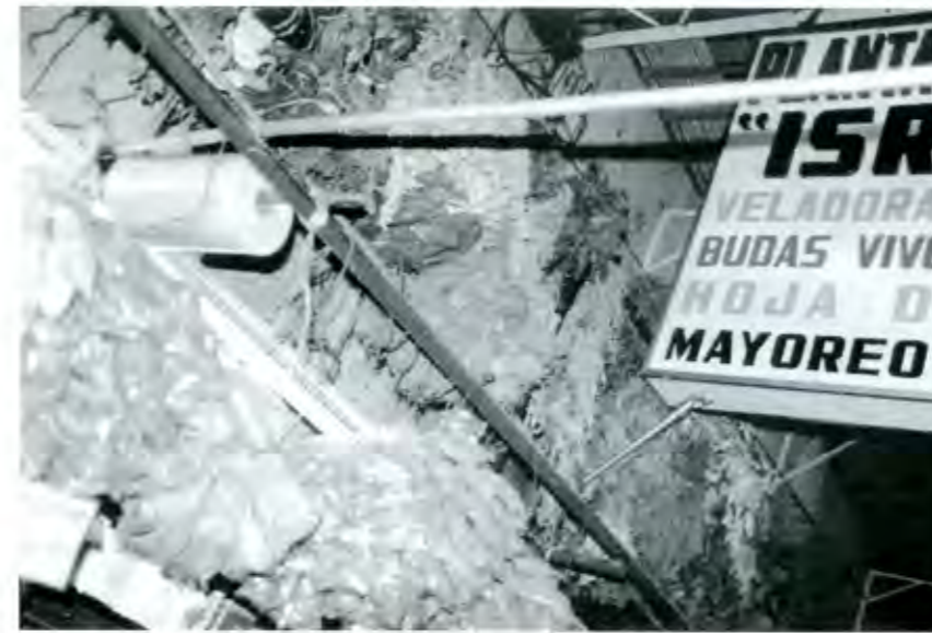
La medicina tradicional se niega a morir en muchas comunidades

El uso de plantas medicinales en México se remonta a muchos siglos, las culturas prehispánicas ya las usaban con bastante habilidad para los diferentes padecimientos. Esa cultura milenaria prevalece hoy pese a todos los avances científicos en la medicina, sin embargo, no cuenta con el suficiente apoyo institucional para promoverla.