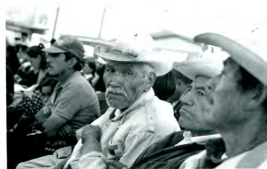
Cifras poco alentadoras en la educación para los adultos

Finalmente, hay que señalar que ojalá y la SEP no sea utilizada sólo como una pasarela de funcionarios, por lo que amigo lector le reiteramos que usted será testigo de lo que será la educación de Nacer, por lo que ahora dependerá de los poblanos el agradecer o reprochar la formación que el gobierno estatal nos ofrece. ■