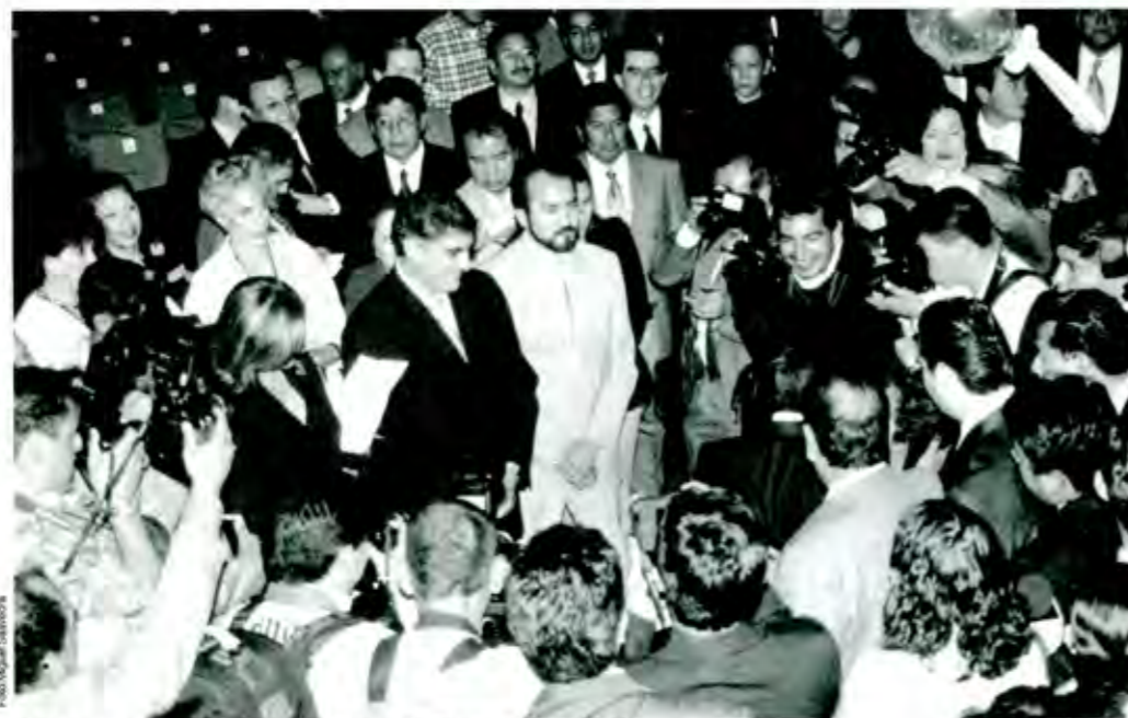
Todos los reporteros y medios auditivos deberían autocriticarse antes de atacar

Cada vez es mas complejo y difícil hacer periodismo en este contexto social de incredulidad generalizada, competencia feroz por la noticia, abundancia de medios informativos, sucesos públicos