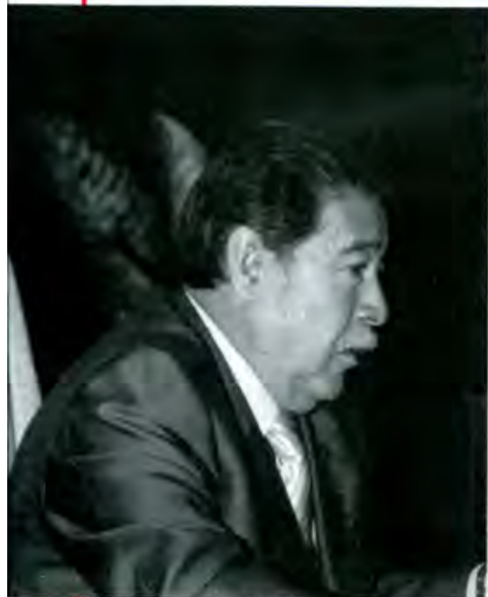
Amado Camarillo se fue de la SEP por que no pudo, no quiso o no supo ordenar la Institución

Con esta columna inauguramos en la revista Buzos, con motivo de su segundo año de vida cumplido en el número anterior, un espacio dedicado a la educación, a los maestros y a las cuestiones educativas, laborales sindicales y estudiantiles que rodean al quehacer educativo. Pretendemos reunir datos e información investigando y descendiendo al fondo de estas cuestiones, para servir en lo posible, de orientación a todos los involucrados en la labor de la enseñanza, con el sano propósito de contribuir a la crítica constructiva con miras a su mejoramiento. Que así sea.