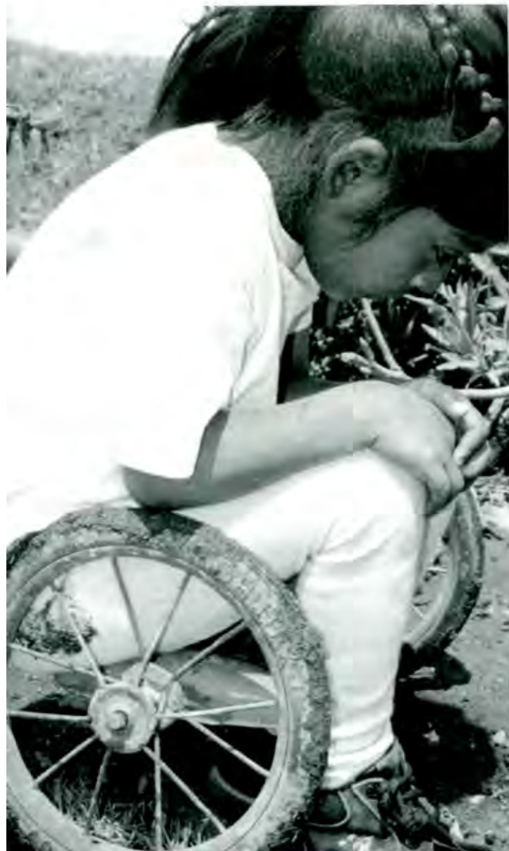
Los ricos no están dispuestos a ayudar a los pobres

Sin embargo, la vida no es así. Las ventajas que ha alcanzado la humanidad en su largo penar no tratan equitativamente a todos los hombres. La forma en que se distribuyen los satisfactores es absolutamente inequitativa. A unos pocos hombres como si fueran los únicos que han generado en la historia ciencia y tecnología, les corresponden prácticamente todos los productos, la facultad de venderlos, atesorarlos o invertir, según les convenga; a otros, como si fueran absolutamente ignorantes y no hubiesen contribuido históricamente al de-