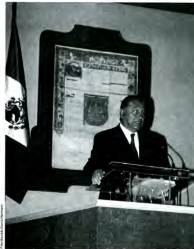
En Puebla el mandatario dará el apoyo a Fox para darle viabilidad política a su proyecto

base sólida, construida con varios elementos como lo son el consenso, la participación, el acceso a las cuestiones políticas y la sensibilidad política, entre otros tantos elementos que fortifican a la democracia. Cuando llegemos a ese estadio, creemos firmemente que lo económico vendrá a constituirse en nuestra mejor paga. Si nuestros líderes, en verdad quieren constituirse en un punto de apoyo para el presidente Vicente Fox, tendrán que supeditar lo democrático a lo económico, tanto en los hechos como en las palabras. Que los actos sean los que hablen. Sólo ahí se demuestra la voluntad política y el espíritu de servicio, no en la ambigüedad de los discursos y diatribas. Que ese colchón no sea tan blando para seguir hundiéndonos en la mediocridad económica. Mientras tanto, viva la vida, muera la muerte, juegue la suerte, yo ya me voy... ■