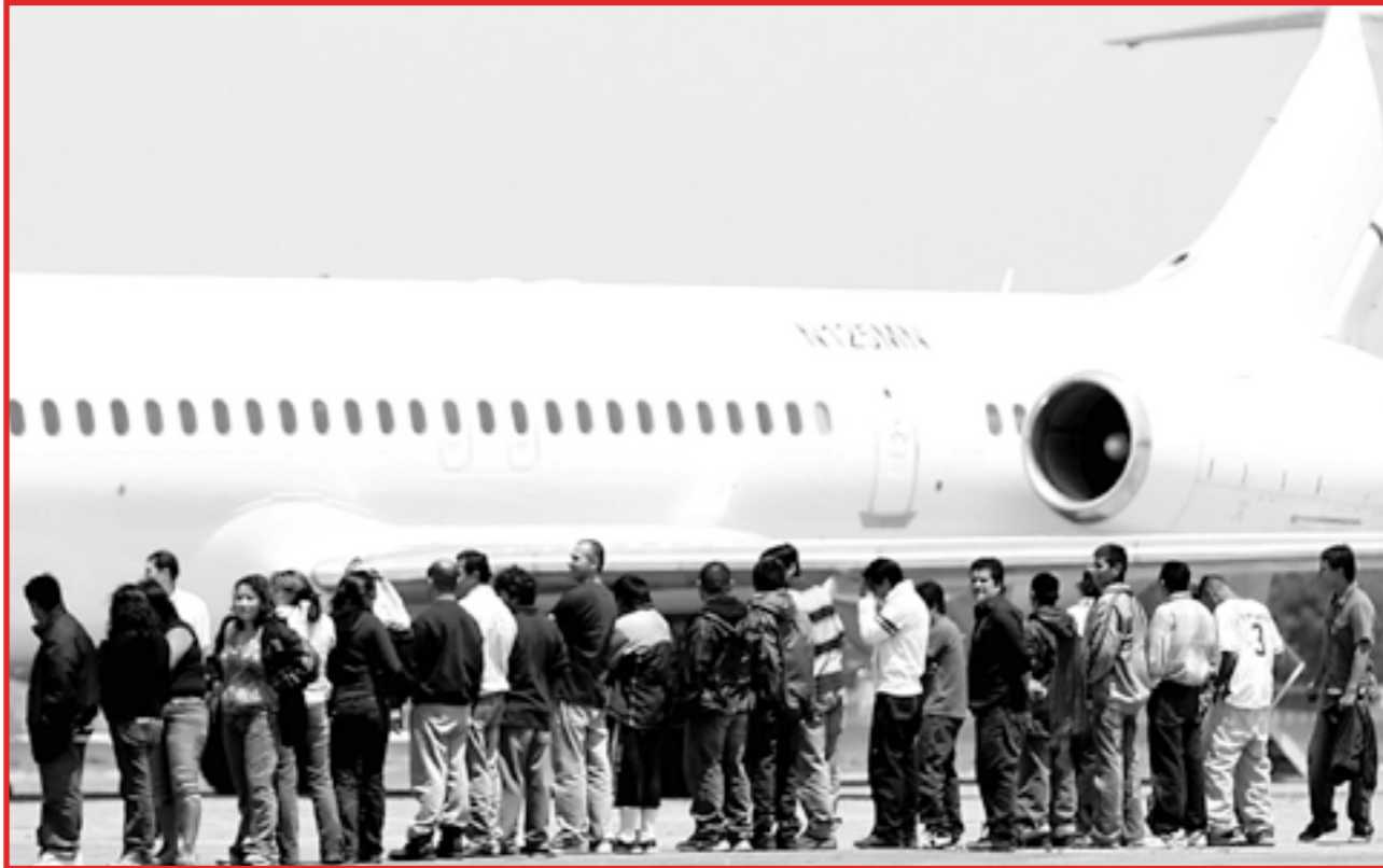
Connacionales deportados recientemente. Lejos de la "tasa cero" en migración.

de 42 años de edad, fue asesinado a golpes y descargas de armas eléctricas que le provocaron muerte cerebral.