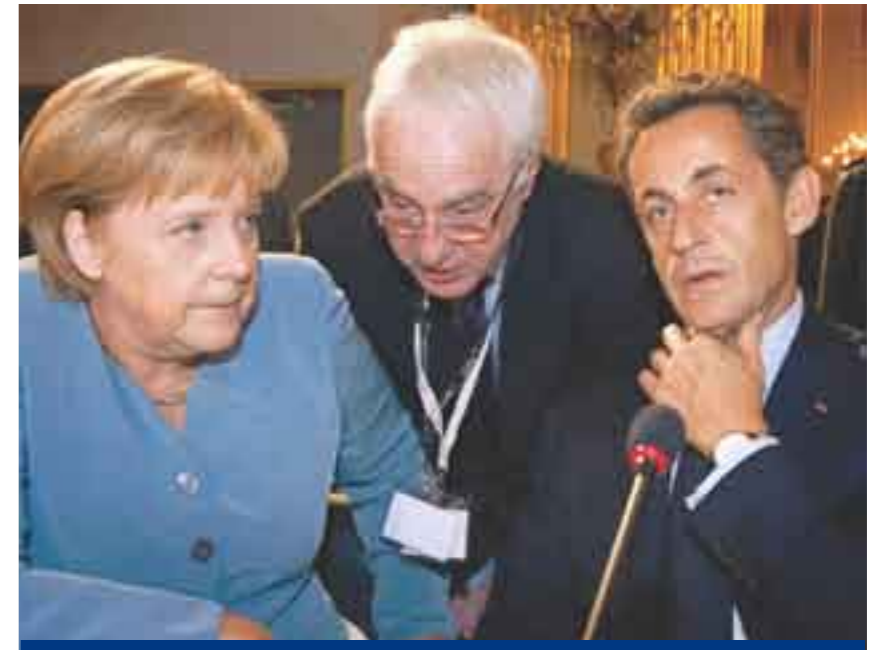
Merkel y Sarkozy. Se rompió el dúo de hierro.

Por lo pronto, y luego de conocerse el triunfo de Hollande en