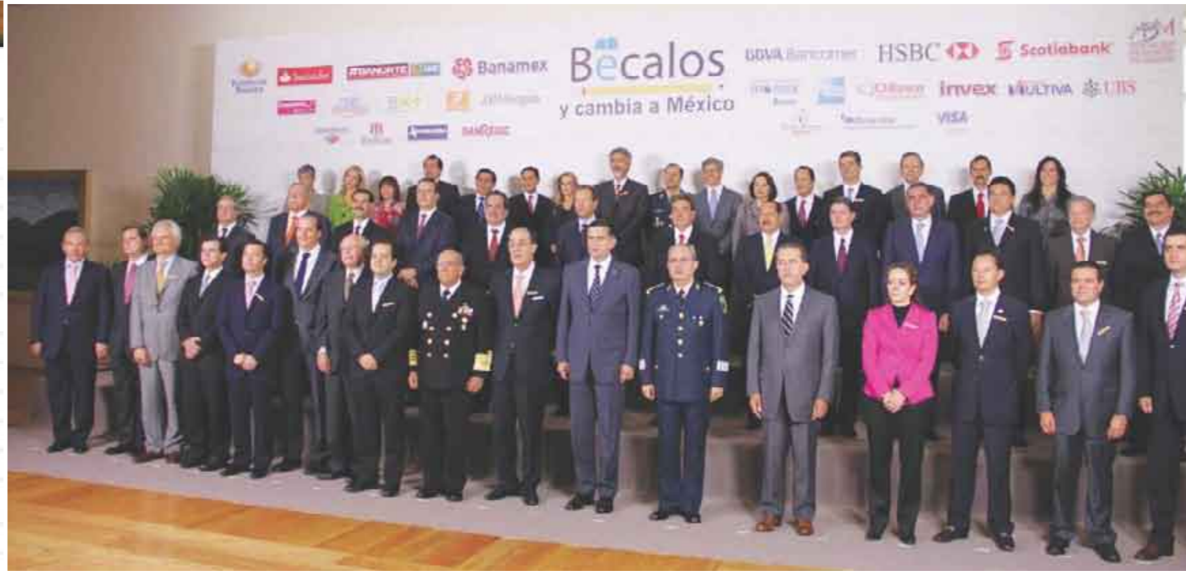
Iniciativa Privada. Patrocinador de sus empleados de mañana.

Fue a principios de este año cuando comenzaron a intensificarse las presiones contra el sistema educativo