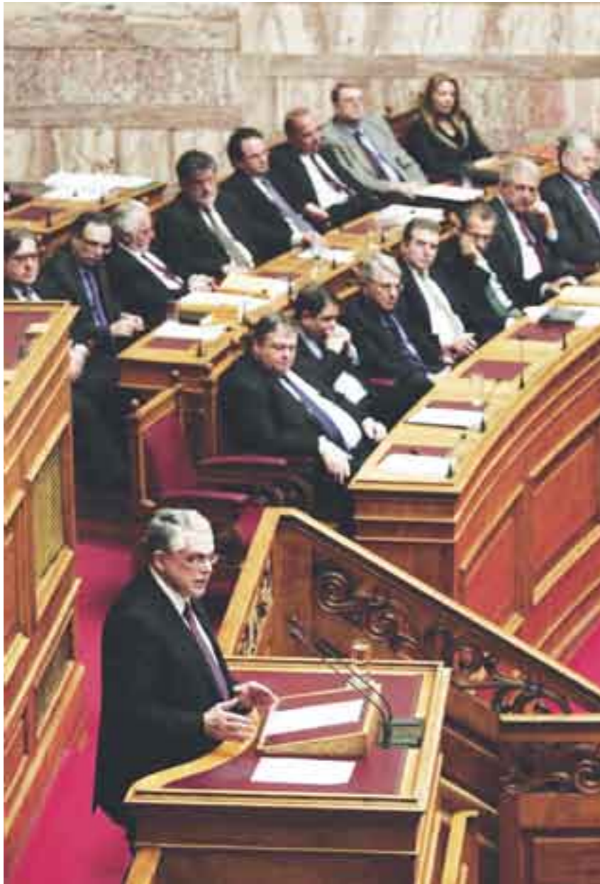
Parlamento en disyuntiva.

–la llamada troika – para evitar una bancarrota. A cambio, ha tenido que adoptar reformas que han ido desde un recorte del 25 por ciento en las pensiones, pasando por la reducción salarial del 20 por ciento en el sector privado hasta la desaparición de 100 mil empleos públicos.