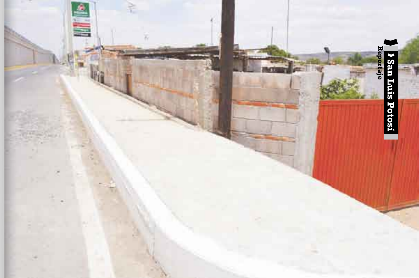
La sinrazón de las banquetas de metro y medio de altura.