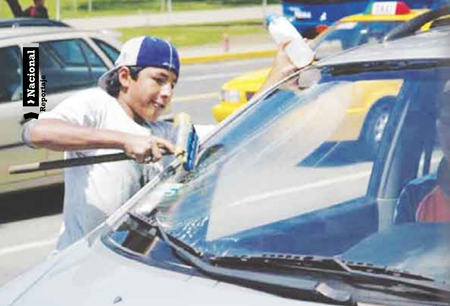
Los niños (sujetos de derechos) que el gobierno se niega a reconocer.

las calles del Centro Histórico del Distrito Federal. Cuando se le preguntó cuánto ganaba y en qué lo gastaba, contestó que 100 pesos al día y que no lo gastaba en algo porque su patrona se los guarda desde hace muchos años. Es decir, nunca ha recibido un pago.