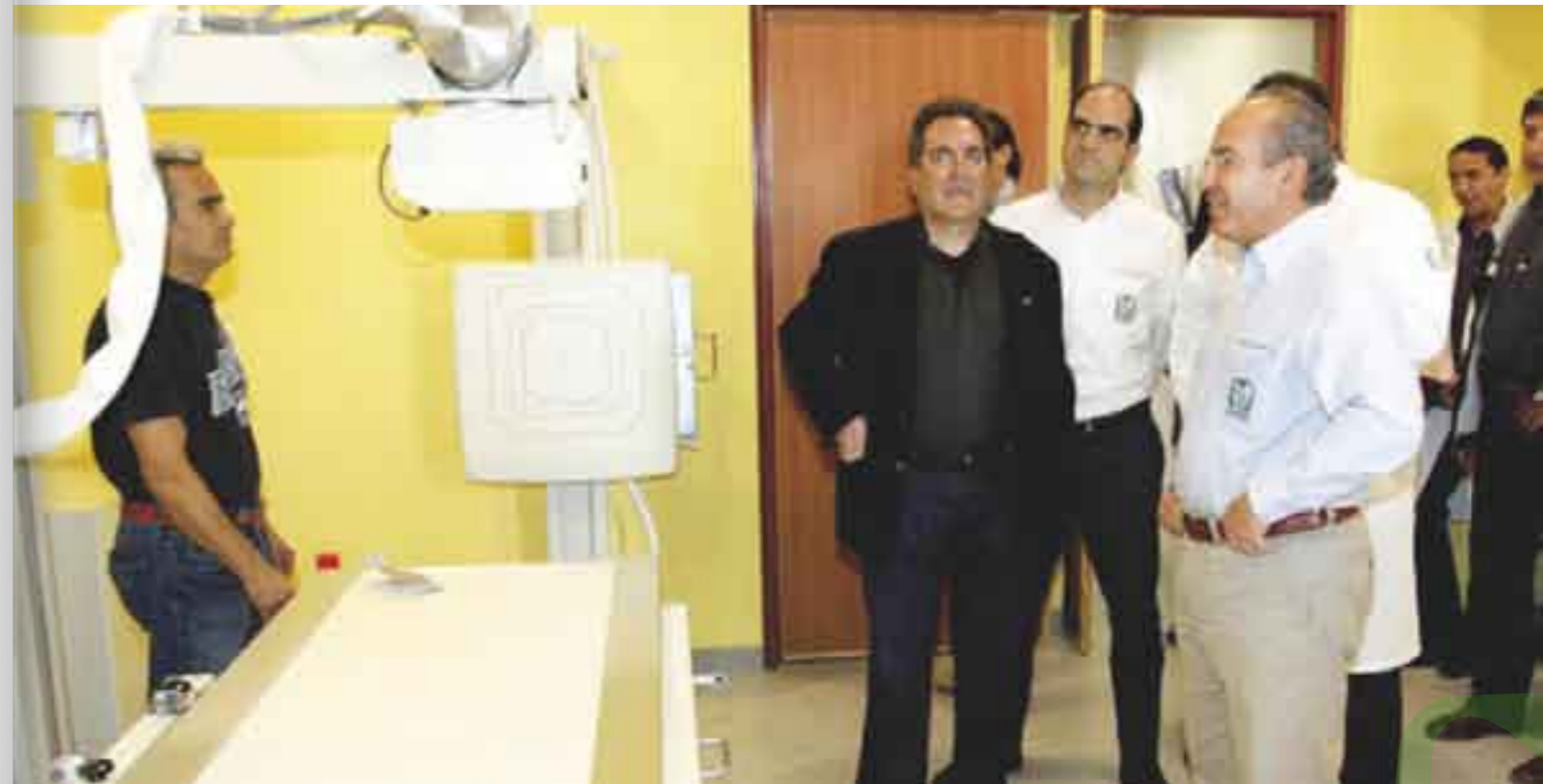
IMSS. Cuestiona la OCDE su mal manejo financiero.