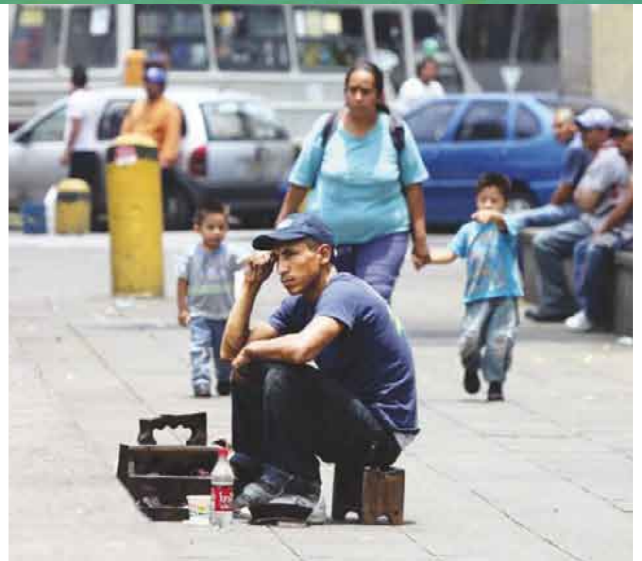
Jóvenes mexicanos. La escuela no es una opción.