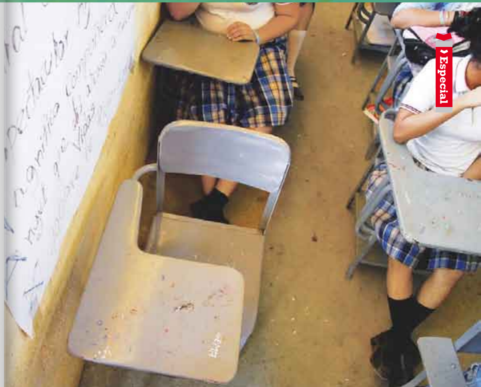
México, altas tasas de deserción escolar.

“No es ajeno a nadie el altísimo desempleo y de bajos ingresos que tiene la mayoría de las familias mexicanas. Una familia pobre, ¿a qué le va a dar preferencia, a comer o a mandar a su hijo a estudiar?