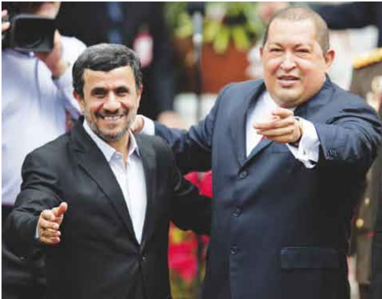
Presidente iraní fortalece relaciones diplomáticas con sus pares latinoamericanos, ante las agresiones de EE. UU.