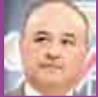
Ernesto Ruffo Appel

Gobierno de la ciudad de México; sorprendentemente, la decisión fue otra, no obstante que es prima de la primera dama, Margarita Zavala.