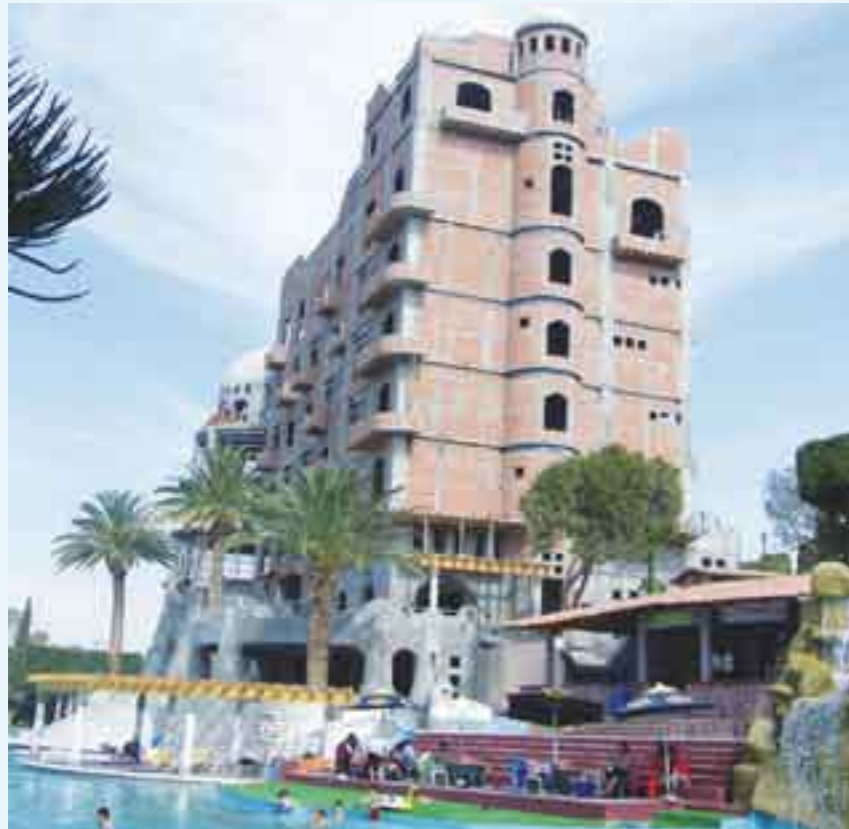
Crece el proyecto colectivo. Hotel de siete pisos, próximo a inaugurarse.

presidencial de 1947-1951 dotó a la comunidad indígena, cuyo régimen de propiedad no admite la presencia de ninguna otra figura patrimonial, sea individual o societaria anónima, como consta en la resolución que la Secretaría de la Reforma Agraria expidió el 27 de febrero de 1991 con el acuerdo y el aval del Gobierno del estado de Hidalgo.