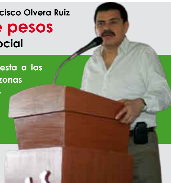
FRANCISCO OLVERA, GOBERNADOR DE HIDALGO

con un importante impacto regional, en respuesta a las necesidades de los hidalguenses tanto de las zonas urbanas, como de las rurales, acciones enmarcadas dentro de la visión de desarrollo municipalista que el mandatario ha impulsado desde los primeros meses de su administración.