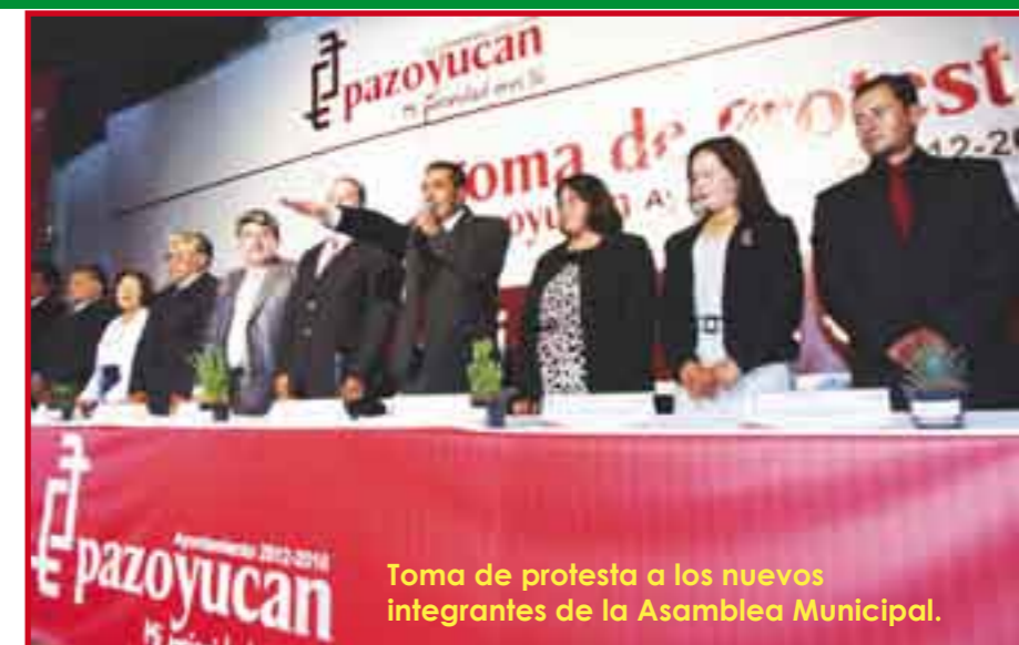
Toma de protesta a los nuevos integrantes de la Asamblea Municipal.