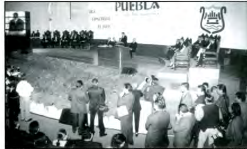
Queda clara la poca experiencia legislativa de las 41 personas que integran la LV legislatura, foto: Miguel Saavedra

de los 41 son Abogados, siete Profesores, igual número de empresarios, tres son Médicos, dos Economistas, dos Administradores de Empresas y dos Agricultores, además de un Contador, un Administrador Público, un Filósofo, un Político, una empleada, un experto en comunicaciones, un Ingeniero en Electrónica y un Licenciado en Relaciones Internacionales.