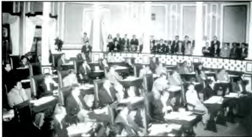
En la LV legislatura quedó demostrado que los poblanos emitieron un voto poco razonado

La pluralidad en la LV Legislatura no sólo ha sido demostrada por la participación de 6 fracciones parlamentarias, gracias al voto de los poblanos, sino también en los perfiles de cada uno de los 41 diputados locales.