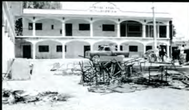
El día 15 de febrero, el candidato perdedor del PRD procedió a encender sillas, vehículo y aparato de sonido

A ntorcha Campesina es, casi con seguridad, la organización más calumniada y desprestigiada, principalmente a través de una terrible campaña en los medios masivos de comunicación, de toda la Historia política moderna del país. No es mi intención repetir aquí, para regocijo y contento de sus enemigos, toda la serie de infundios, acusaciones, injurias, imputaciones gratuitas, calificativos infamantes, falsas informaciones disfrazadas de "noticia objetiva", etc., etc., que se le han endilgado sin el menor escrúpulo. Me limito, en todo caso, a remitir a una hemeroteca a quien tenga genuino interés en conocerlos o recordarlos a detalle.