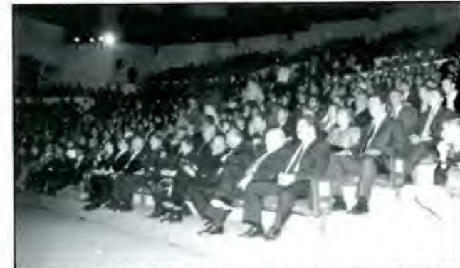
Pocos, muy pocos priístas hubo en el acto además de las autoridades, foto: Miguel Saavedra

Por lo general los panistas son personas conocidas en pequeños círculos empresariales, religiosos o de instituciones de educación privada y no en el servicio público, donde apenas se inician. ■