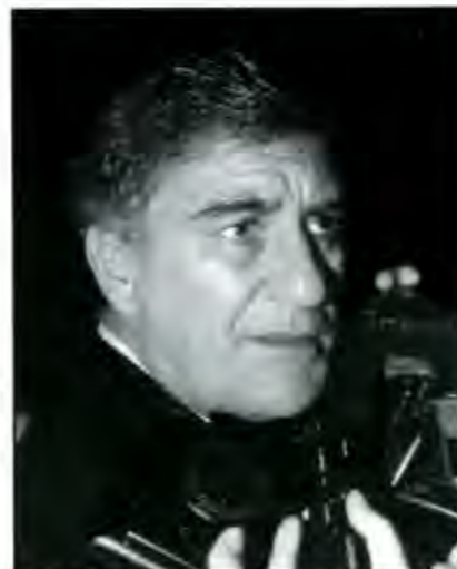
Luis Paredes sostuvo que su gobierno no pretende mandar, sino coordinar

Ya por último, hay que reconocer que si bien un cambio de gobierno siempre genera críticas y opiniones encontradas, este de Luis Paredes ya puso a prueba la actitud y madurez de los poblanos, pues con la medida de condonar las multas y sanciones administrativas se podrá comprobar hasta donde podemos llegar y que tanta libertad y confianza nos puede dar un gobierno que fuera de todo interés político, bien o mal ya está midiendo la inteligencia de los mexicanos. ■