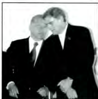
Puebla vive un caso de cohabitación política por segunda ocasión

La cohabitación es un concepto que explica las condiciones en que un partido triunfador convive, comparte y toma decisiones conjuntas en un periodo determinado; así se explica la cohabitación de varios partidos compartiendo el poder. Pero también se habla de cohabitación, cuando un gobernante está en el poder de cierto nivel de gobierno y otro partido diferente en otro nivel de gobierno, tal es el caso que ha venido sucediendo en algunas entidades federativas de México, como es el caso de Puebla, que por segunda ocasión ve este fenómeno como parte de un proceso político en una sociedad política y cultural.