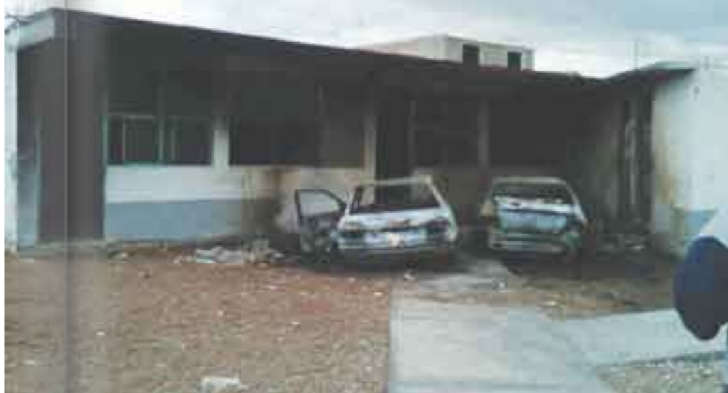
Partidarios de la Hiena muestran a los medios sus artificios para agredir a quienes no comulgan con sus prácticas caciquiles.