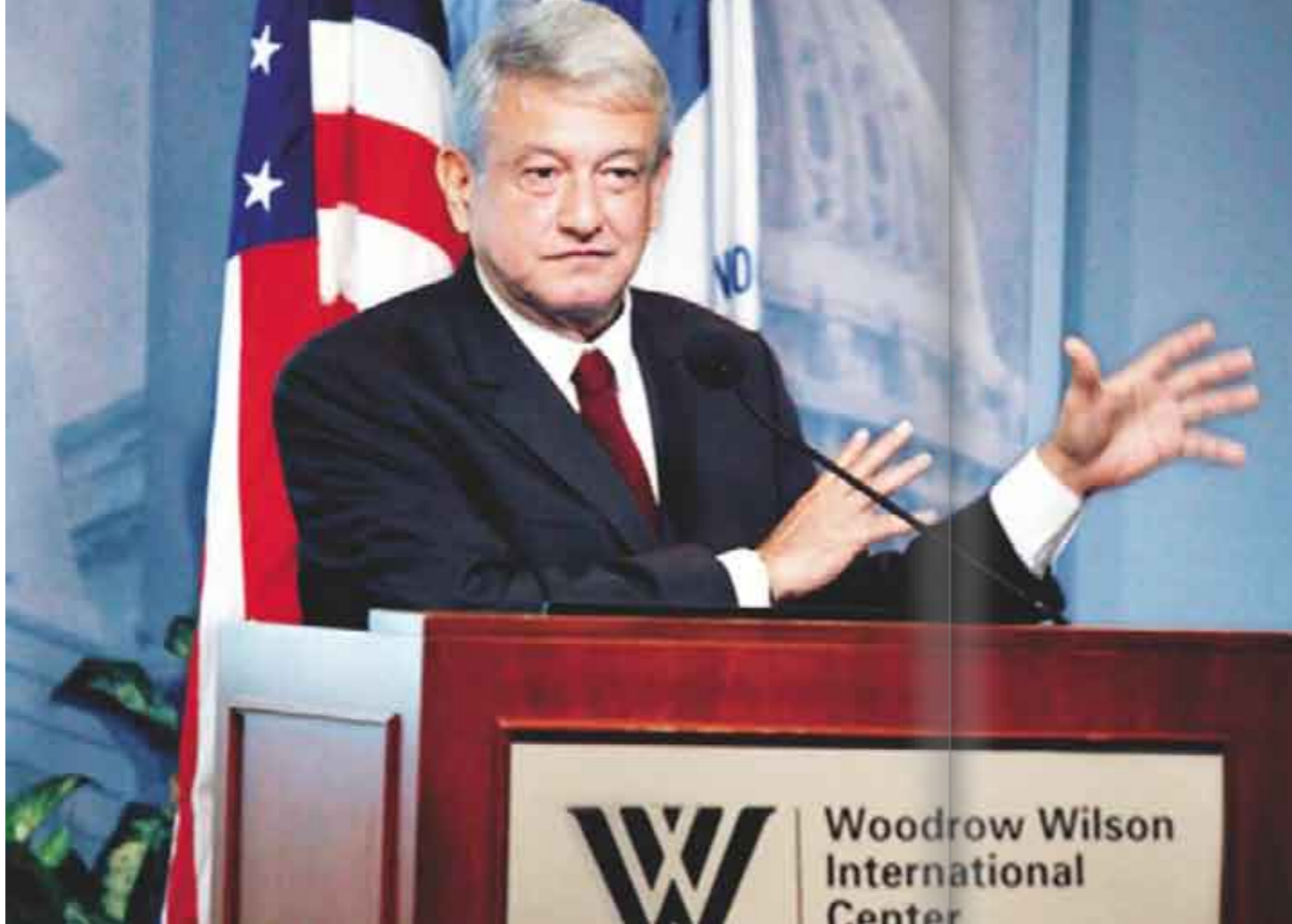
AMLO en Estados Unidos, la capital del neoliberalismo, el sistema que tanto criticó hace 5 años.

rece acercarse a la religiosidad, al modo de un predicador, pero la realidad es que no se mete a fondo en ello; a López Obrador se le puede criticar por muchas cosas, lo odian o lo aman intensamente, pero, sin duda, quiere ser atractivo para otros sectores sociales y captar la atención de quienes no tienen un partido, que son mayoría en México”, comentó la especialista.