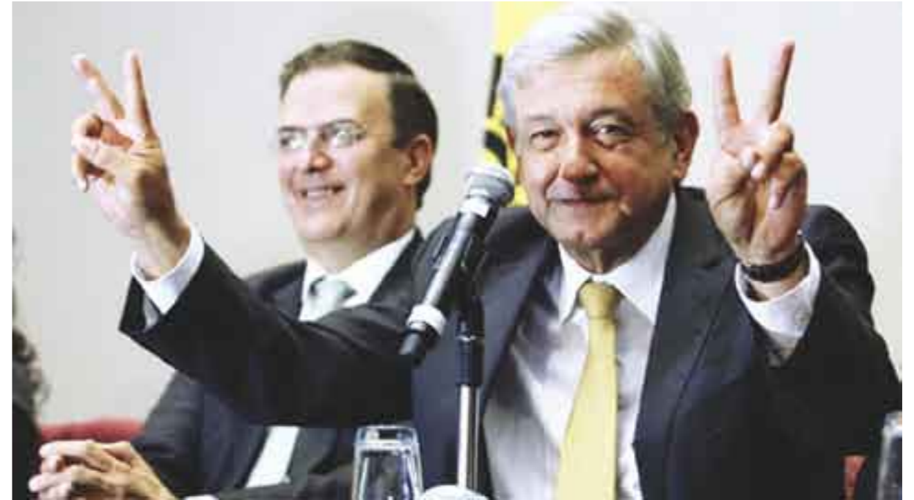
Doble discurso. La misma cara.

Entre los contrastes de su “renovado” discurso electoral y sus acciones actuales, Andrés Manuel López Obrador (AMLO), candidato de la “izquierda” para la elección presidencial de 2012, muestra su verdadero rostro político, el cual se ofrece muy alejado del izquierdista “radical” de hace apenas un sexenio o de cuando fungía como presidente del Partido de la Revolución Democrática (PRD).