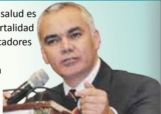
Gabriel O'Shea Cuevas, secretario de Salud y director general del Instituto de Salud del Estado de México (ISEM).

Cuando se trata de evaluar un sistema de salud es importante medirlo con los índices de mortalidad materna y mortalidad infantil y estos indicadores en el Estado de México han disminuido sustancialmente, con lo que se demuestra que las políticas públicas en salud son las adecuadas y dan resultados positivos.