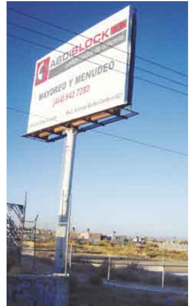
Terreno en cuestión y anuncio espectacular de las personas que se lo apropiaron.

El pasado 20 de junio del año se dieron alegatos y los demás culpables se ampararon con el apoyo legal,