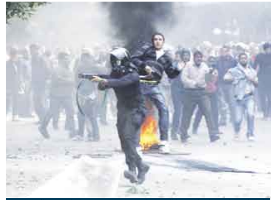
Gatopardismo. Egipcios reaccionan ante las medidas mubaristas sin Mubarak.

En tanto, los militares, apoyados por dirigentes políticos y candidatos presidenciales, conformaron un Consejo Consultivo Civil que será encargado de buscar una