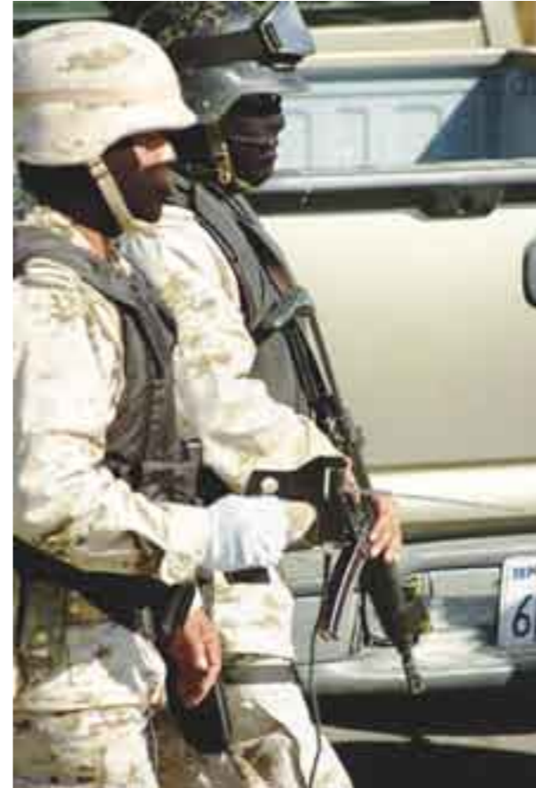
Fuerzas armadas mexicanas, burladas.

“Por estas razones, las intromisiones en domicilios a partir de los resultados del GT200, así como la incautación de bienes y detención de personas que se realicen con base en esa actuación, deben considerarse injerencias ilegales y no pueden justificar la fragancia, situación que deben atender tanto las autoridades ministeriales como los jueces. Por ello, se recomienda