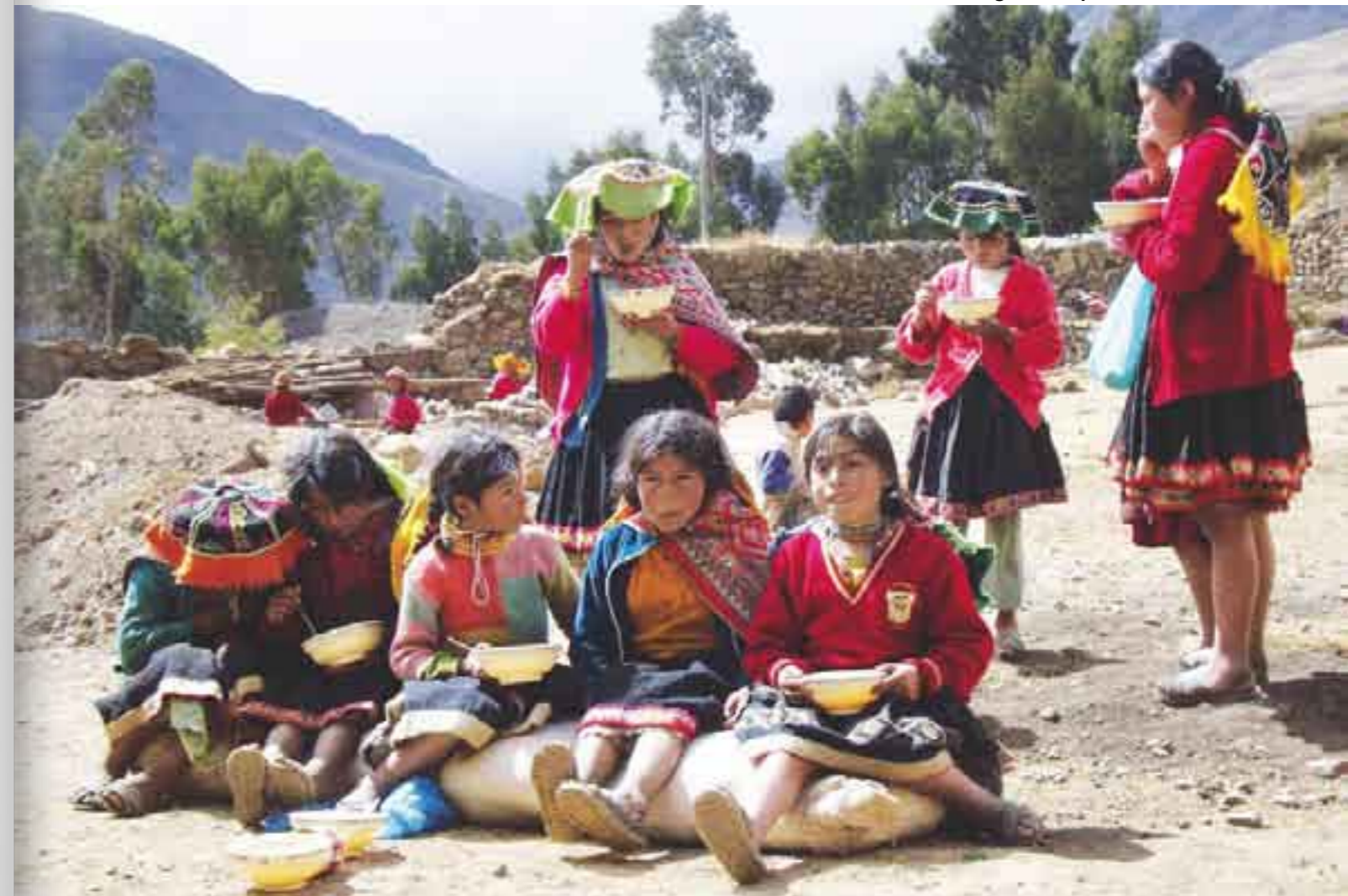
Pobreza alimentaria. Una inseguridad que se calla.

“La concentración de la riqueza, principalmente en este sexenio, se ha ido acentuando. El 10 por ciento de las familias más ricas del país, que controlan el 40 por ciento del ingreso, se hacen cada vez más ricas mientras el resto de la población se hace más pobre. Se calcula que el 40 por ciento de la Población Económicamente Activa (PEA) gana dos salarios mínimos en promedio y si lo medimos por la canasta básica alimentaria, que tiene un costo individual de hasta 400 pesos, quiere decir que la población más pobre no tiene la capacidad económica para adqui-