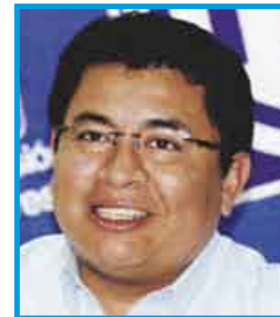
Alcántara y Quintas. Estancamiento albiazul.

"En la democracia hay opiniones distintas y deben respetarse. Yo no coincido, respeto a quienes