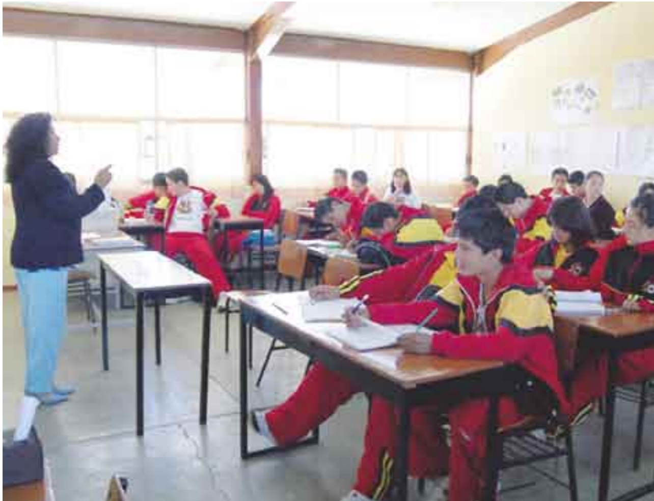
Larga espera de la niñez poblana para que se imparta la lengua inglesa.

por la prueba Enlace de este año, donde el 59.7 por ciento de los estudiantes en primaria recibieron puntuaciones de insuficiente en materias como matemáticas y español.