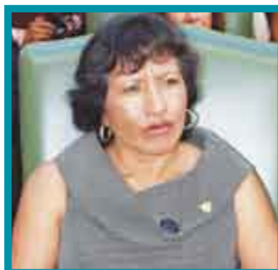
Robles, Salinas y Margarita. Debilidad partidaria.

derechos político- electorales de los militantes de ese instituto político.