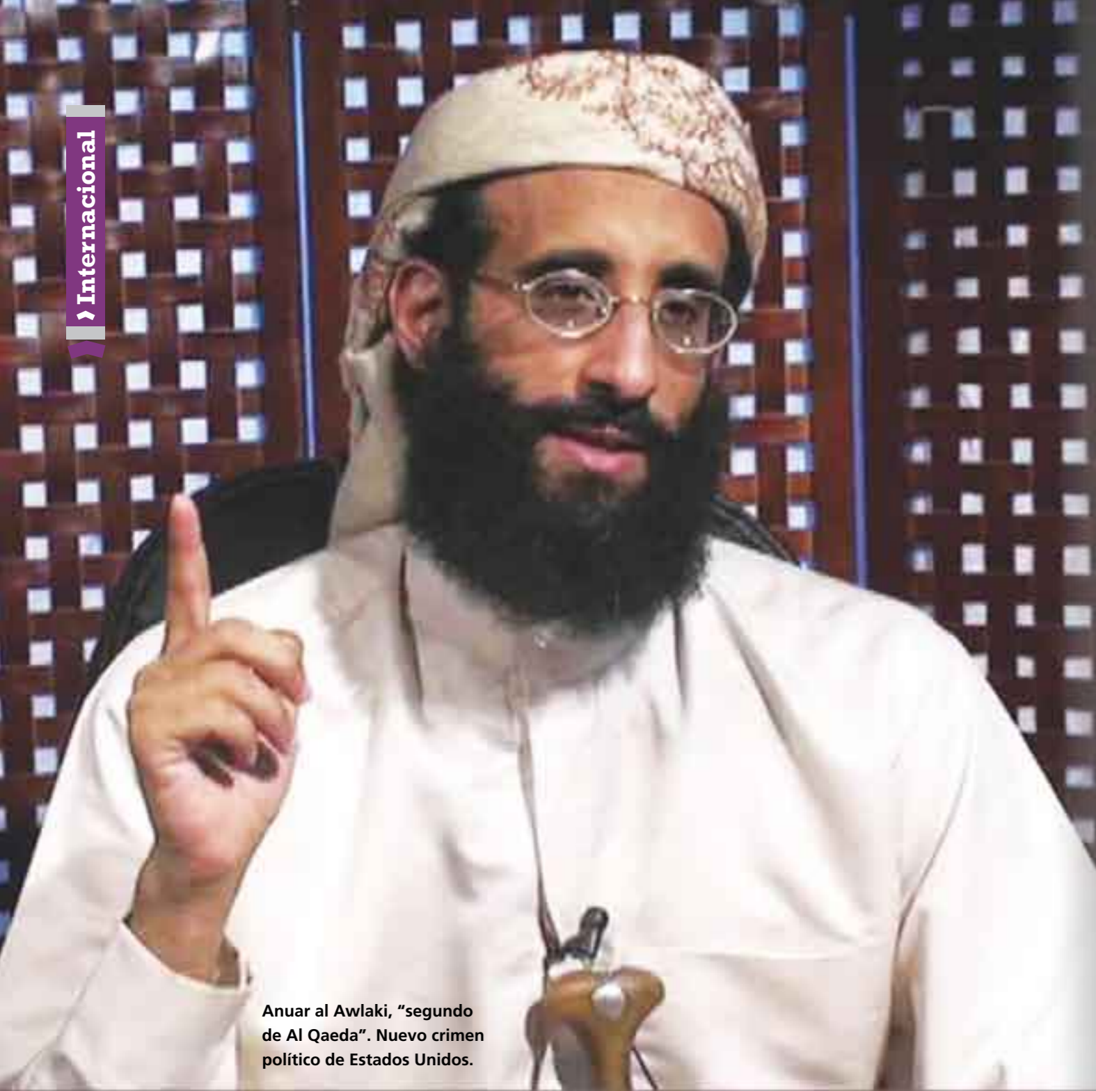
Anwar al-Awlaki, "segundo de Al Qaeda". Nuevo crimen político de Estados Unidos.