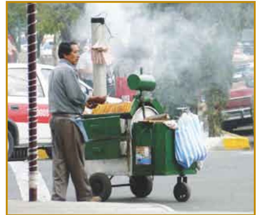
Empleo informal para sobrevivir.

A pesar de los extraordinarios beneficios que ha recibido en la última década el empresariado mexicano quiere más y mantiene su demanda de que si no hay reforma para flexibilizar la Ley Federal del Trabajo (LFT) y ganar competitividad, no generarán empleos.