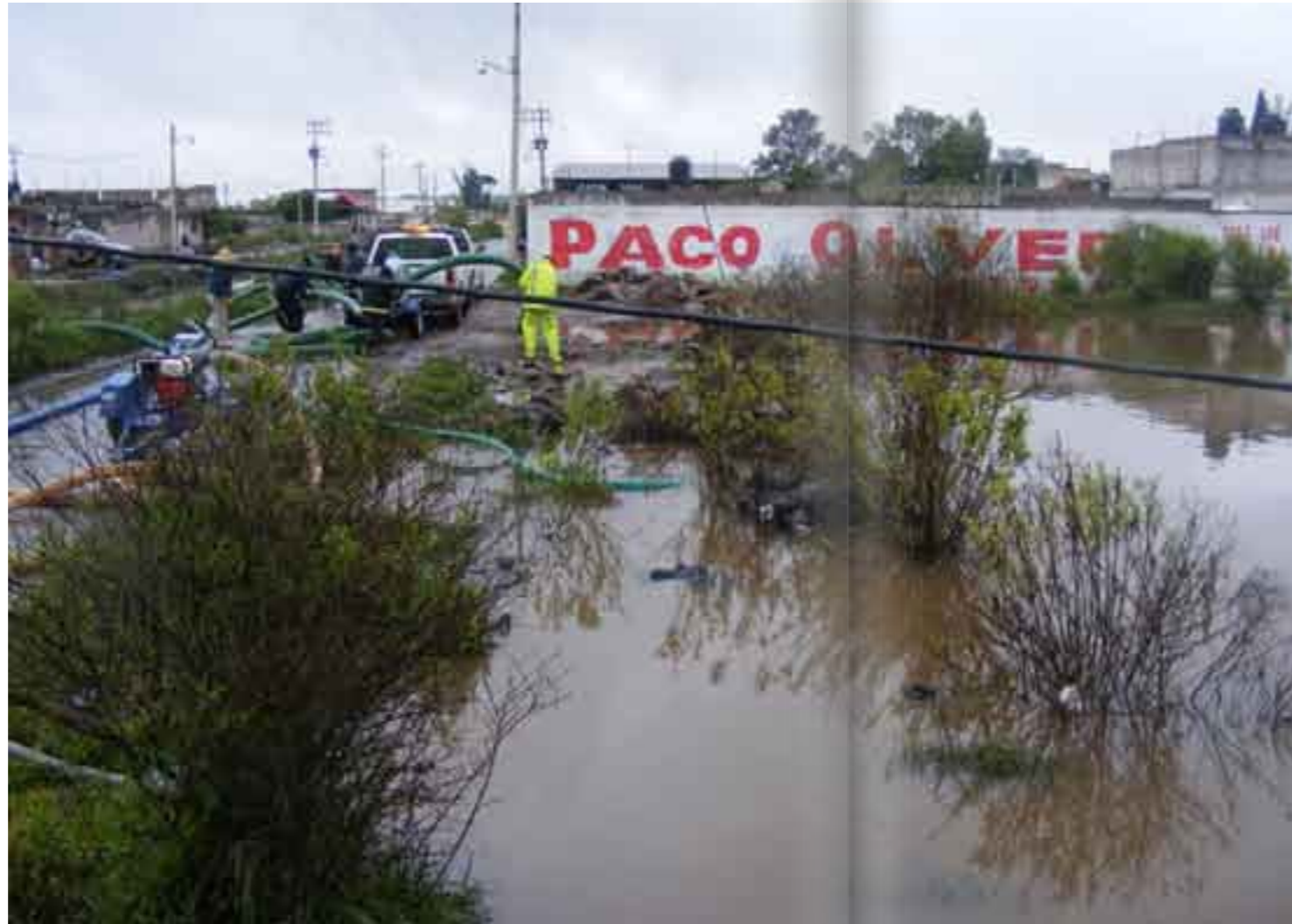
Tlaxcoapan paga las consecuencias de la desidia oficial para modernizar canales de aguas negras.

Pero no sólo la Conagua advirtió sobre los riesgos de inundaciones. Esta contingencia dejó al descubierto el descuido y errores en las obras de pavimentación de calles realizadas por el Ayuntamiento de Tlaxcoapan, municipio que forma parte de la región Tula-Tepeji, loca-