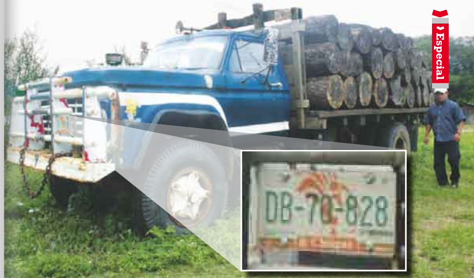
La invasión a Oaxaca alentada por los ricos de Chiapas.

La línea recta que dividía los territorios de Oaxaca y Chiapas ahora es una línea trazada en zig-zag por el lado del territorio de San Miguel. A una comunidad de San Miguel, la precede un ejido del municipio de Cintalapa, Chiapas. Así, de forma intercalada, se encuentran los ejidos chiapanecos Díaz Ordaz, La Flor de Chiapas, Ramón