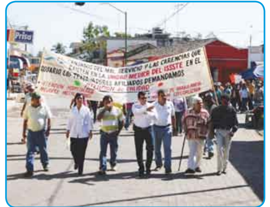
Trabajadores del ISSSTE pagan los platos rotos.