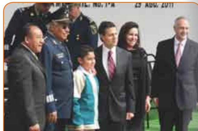
Gobernador del Estado de México, Enrique Peña Nieto, el secretario de la Defensa Nacional, Guillermo Galván Galván y la presidenta municipal, Azucena Olivares.

Escuela secundaria “Batalla del Monte de las Cruces” Escuela preparatoria “Batalla del Monte de Calpulpan”