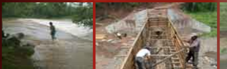
Construcción de un puente sobre el Río Azul, gestionado por el cauce del río en época de lluvias, dejaba aislados a los ca

Los antorchistas del Istmo se han convencido de que el Movimiento Antorchista, lejos de la confrontación, se ha avocado a organizar, educar e instruir a sus agremiados, a buscar el encausamiento de sus demandas.