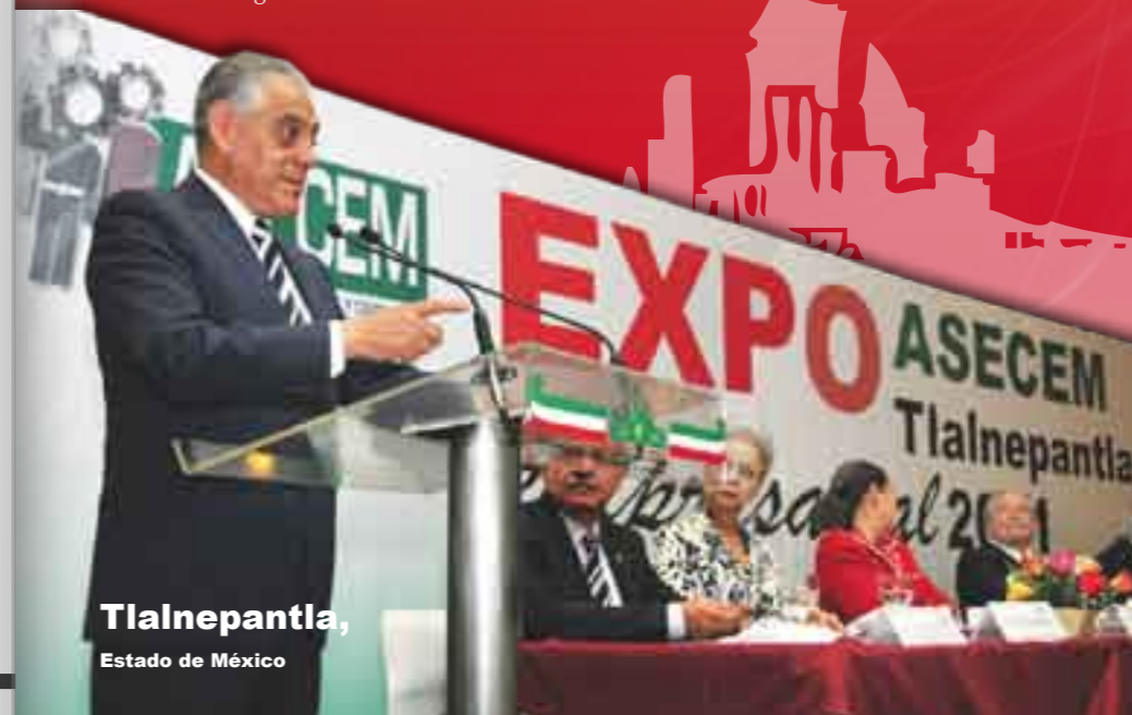
Tlalnepantla, Estado de México