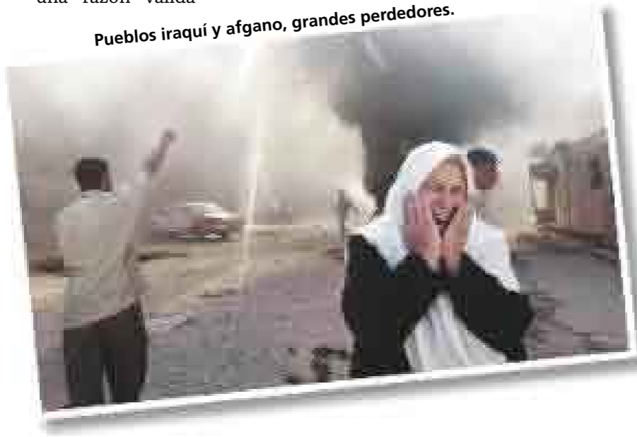
Pueblos iraquí y afgano, grandes perdedores.

Para el Doctor Sarquis la lección de los atentados de hace 10 años debe hallarse en “el análisis de las causas de fondo que generan el terrorismo. Es muy fácil decir que se trata de radicales fundamentalistas, que no entienden la política de Occidente; pero si estudiamos con más detenimiento y cuidado muchas de estas causas vamos a encontrar que hay preocupación genuina en otras sociedades por preservar sus bases culturales y sus formas de organización; y si atendemos a esta preocupación, que es muy válida, podemos pensar que una lección importante es referente a la tolerancia que debe haber”, concluyó. b