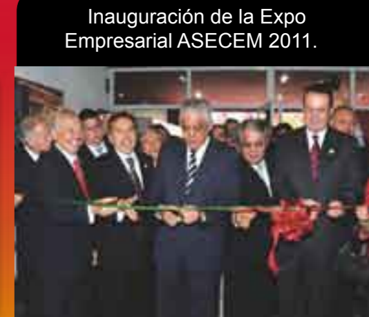
Inauguración de la Expo Empresarial ASECEM 2011.