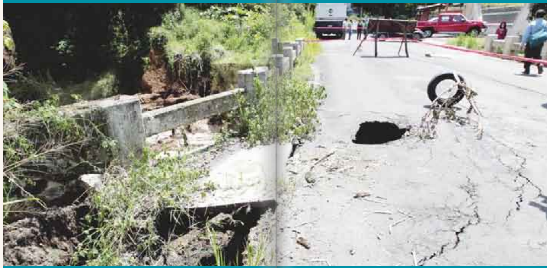
Veracruzanos, les llueve sobre mojado.