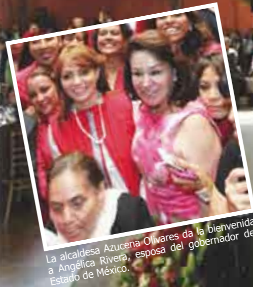
La alcaldesa Azucena Olivares da la bienvenida a Angélica Rivera, esposa del gobernador del Estado de México.

Municipio donde se ofrecen los mayores servicios para los adultos mayores.