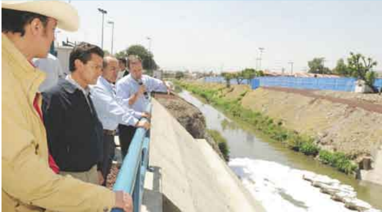
Remozamiento de obras. El cuento de nunca acabar.

y proyectos no se retrasen ni se alteren con los cambios de gobierno que este año y en 2012 habrán de darse, pues están conscientes de que en la entidad mexiquense hay por lo menos 36 organismos dedicados a dar servicios de agua potable, saneamiento y alcantarillado que ante los fuertes aguaceros recientes se han mostrado incompetentes para evitar las inundaciones.