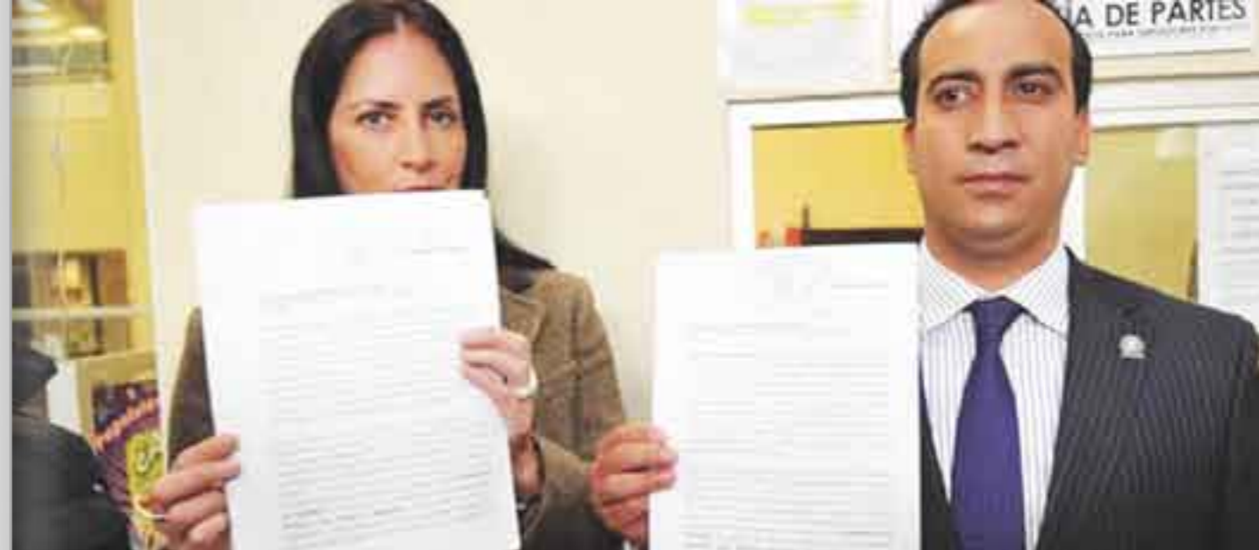
Limón y Calderón. Denuncia. Plan con maña.

En una petición posterior, esta vez por parte de la diputada Gómez del Campo a través de una carta dirigida al Ejecutivo local, se solicitó la publicación de los reglamentos de las leyes de derechos de las personas adultas mayores, cuyo texto no solicita la publicación de reglamentación alguna; y la de la Ley de Residuos Sólidos, cuyo reglamento se publicó en octubre de 2008 en la Gaceta . También se solicitó la expedición de las regulaciones complementarias para la Ley de Fomento