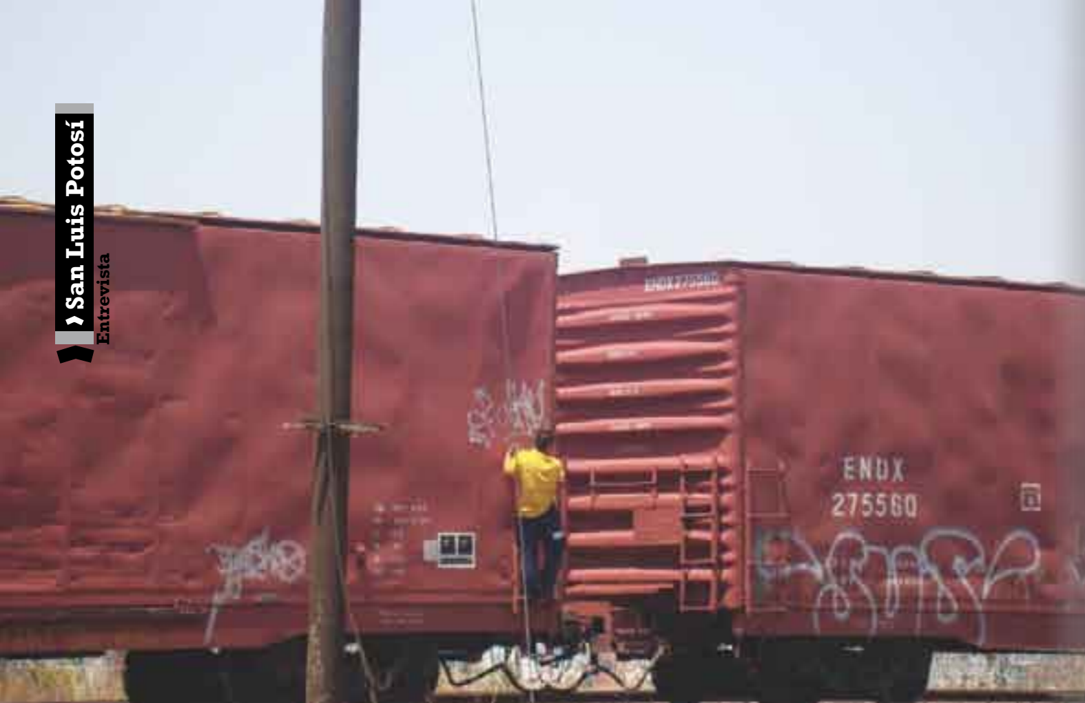
La Bestia. "Prueba" por la sobrevivencia.

que en realidad no le hemos dado la espalda a esta gente".