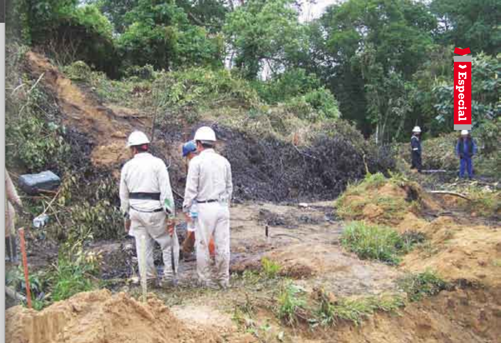
Funcionarios de la paraestatal. Impunes.