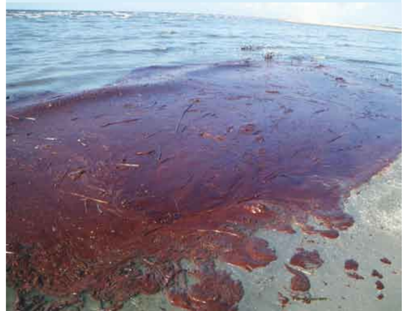
Imagen cotidiana en las costas oaxaqueñas.