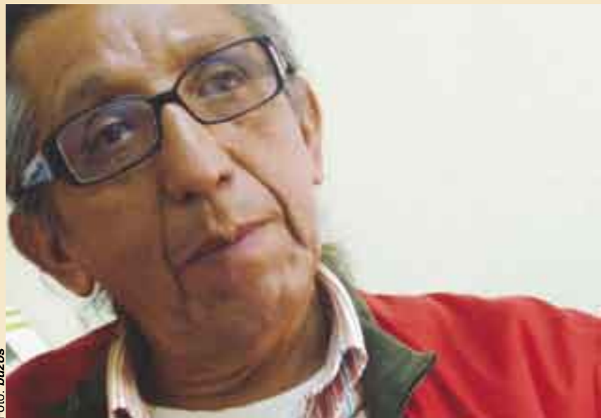
Denuncia incapacidad de instituciones educativas.

nerados -en el mejor de los casos relacionados con su área de estudio- cuando los jóvenes terminan sus estudios superiores.