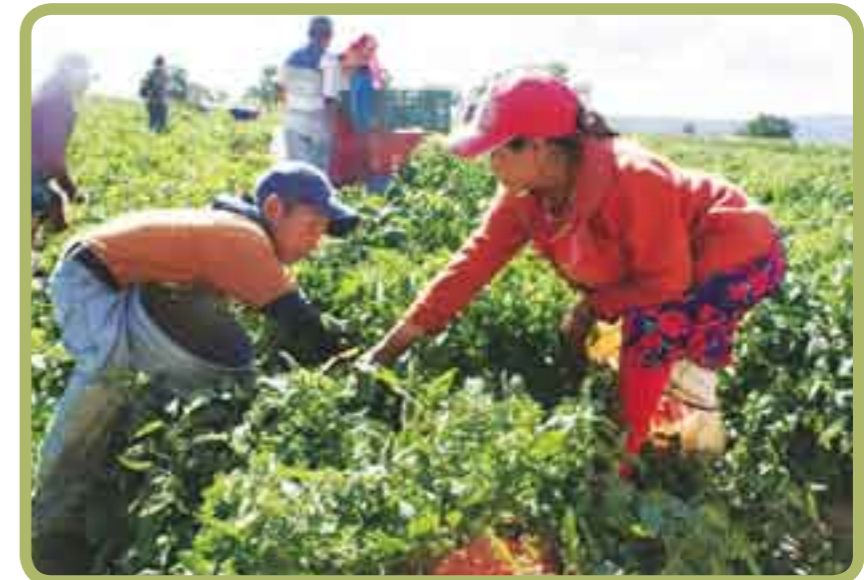
Niños michoacanos, obligados a madurar antes de tiempo.

Mientras que al amparo de las autoridades federales y estatales predomina el trabajo infantil en Michoacán, el presupuesto de 3