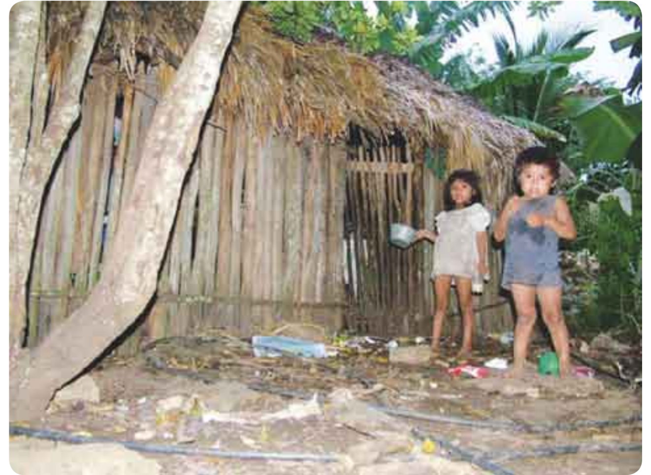
Los derechos humanos de los que no se ocupa el gobierno.