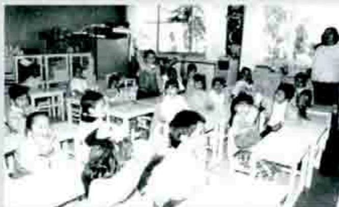
El actual Gobierno sigue poniéndole precio a la educación