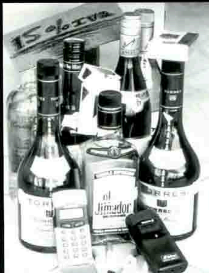
Se gravan productos de amplio consumo popular.

Secretario General de Antorcha Campesina