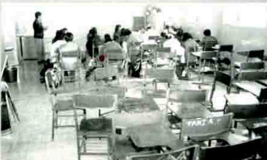
Reflejo de la falta de un proyecto educativo

Por otro lado, el dominio de las escuelas religiosas no permite la emancipación del pensamiento libre del hombre, porque es un error demostrado mezclar las ciencias exactas con la teología y el culto, y para variar vivir dentro de normas monásticas que no están de acuerdo con la dinámica de vida de esta época.