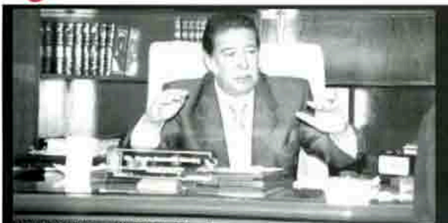
Los planes de la SEP para el 2002, foto: Miguel Saavedra