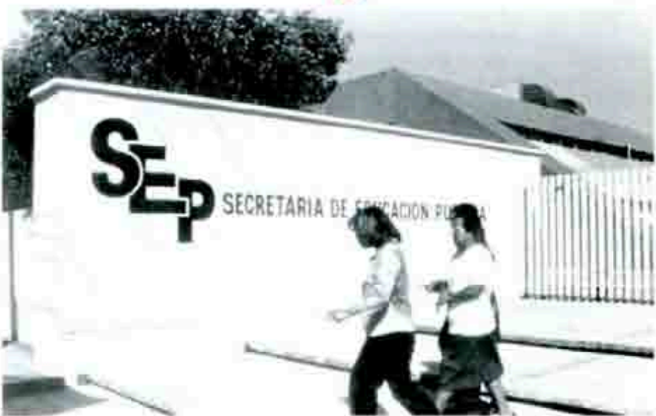
Seguimos exigiendo a la SEP que nos otorgue la clave y los recursos.