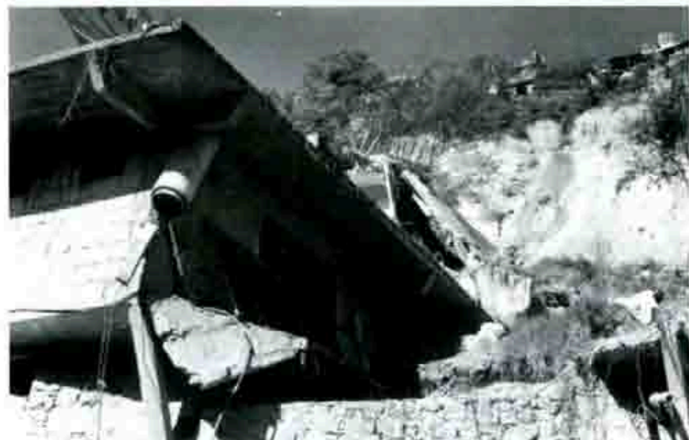
Desastros sísmicos de 1999, foto: Archivo