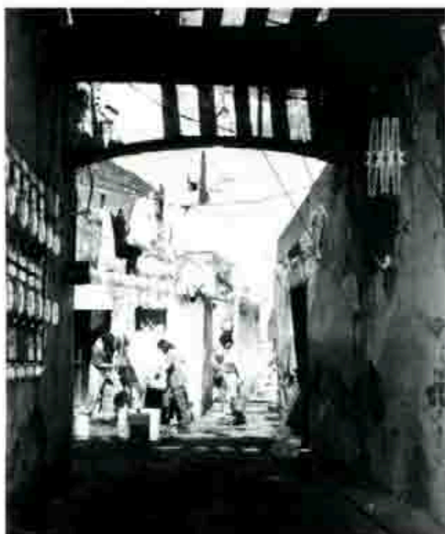
Viviendas Populares

mejoramiento de vivienda está dirigido a todas aquellas familias de escasos recursos y tengan un espacio propio y quieran ampliar, reparar o mejorar su vivienda.