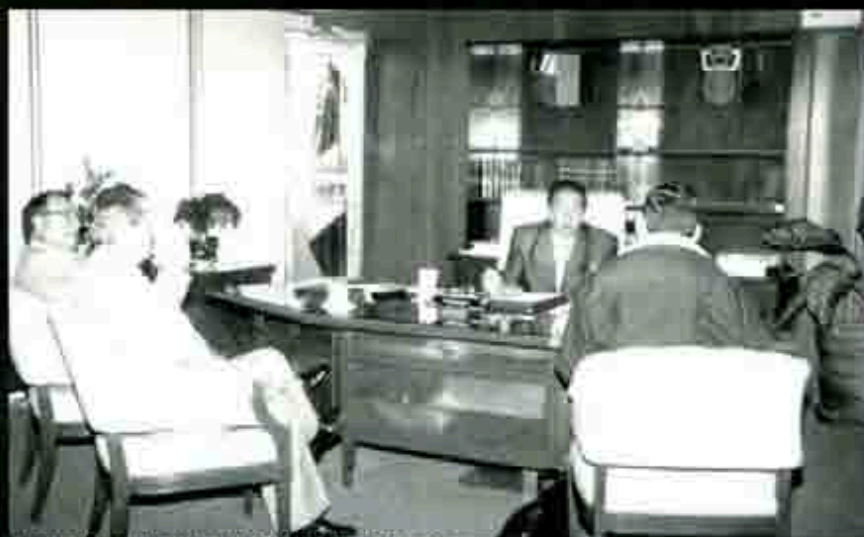
Los pendientes y las metas de la SEP

Sobre estos, el funcionario precisó "a pesar de las dificultades y obstáculos que se han interpuesto a la educación y a la SEP, hemos tenido avances signifi-