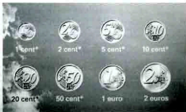
El Euro, moneda única de la Unión Europea

También se eliminarán restricciones importantes al movimiento de capitales, que se ve encarecido, entre otras cosas, por las comisiones cobradas por el envío y conversión