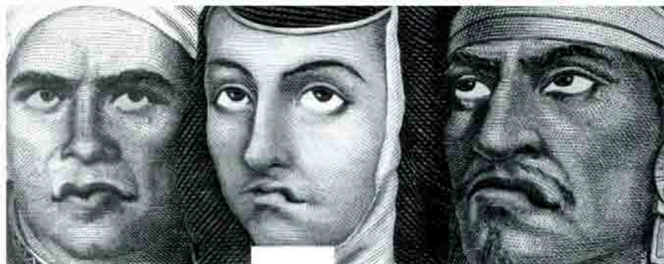
Presupuesto 2002, más recorte