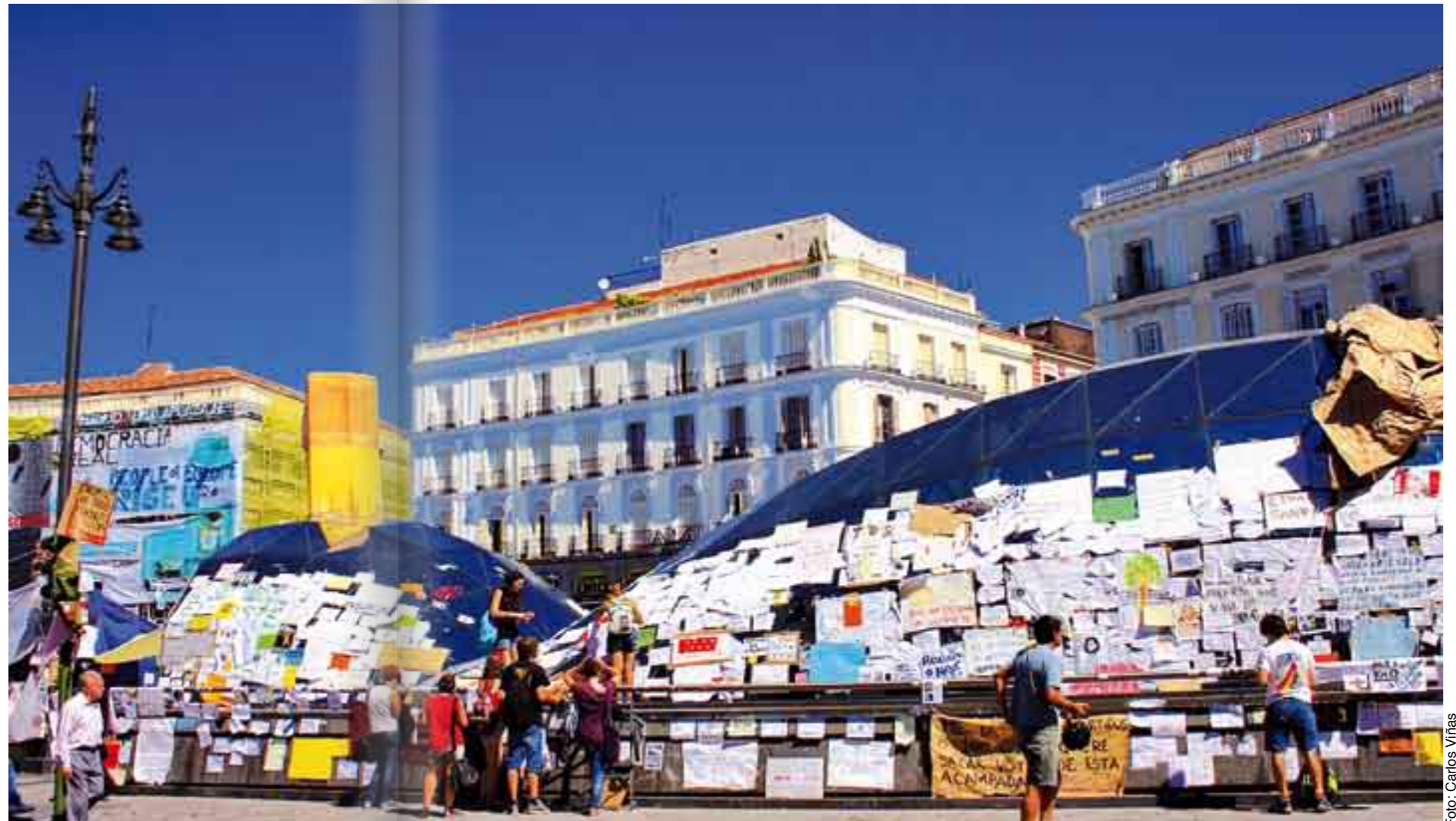
15-M. La crisis estadounidense hace eco en España.

Estas recomendaciones aún deben ser ratificadas por el Consejo de Ministros de Economía y Finanzas de la Unión Europea.