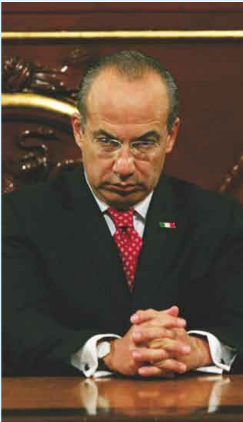
Panismo sin brújula.

Enterrada la eventual consolidación de alguna alianza PAN-Partido de la Revolución Democrática (PRD) hacia 2012, para lanzar un candidato ciudadano, se intensificaron las presiones