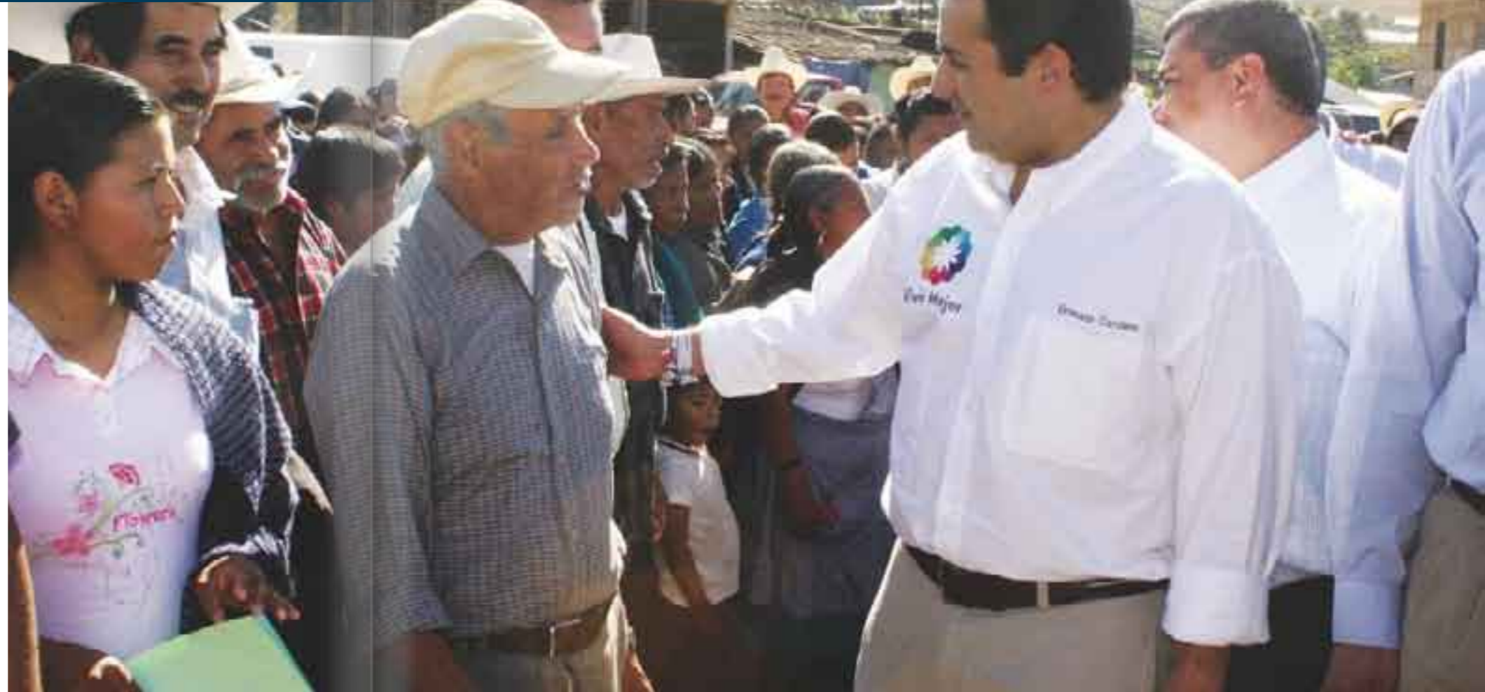
Cordero. Para él no existen pobres en México.

las finanzas públicas, Ernesto Cordero tiene toda la libertad de manejar el dinero hacia cuatro Fondos de Estabilización pero, como lo menciona la propia ASF, no se tiene un estricto control en la supervisión del manejo de ese dinero en específico, ni siquiera por parte de los legisladores de las Comisiones de Presupuesto y Cuenta Pública,