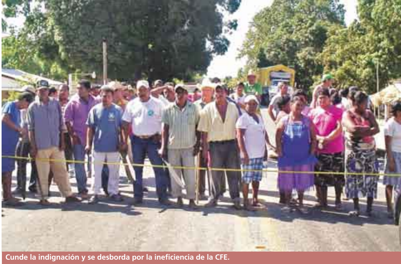
Cunde la indignación y se desborda por la ineficiencia de la CFE.

La energía que “compra” la CFE a autogeneradores la usa como suya y la distribuye y cobra, según sus tarifas, a sus más de 30 millones de clientes de todo tipo.