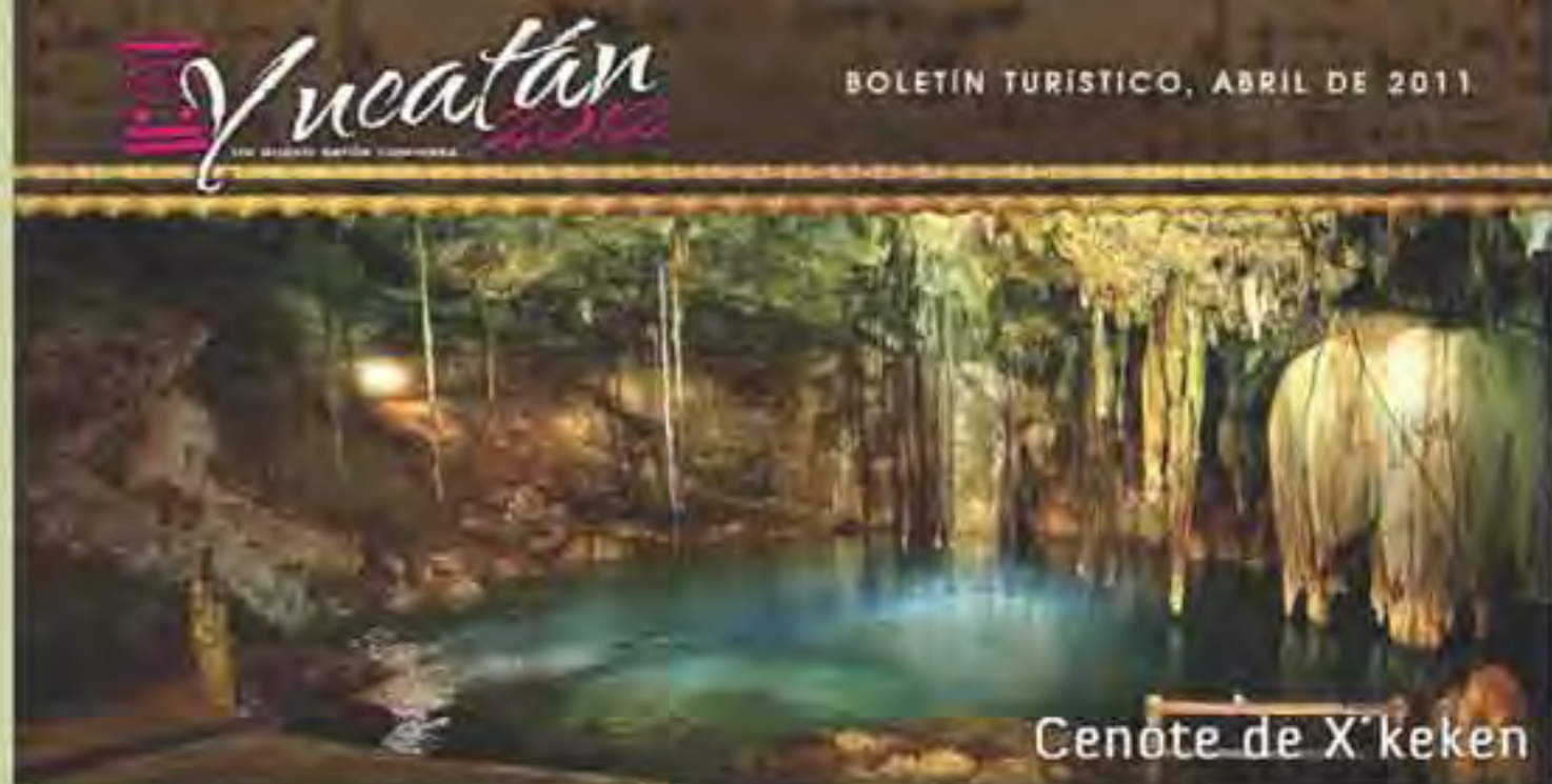
Cenote de X'keken