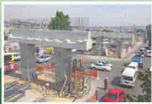
Puente vehicular Loma Linda

Construcción del paso a desnivel en avenida Lomas Verdes, el cual contribuirá a aliviar el aforo de tres mil 100 vehículos que circulan por hora en esta vialidad, beneficiando así a más de 400 mil habitantes de 23 comunidades; el presupuesto destinado es de más de 133 millones 700 mil pesos