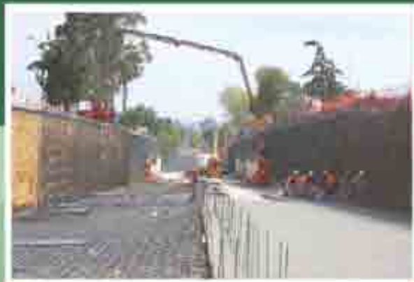
Paso a desnivel Lomas Verdes

Construcción del paso a desnivel en avenida Lomas Verdes, el cual contribuirá a aliviar el aforo de tres mil 100 vehículos que circulan por hora en esta vialidad, beneficiando así a más de 400 mil habitantes de 23 comunidades; el presupuesto destinado es de más de 133 millones 700 mil pesos