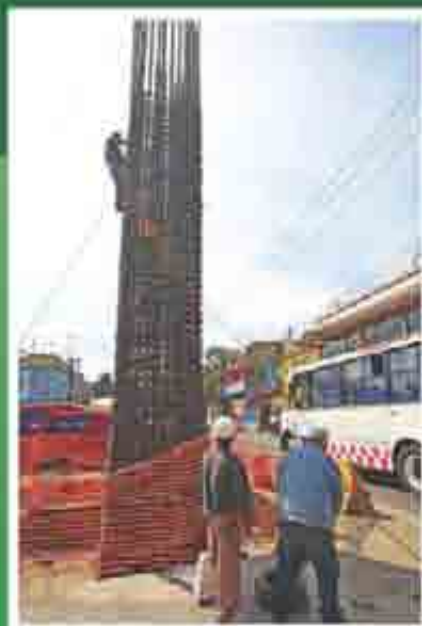
Distribuidor vial El Molinito

Construcción del puente vehicular Loma Linda, infraestructura que beneficiará a más de 800 mil habitantes de 75 comunidades aledañas y tendrá una inversión superior a los 126 millones de pesos , proveniente de recursos municipales.