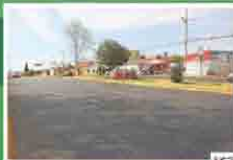
Repavimentación calle Andrómeda

Repavimentación con concreto hidráulico de la calle Andrómeda, en Satélite