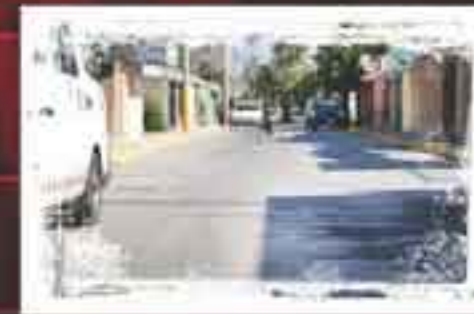
Pavimentamos Calle Nochebuena Unidad Morelos 3a. Sección