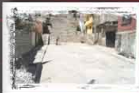
Pavimentamos calle Real Col. El Tesoro