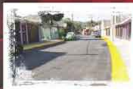
Pavimentamos Calle Margaritas Col. Izcaltl del Valle