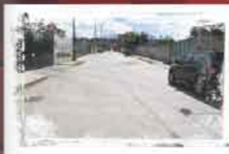
Pavimentamos la Avenida Miguel Hidalgo Col. San Francisco Chilpan