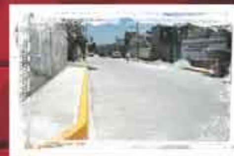
Pavimentamos Calle Josefa Ortiz de Domínguez, esquina Avenida las Torres Col. Benito Juárez