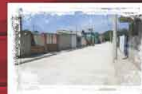
Pavimentamos con Concreto Hidráulico, Calle Alcanfores Col. Lázaro Cárdenas