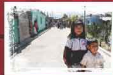
Pavimentamos Privada Berito Juárez San Pablo de las Salinas