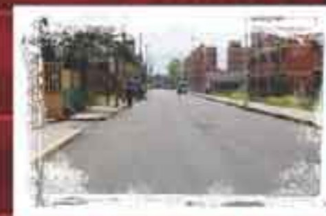
Repavimentamos Calle Encino Unidad Morelos 3a. Sección