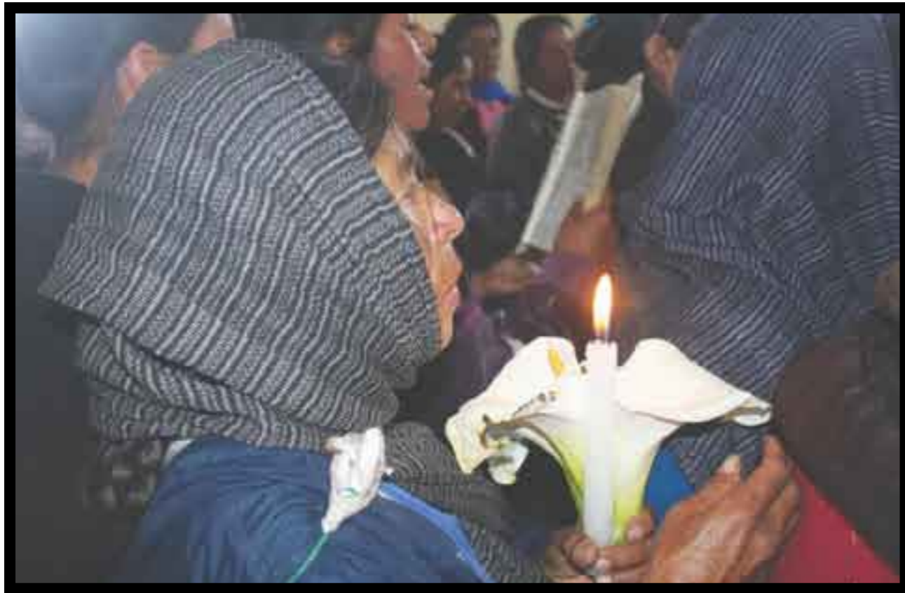
Dolor en la mixteca.

comenzó a lanzar propaganda repudiándolos; organizaciones no gubernamentales, civiles y eclesiásticas, resaltaron su preocupación porque el cambio estaba marcando un momento definitivo, no se sabía hasta dónde pararía la oleada de asesinatos, la condena de lo que sucedía originó marchas y manifestaciones en el centro de la capital, pintas por todos lados y la rabia impotente por no saber a quién dirigirse, pues en esos tiempos la transición era la preocupación del gobernador saliente y la recepción por parte del ahora mandatario estatal.