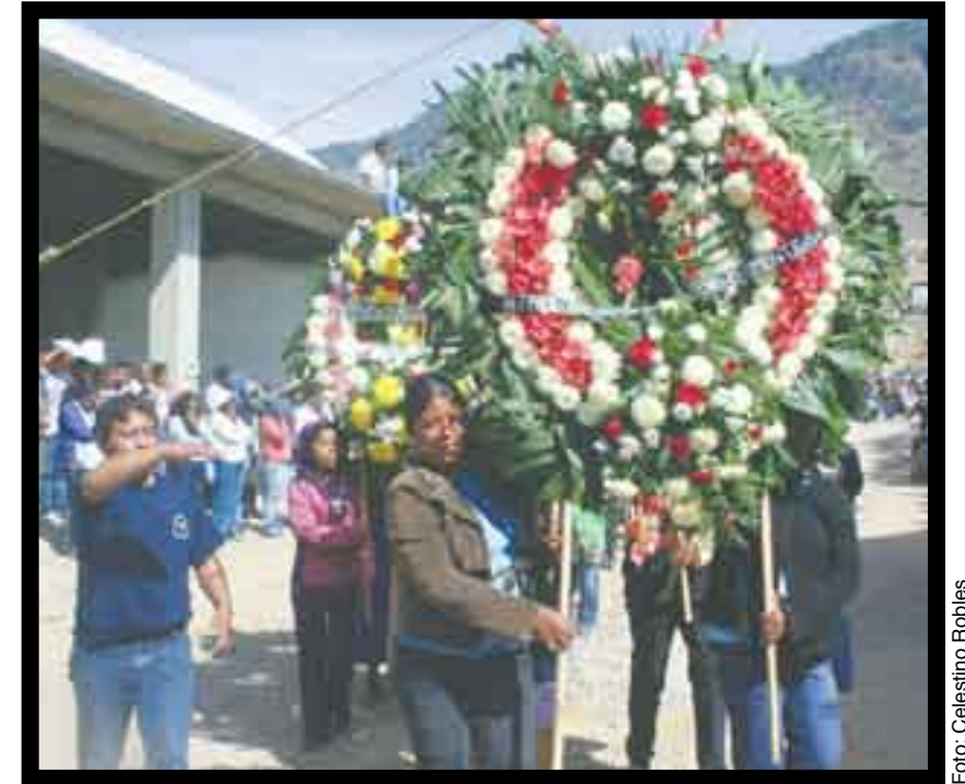
Adiós al héroe de Sabinillo.

vacío en la zona. El campesino que se dedicó años al trabajo de concientización y ayuda para muchos pobres se despedía de sus hermanos de lucha, de su casa y de su familia en una sentida ceremonia, los más viejos amigos del difunto, arrojando flores al paso del cortejo fúnebre, enseguida la banda y haciendo una valla los amigos. Primero a la iglesia a recibir las