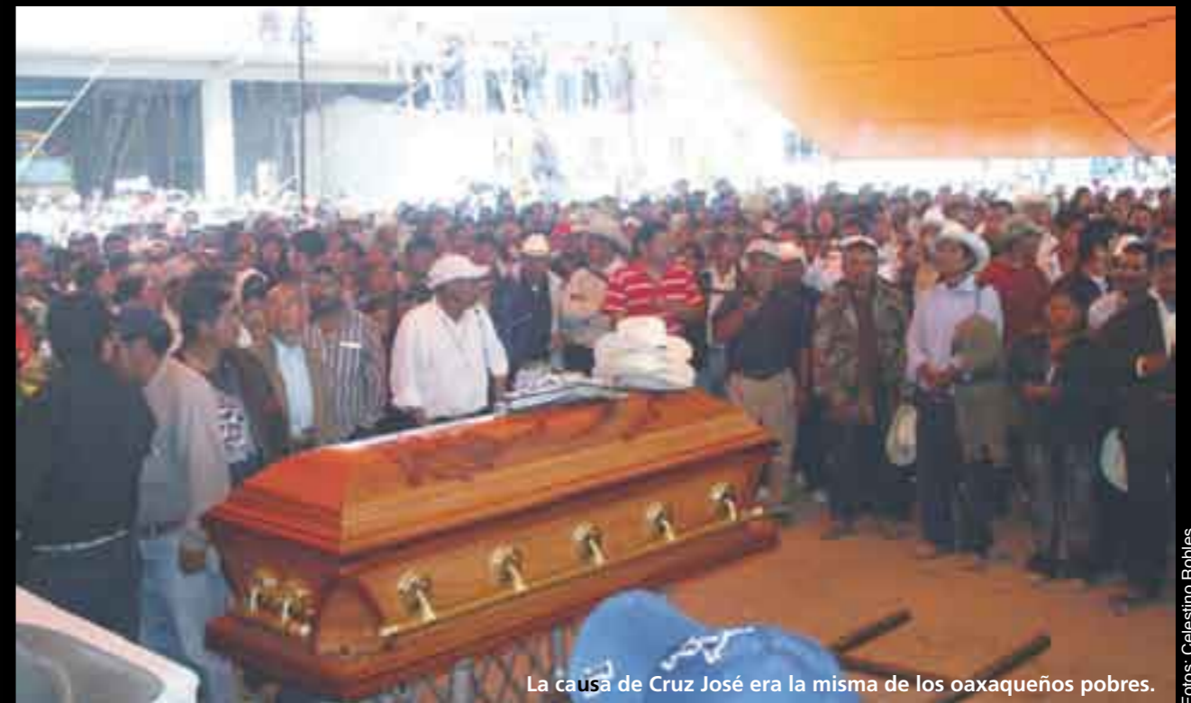
La causa de Cruz José era la misma de los oaxaqueños pobres.