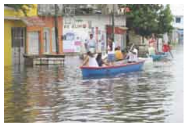
Panismo. Promesas fallidas.