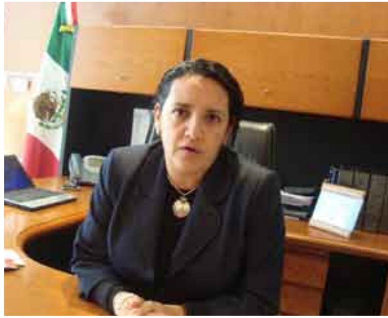
Meade. Defensa a ultranza.

terreno me iban a quitar; sólo me dijeron que iban a respetar mi casa y me quitaron mucho. En total somos como 15 afectados. A mí me quitó Bárcenas Pous unos mil 600 metros cuadrados, aunque desde antes López Palau me enviaba gente a decirme que moviera mi casa. Yo les decía: ¿de qué voy a vivir? Y ellos me decían: 'te hago la casa pero muévete para hacer obra pública'".