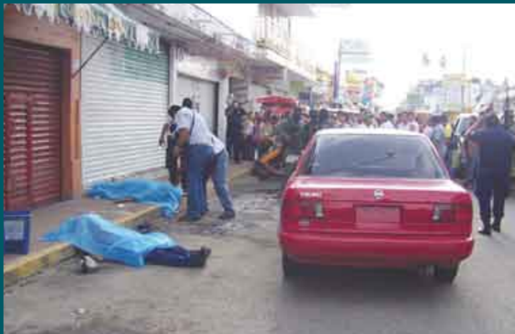
El costo del miedo.

como la corrupción que anima el consumismo, el armamentismo, el narcotráfico y, por supuesto, de muchas otras prácticas de las que echa mano para sustentarse dentro del discurso de una doble moral sin fondo”.