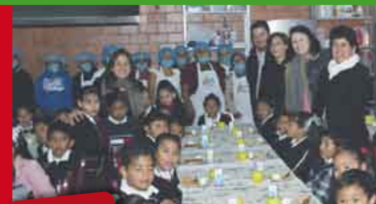
Naucalpan, Estado de México

"Con este nuevo desayunoador escolar mejoraremos la alimentación de los menores que asisten a este plantel ubicado en la colonia Tierra y Libertad, ya que son las zonas marginadas donde se registran más casos de desnutrición en los niños", recalzó la alcaldesa al mencionar que una buena alimentación durante la infancia es fundamental para el buen desarrollo de los pequeños.