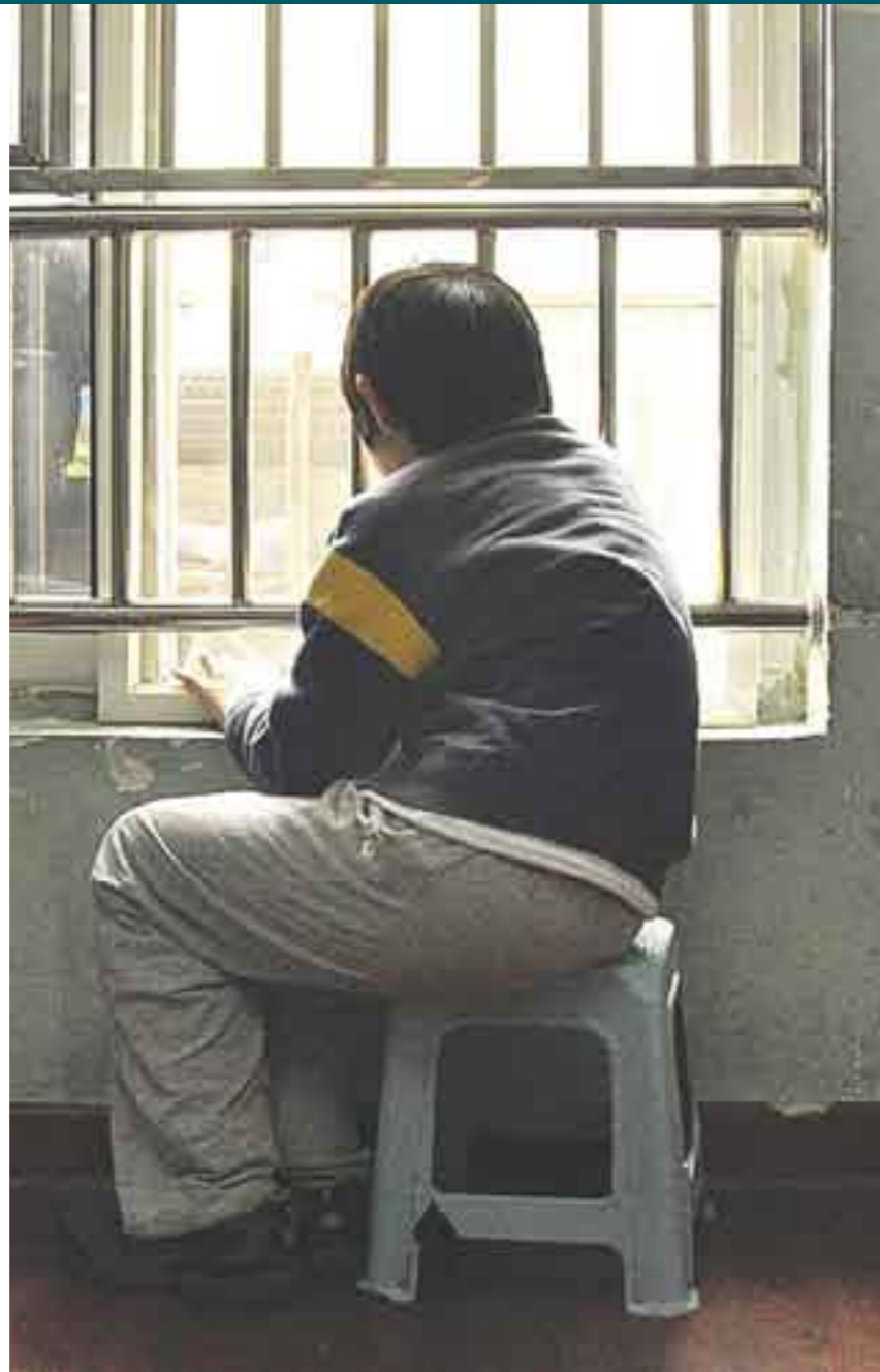
Narcotráfico. Promoción oficial del miedo.

“La mayoría de nosotros ha oído hablar de ese ser fabuloso y divino conocido como Minotauro (de Minos nombre de un rey y taurus que significa toro, por lo que la palabra quiere decir “Toro de Minos”). Pero toda palabra implica concepto y por ello tenemos que entrar en uno de los referentes que animan su comprensión y que es la interpretación. El concepto que ampara la interpretación de este sujeto de análisis implica un