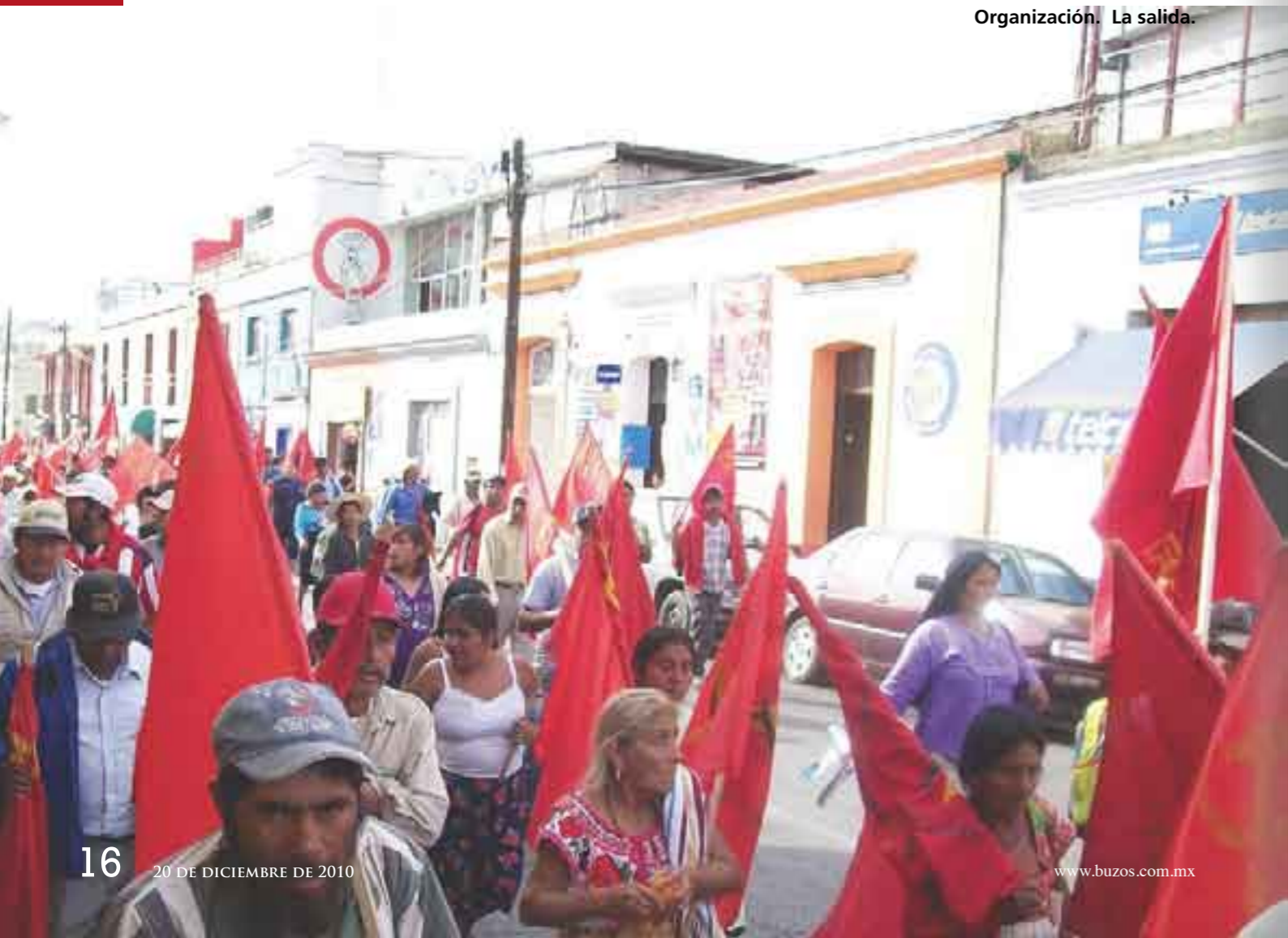
Organización. La salida.

vía, como el Partido Democrático Popular Revolucionario, brazo político del Ejército Popular Revolucionario (PDPR-EPR).