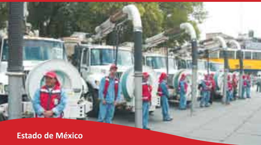
Estado de México

El gobierno del Estado de México impulsará diversas obras de infraestructura hidráulica, compra de vehículos y maquinaria para atender las contingencias que se presenten.