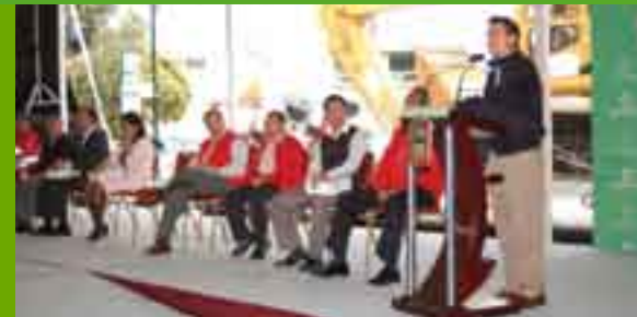
El gobernador mexiquense, Enrique Peña Nieto, dio el banderazo de inicio de actividades del Grupo Tláloc y entregó vehículos.