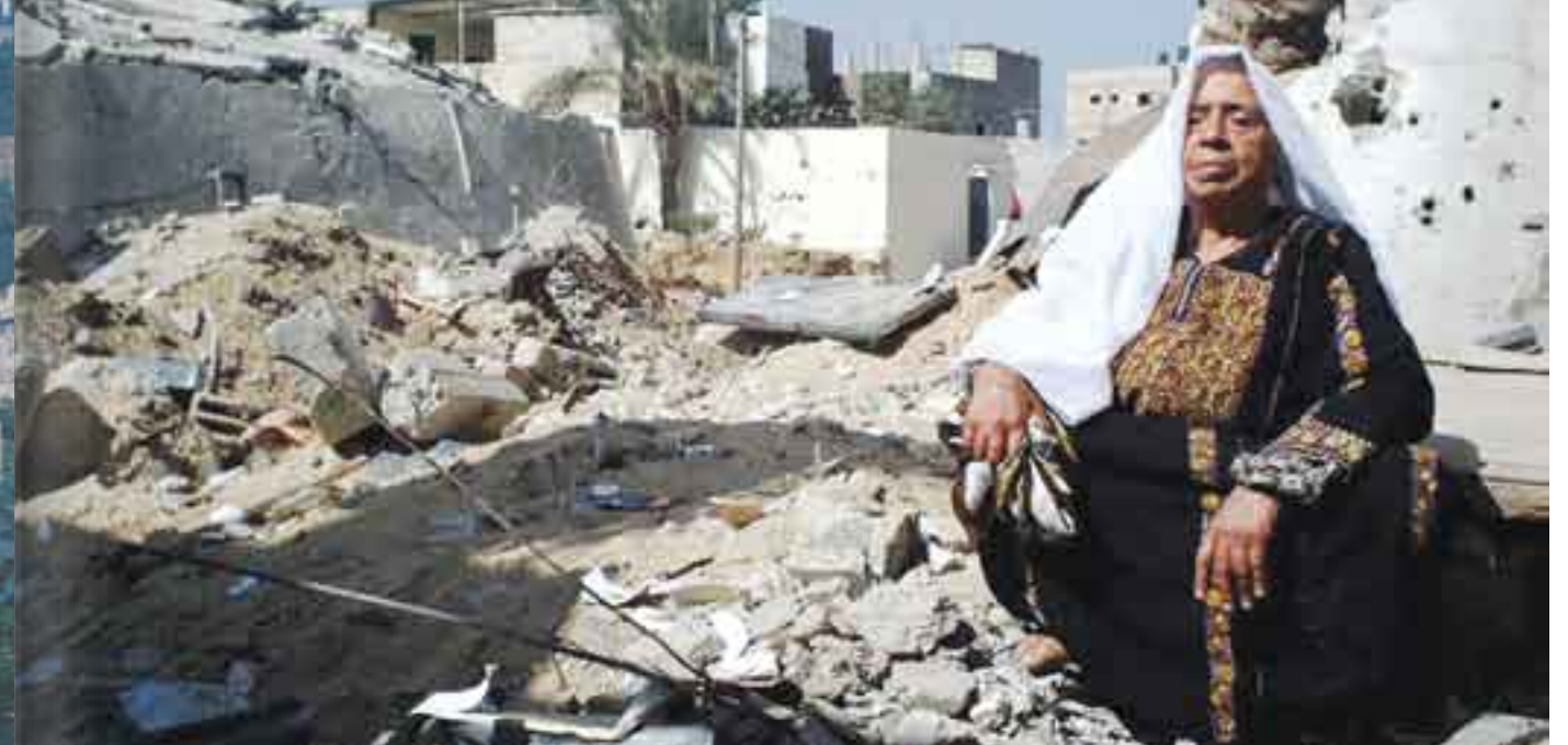
Israel, eterno aliado estratégico de Estados Unidos.

“Lo interesante es que respecto al proyecto nuclear iraní, las alianzas que están generando por debajo del agua entre Israel y los países árabes para contener el avance iraní podrían también ser un factor interesante que en algunos meses -si Irán sigue renuente a abrir su programa nuclear- va a poder contener a Irán”, adelantó Hamra.