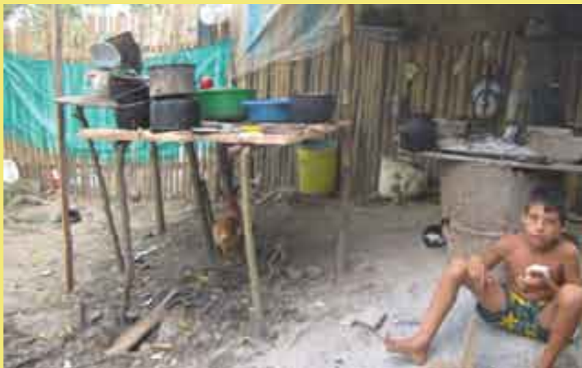
Colombianos apuestan a la continuidad.

creación de 2.4 millones de empleos y la incorporación a la economía formal de medio millón de trabajadores. Esto lo hará mediante un plan para simplificar el pago de impuestos -trámite que, propone, se realizará una vez al año, en lugar de cada dos meses- e impulsará la formación profesional.