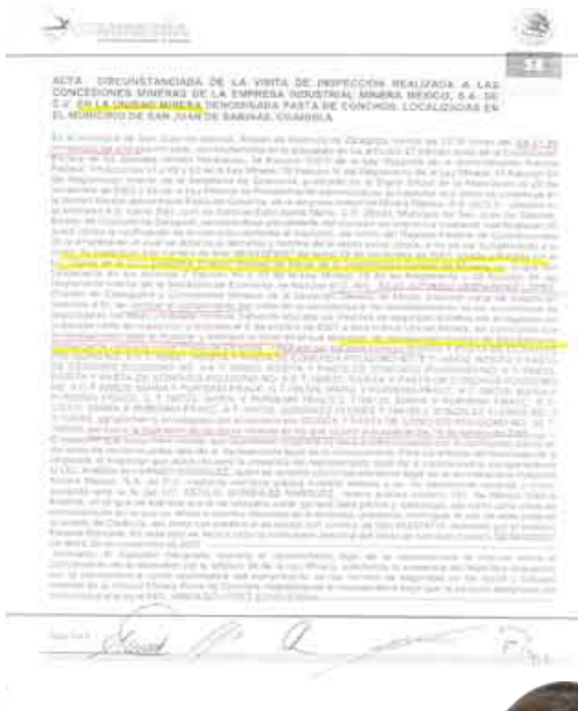
La orden de Moreira, que no dice nada.

En octubre de 2006, la dirección de Minas dio 30 días a la empresa para sacar el agua concentrada en la mina, controlar el gas, y restablecer el sistema de ventilación. Para el 21 de noviembre de 2007 el consorcio no había hecho nada. “Entonces se le dice que, por no haber cumplido con los normas de seguridad, se le suspendía la explotación del yacimiento, todo el perímetro, no sólo la mina, todo el yacimiento, entonces no pueden hacer ningún trabajo ahí, hasta que se garanticen las condiciones de seguridad (aunque lo hicieron)”, explicó Auerbach.