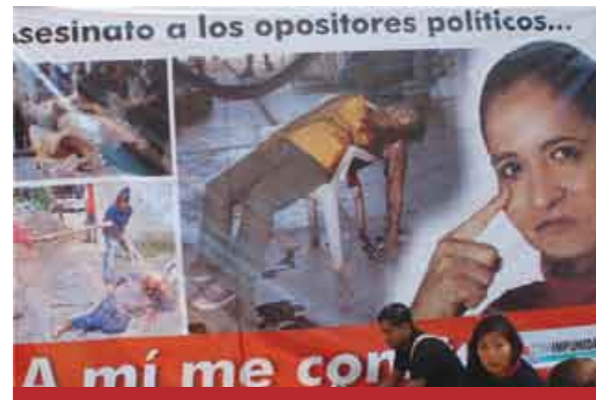
"Guerra sucia" electoral.