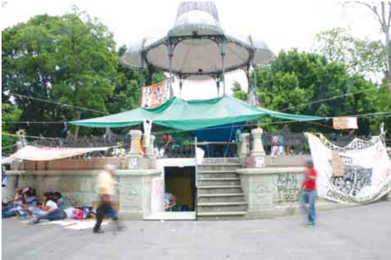
Docentes oaxaqueños. Sin apoyo ciudadano.