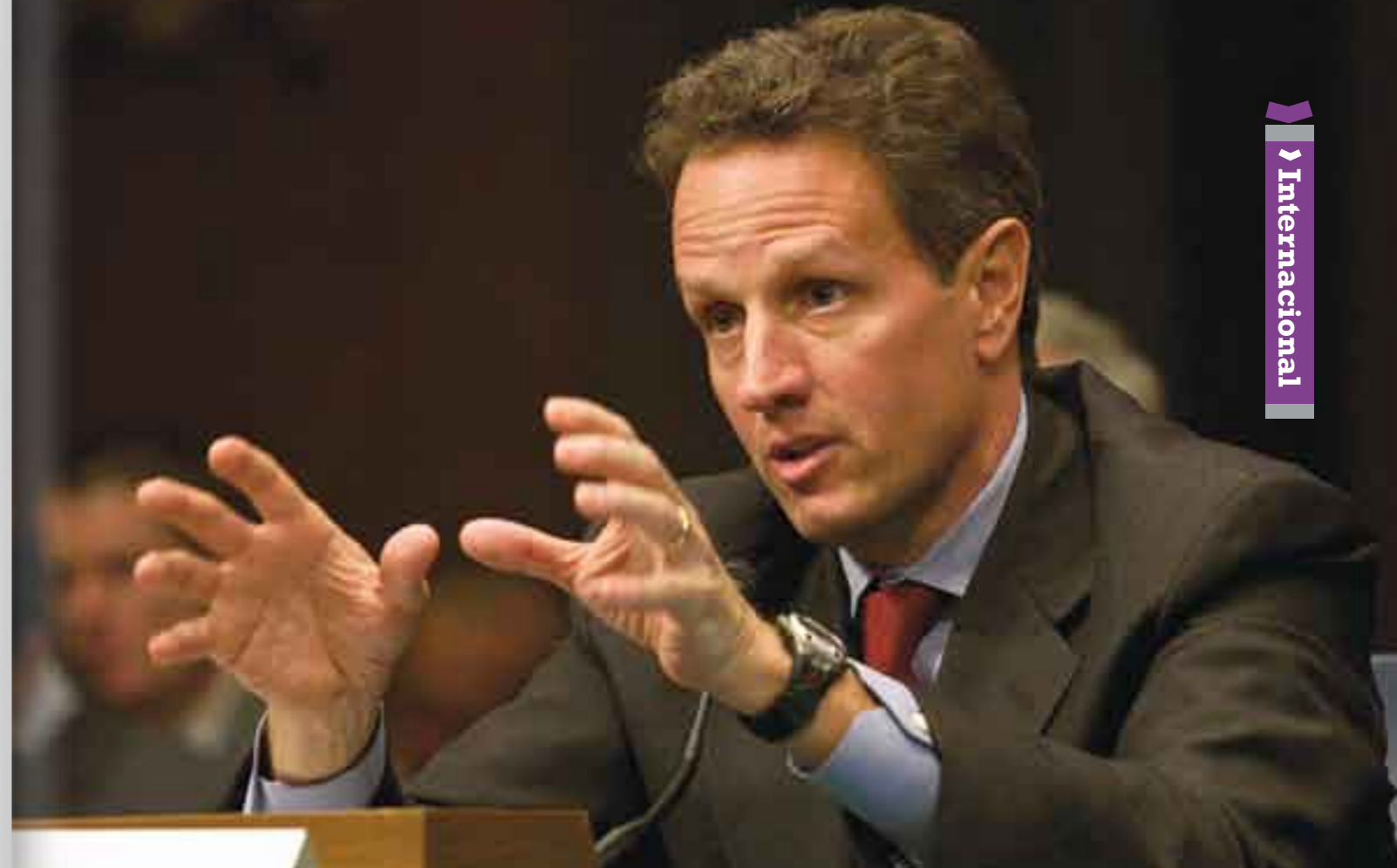
Timothy Geithner saca las unas por el déficit comercial estadounidense.