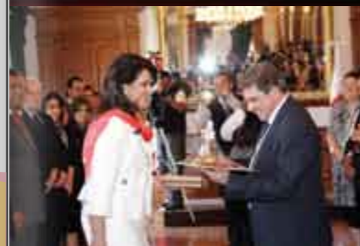
Toluca, Estado de México