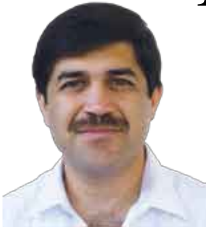
BRASIL ACOSTA PEÑA

En tiempos recientes ha sonado con mucha fuerza el concepto económico conocido como outsourcing , término que proviene del inglés y que literalmente significa: “externalizar”. Primero, trataré de esclarecer el concepto económico mencionado y, en seguida, explicar por qué están muy interesadas las empresas dedicadas a esta labor en que se apruebe la reforma laboral tan llevada y traída por el gobierno federal a través de su representante del ramo: el secretario del Trabajo, Javier Lozano Alarcón.