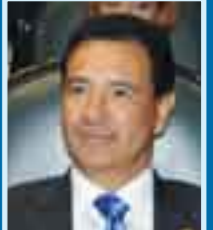
Dip. Carlos Madrazo