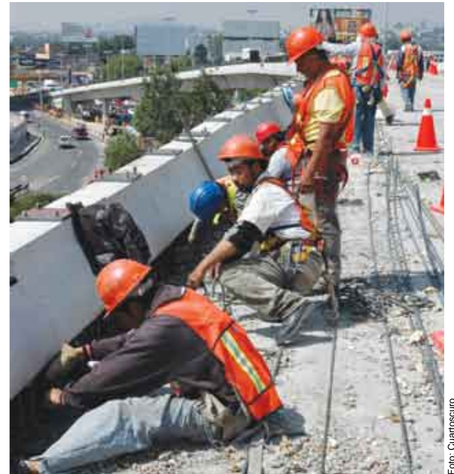
“Outsourcing”. Una medida a modo del gobierno a favor de los empresarios.

El miércoles 1 de Mayo de 2002, en Los Pinos, un representante empresarial hablaba durante un evento conmemorativo del Día del