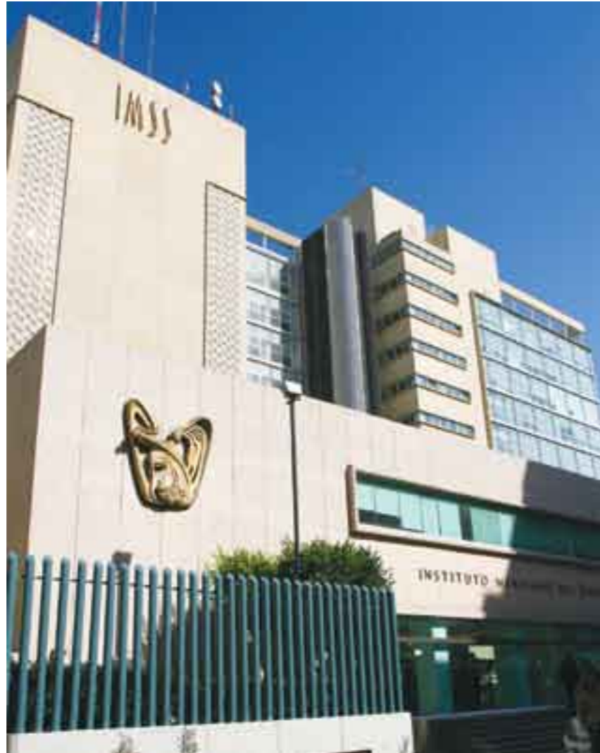
Proyecto de reforma laboral, contra trabajadores del IMSS.

De acuerdo con alcalde, la reforma planteada “es contraria a la Constitución y a los convenios internacionales en materia de li-