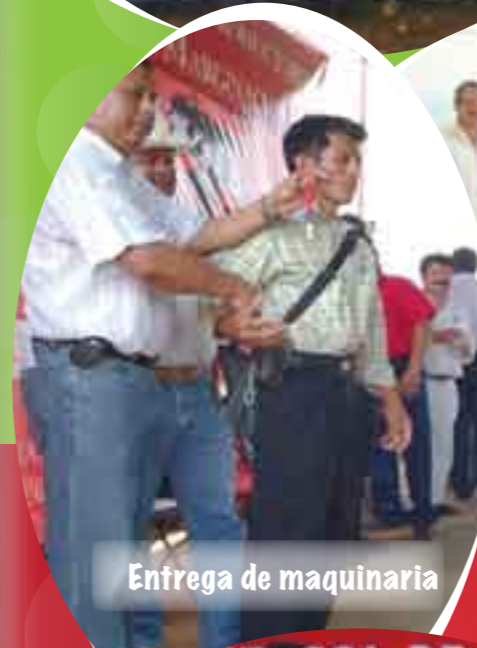
Entrega de maquinaria