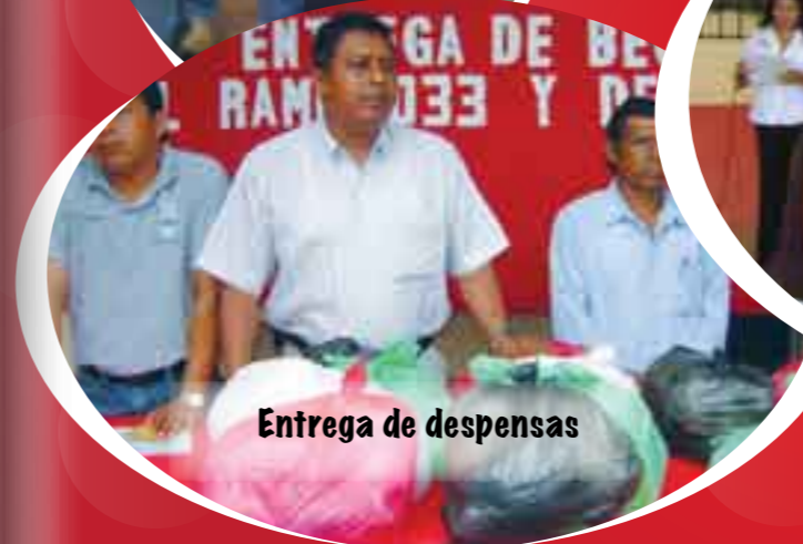
Entrega de despensas