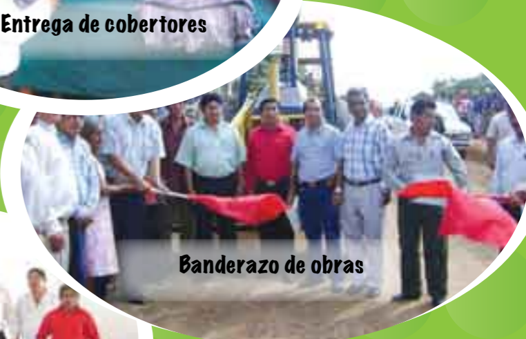
Banderazo de obras