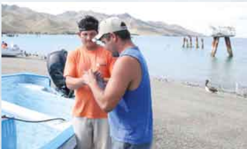
Pescadores de Punta Belcher.