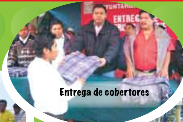
Entrega de cobertores