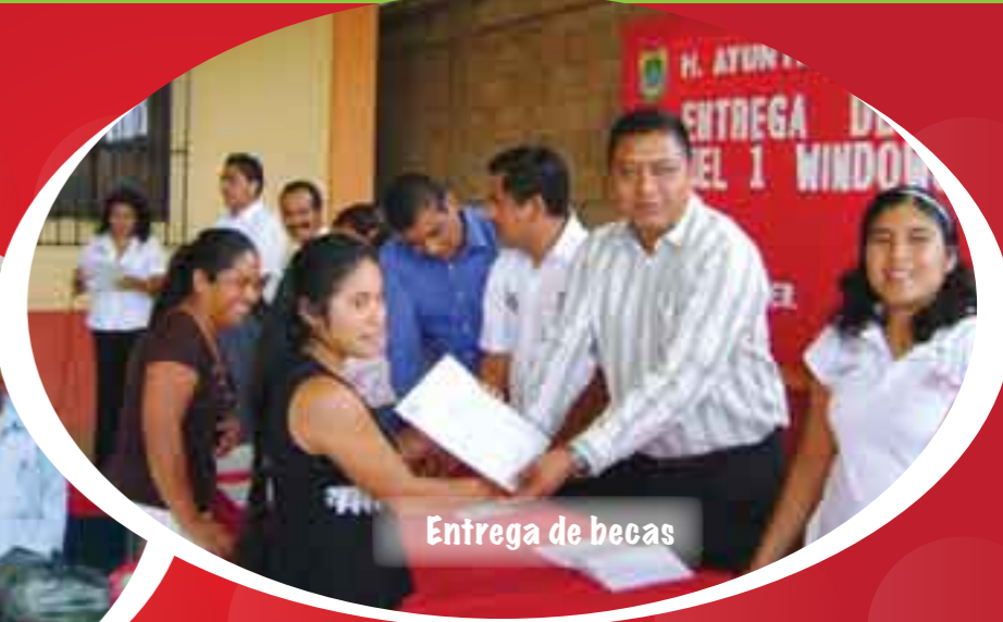
Entrega de becas