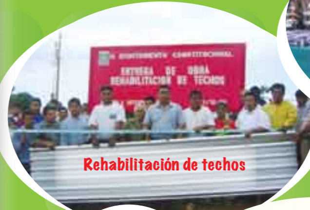
Rehabilitación de techos