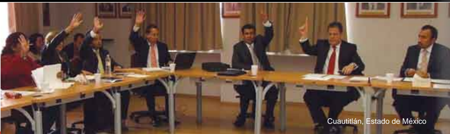
Cuautitlán, Estado de México

Todos ellos, perredistas, panistas y priístas, aguardan los tiempos para lanzarse en busca de las respectivas candidaturas, mientras que un debilitado Leonel Godoy Rangel, observa cómo el tiempo se le agota y su gobierno no convence a los 4 millones de michoacanos.†