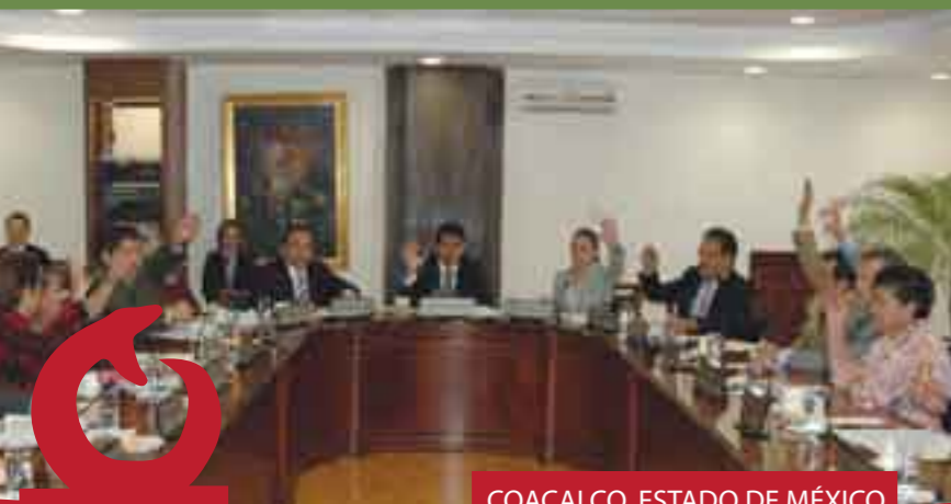
COACALCO, ESTADO DE MÉXICO

eficaz; también, tendrá atribuciones para proponer al ayuntamiento proyectos y estrategias para una mejor presentación de los servicios de salud, promover programas de salud en los que participen organizaciones nacionales e internacionales en lo relativo al programa de salud municipal.