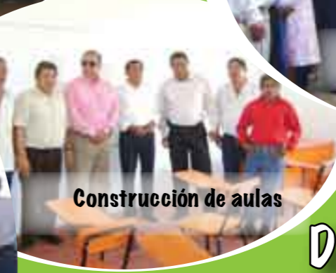
Construcción de aulas