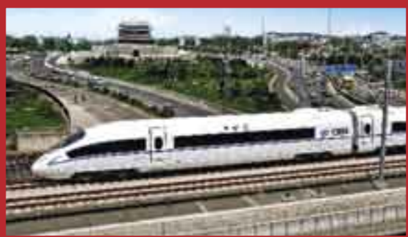
El tren de la línea interurbana de alta velocidad entre Beijing y Tianjin. La velocidad de diseño llega a 300 km por hora, y el tren puede alcanzar una velocidad de 350 km por hora.

En 1949, cuando la Nueva China acababa de ser fundada, el entonces secretario de Estado de Estados Unidos, Dean Gooderham Acheson, afirmó que el gobierno comunista no podría alimentar a sus 546 millones de habitantes, al igual que no pudieron hacerlo sus predecesores.