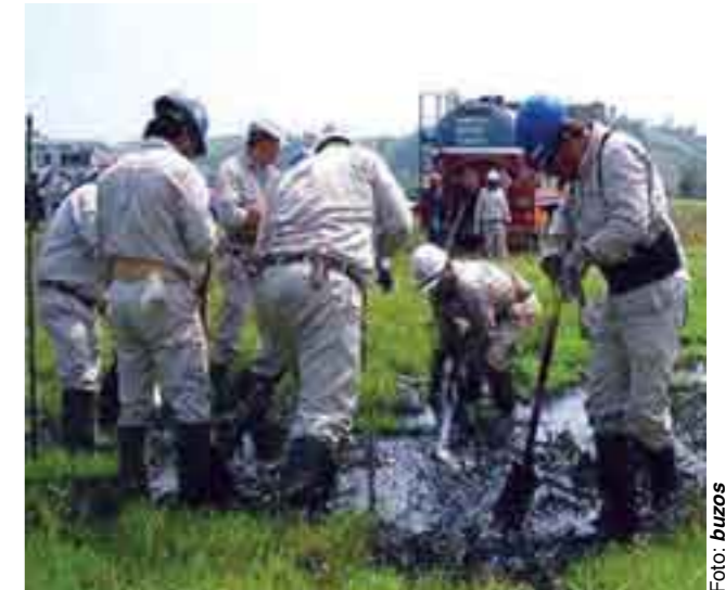
Socialización de las pérdidas...