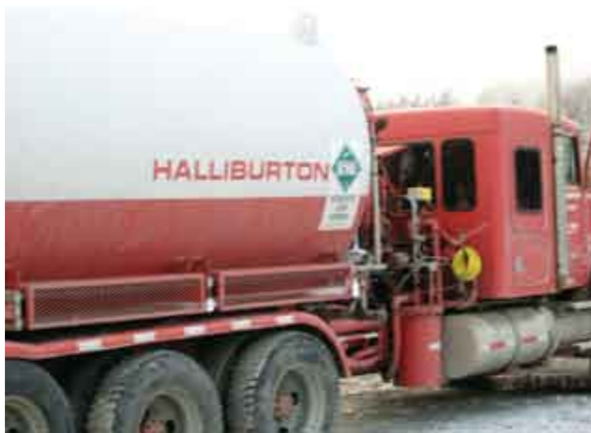
Transnacionales ganarán, Pemex perderá.

garantizar el cumplimiento de los compromisos”.