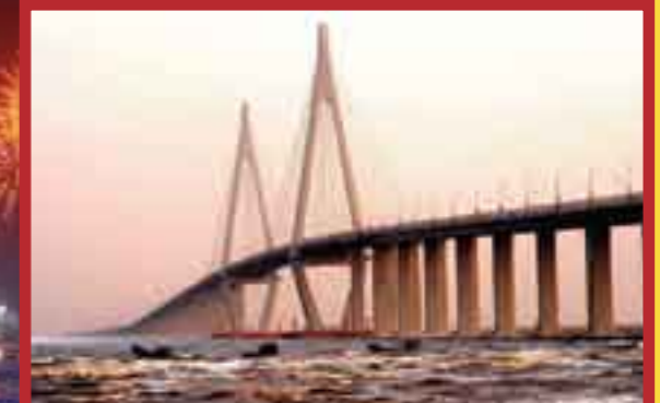
El puente marítimo más largo del mundo, que está en la bahía de Hangzhou, este de China.