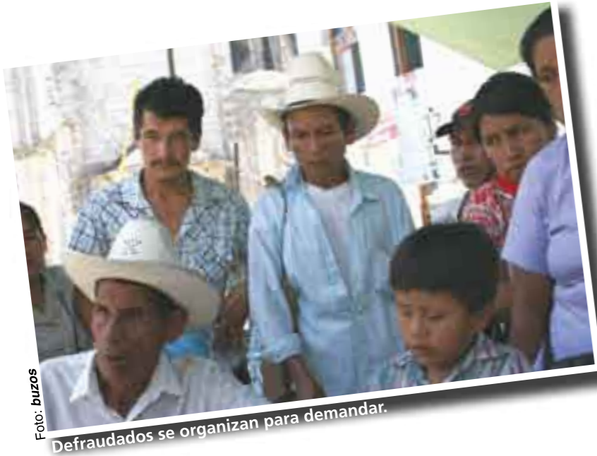
Defraudados se organizan para demandar.