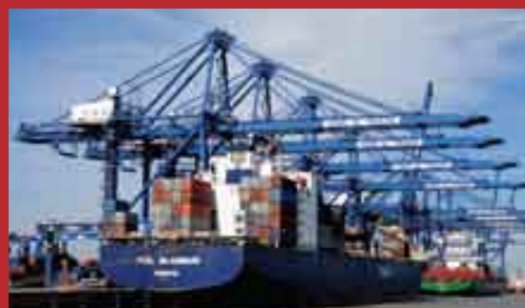
El puerto de la municipalidad de Tianjin, en la bahía Bohai, en el este de China.