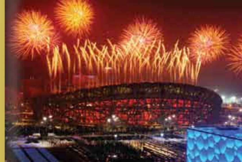
Fuegos artificiales en la celebración de inauguración de los Juegos Olímpicos Beijing 2008.

Desde que se pusieron en marcha la reforma y la apertura al exterior, China se ha transformado a sí misma en tres décadas, pasando de ser un país medio aislado, con una economía fuertemente centralizada y planificada, a ser un país abierto, basado en una economía de mercado. b