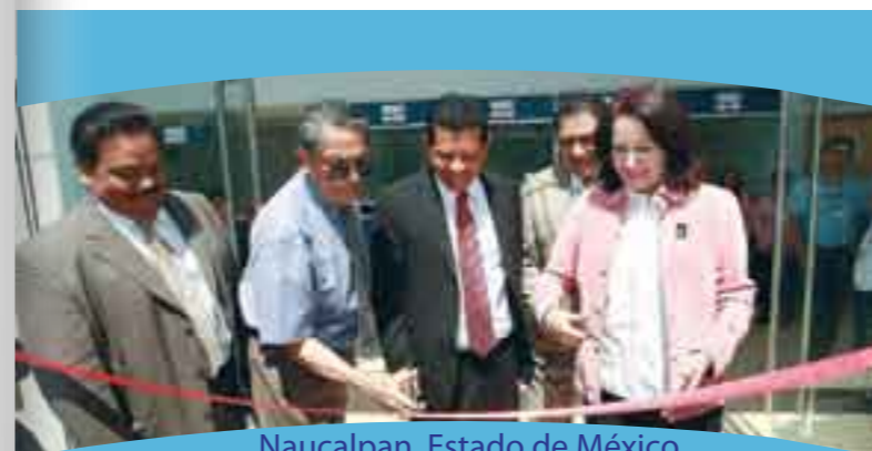
Naucalpan, Estado de México