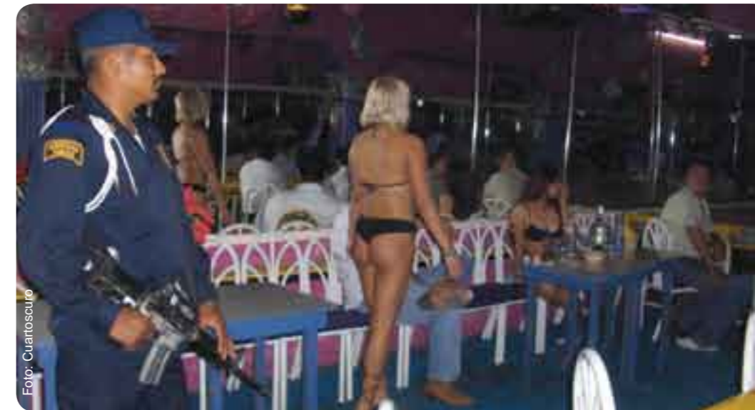
Antros al amparo de la justicia.