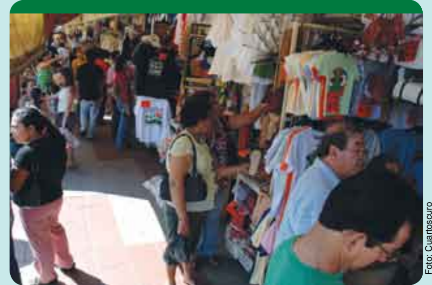
Paquete Económico 2010, más carestía para los pobres.

“Los mugres sueldos siguen siendo los mismos -dice Fernan-