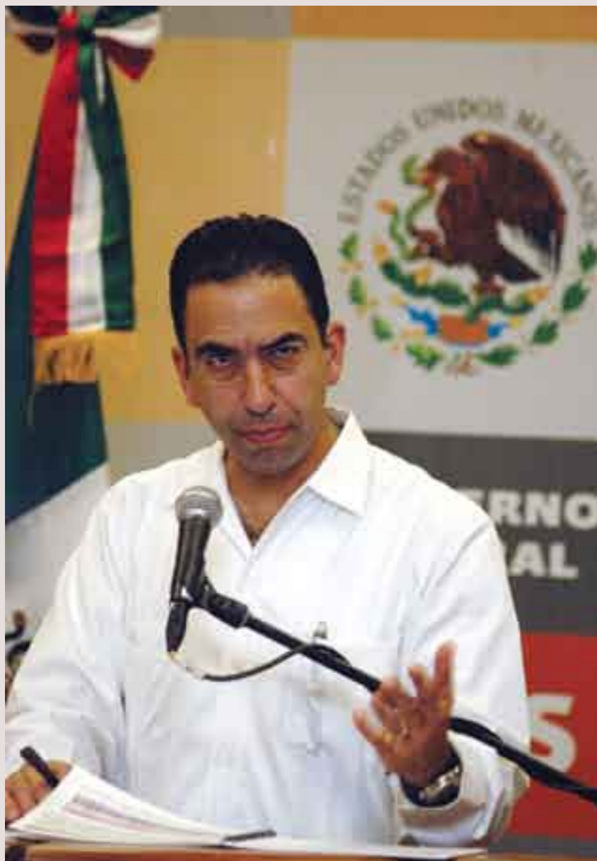
Lozano. Todo por la privatización de la energía eléctrica.

Esta reforma permitió el ingreso de capitales privados desde 1992 al sector eléctrico nacional, aunque hasta hoy no se reconocen oficialmente como inversionistas.