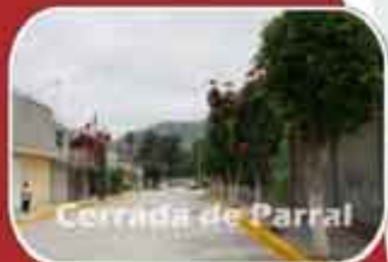
Cerrada de Parral