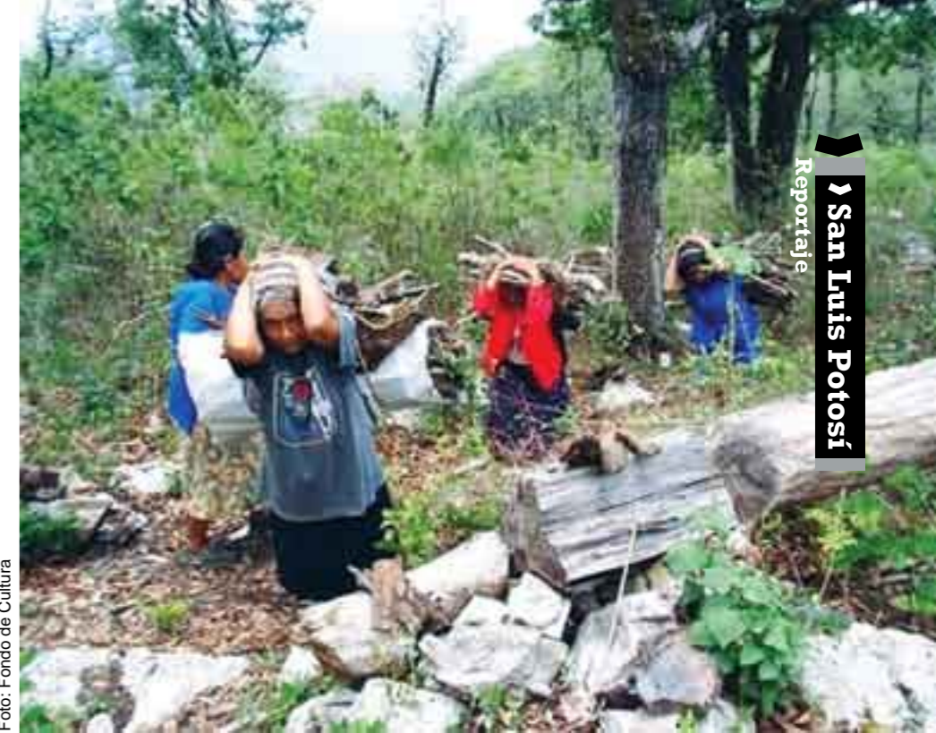
Pobreza y rezago educativo, de la mano.

dad del Maíz y Cárdenas, en este último está la sede de su oficina, desde donde controla la educación de las 125 escuelas de las 59 comunidades atendidas por 255 docentes.