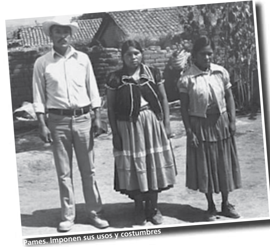
Pames. Imponen sus usos y costumbres

“Para disminuir el problema, el programa para abatir el rezago (Pareib), en materia inicial y básica, está construyendo escuelas con aulas didácticas, porque actualmente las clases se dan en palapas y tinglados muy humildes”, dijo el supervisor.