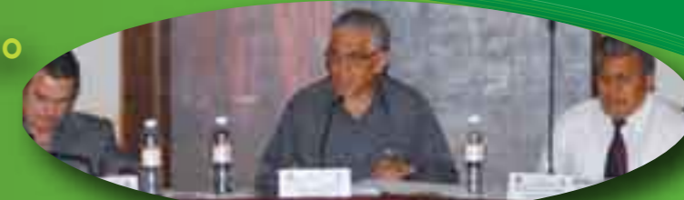
Tlalnepantla, Estado de México