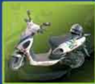
10 Motos Dinamo

¡Compra tu Boleto del Sorteo Magno del 18 de diciembre y te REGALAMOS OTRO para el Sorteo de Aniversario