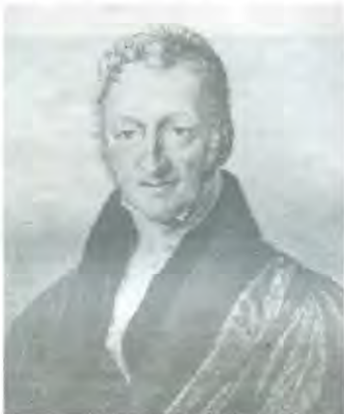
Thomas Robert Malthus

De acuerdo con el Consejo Mexicano del Café, las exportaciones serán este año de sólo 3 millo-