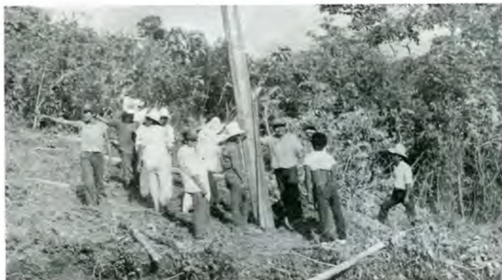
"Pero lo hace con buenas armas, con recursos limpios y legítimos; lo hace trabajando"

Secretario General de Antorcha Campesina