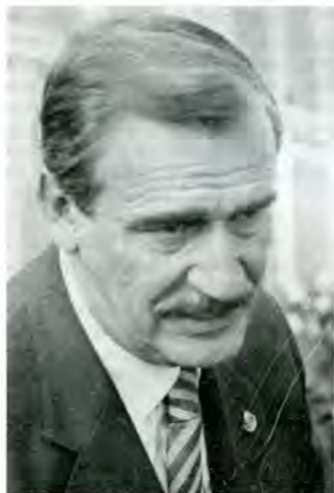
"La popularidad de Fox no necesariamente es la que multiplica votos"