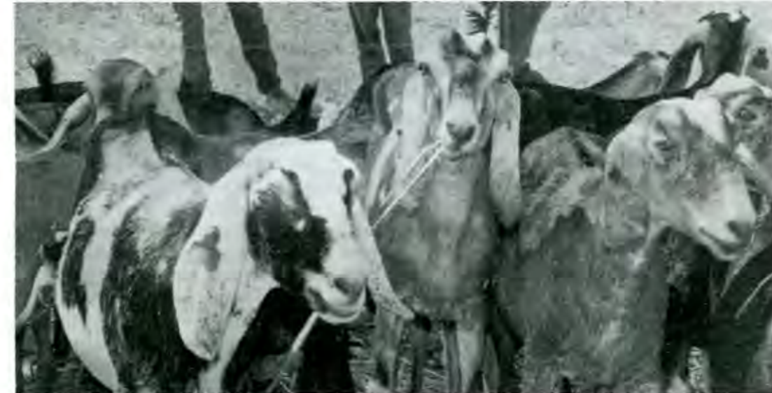
La ganadería mexicana sufre la misma embestida del mercado, tiene las mismas desventajas en la competencia y se quejan de lo mismo

Ingeniero Agrónomo de Chapingo y Diplomado en Administración de Empresas del ITAM