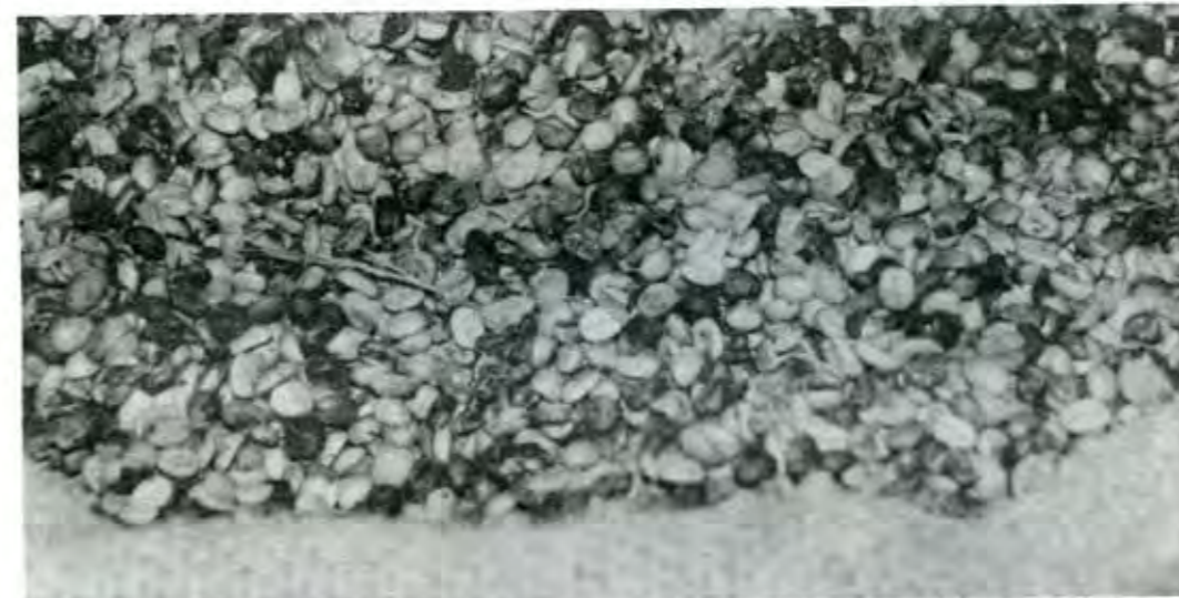
Voceros de productores privados en Chiapas señalan que se cultivan 700 mil hectáreas de café, de las cuales sólo 300 mil son aptas para producir grano de calidad con buenas posibilidades en los mercados por lo que las otras 400 mil deberían reconvertirse

Abel Pérez Zamorano Corresponsal en Inglaterra