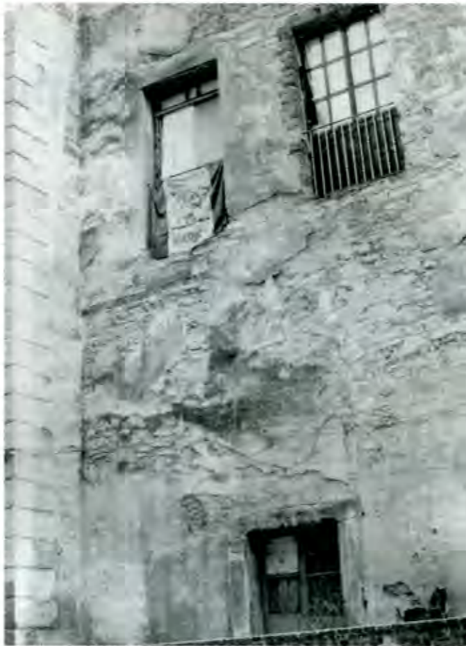
A 2 meses de iniciar el coloquio, las obras acumulan un rezago