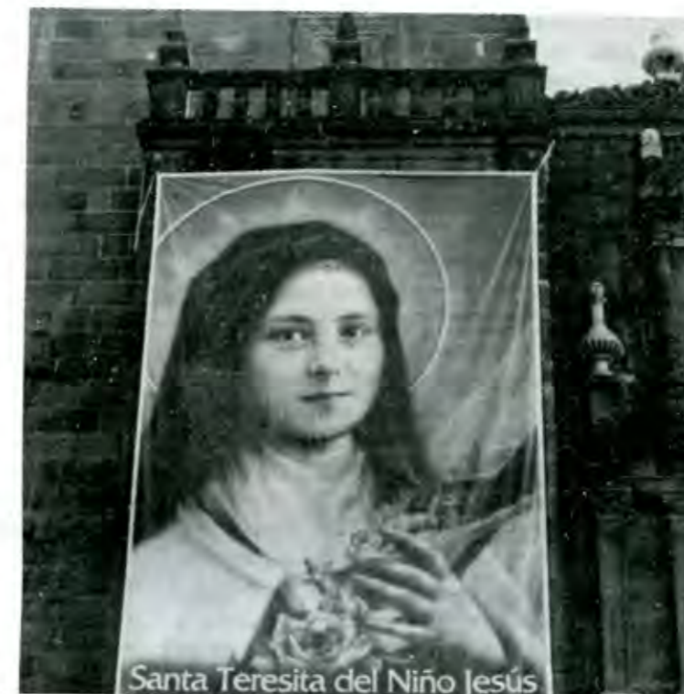
"Como antes viva, ahora muerta, tu segura y atenta servidora. Santa Teresita del Niño Jesús"