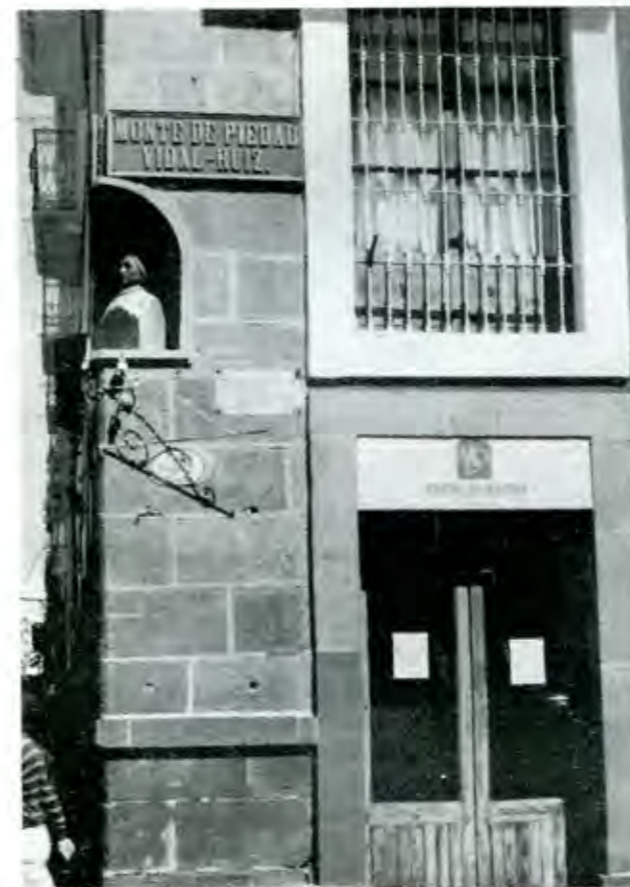
La modernización llegó al centenario Monte de Piedad Vidal Ruiz

de modernización y la dinámica administrativa, la institución dispone de un fondo creciente que para este mes asciende a los 8 millones de pesos para reforzar las compras del regreso a clases de los padres de familia que son materialmente asaltados con largas listas de útiles, libros, y accesorios para la escuela.