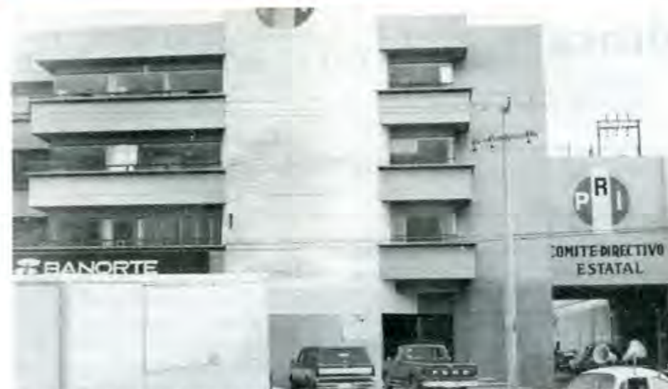
"En oficinas y pasillos donde se deciden las candidaturas a los puestos de elección popular del PRI, es común escuchar la frase: "si quieres que municipio fulano no vuelva a estar jamás en manos del partido, suéltaselo a los antorchos"

consiste en que se sustenta en la idea, implícita, es cierto, pero claramente presente en él, de que el poder es propiedad indiscutible de la corriente política que se opone al avance de Antorcha Campesina y que, por tanto, este debe volver siempre a ella aún en los casos en que lo pierda temporalmente. En consecuencia, quien no reconozca este derecho, quién no se apresure a devolver el poder a sus legítimos dueños en aquellos casos en que se lo haya logrado arrebatar por algún descuido, comete un despojo flagrante y debe ser castigado, por tanto, no volviéndole a permitir el acceso a ningún puesto de mando, sean cuales sean sus méritos y cuente con el apoyo que cuente, aunque todo se haya hecho por limpios e inobjectables métodos democráticos. Yo puedo, parecen decirnos los defensores de la idea, por condescendencia, prestarle un ratito la pelota a alguien para que se entretenga con ella, pero a condición de que me la devuelva