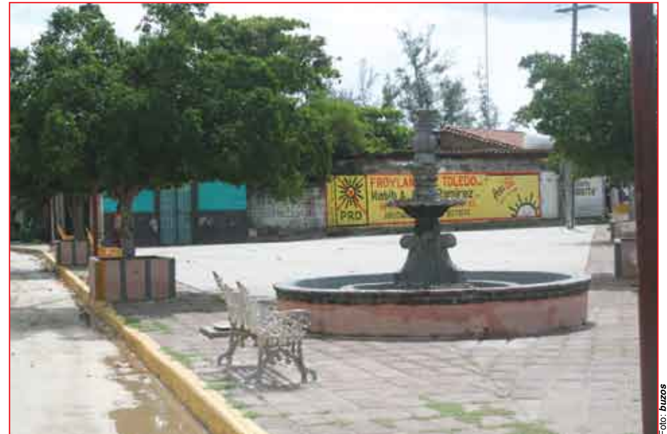
La leyenda inútil en el parque que pronto será un lodazal.

La decisión de estos oaxaqueños de no votar es un dilema que ha cundido en muchas otras partes