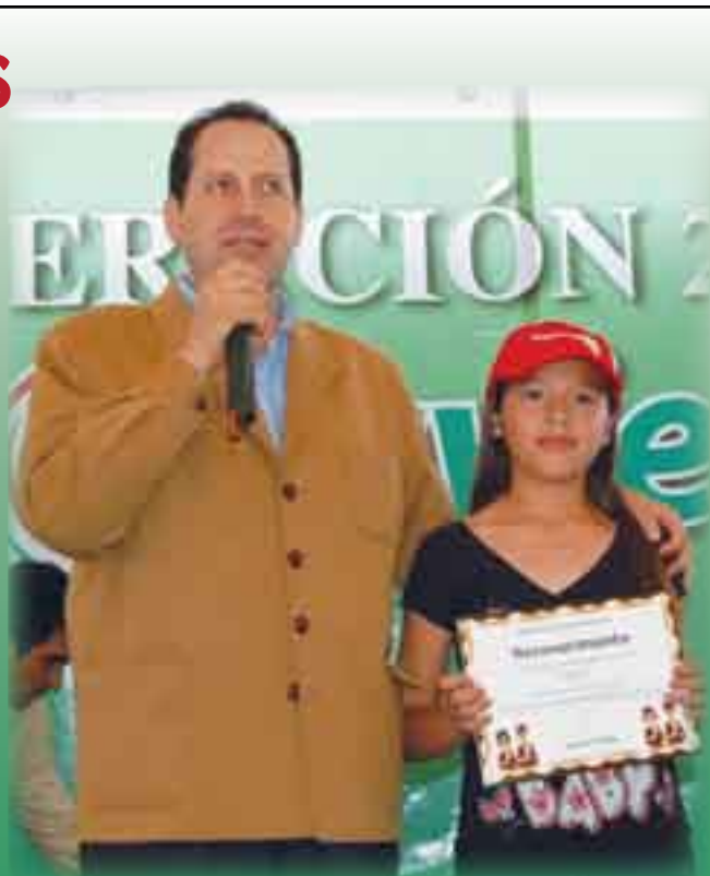
Ecatepec, Estado de México

“Todas las escuelas de Ecatepec habrán de contar con un cinturón de seguridad, vigilancia más estricta a las horas de entrada y salida, así como la modificación de cambio de turno de los policías, para incrementar los patrullajes en los caminos aledaños a los centros educativos”, precisó.