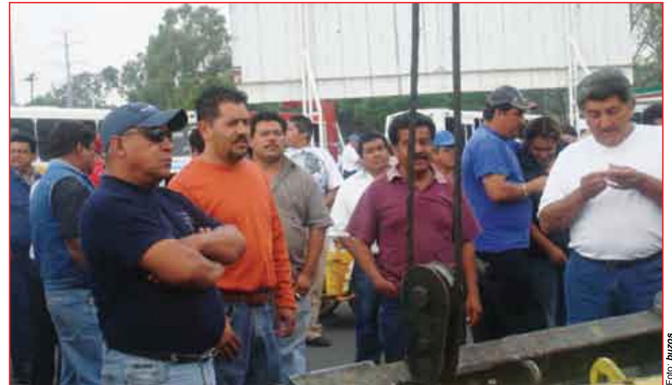
Los choferes burlados y "sangrados".

"Hicimos una reunión con todos los concesionarios para ver qué es lo que se decidía; una vez de acuerdo todos, empezamos a juntar el dinero para entregárselo; cuando ya lo teníamos fuimos a su oficina