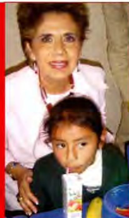
DIF estatal, acciones "sólo para la foto".

12 mil 194 Desnutrición leve Mil 975 Desnutrición moderada 170 Severos trastornos alimenticios