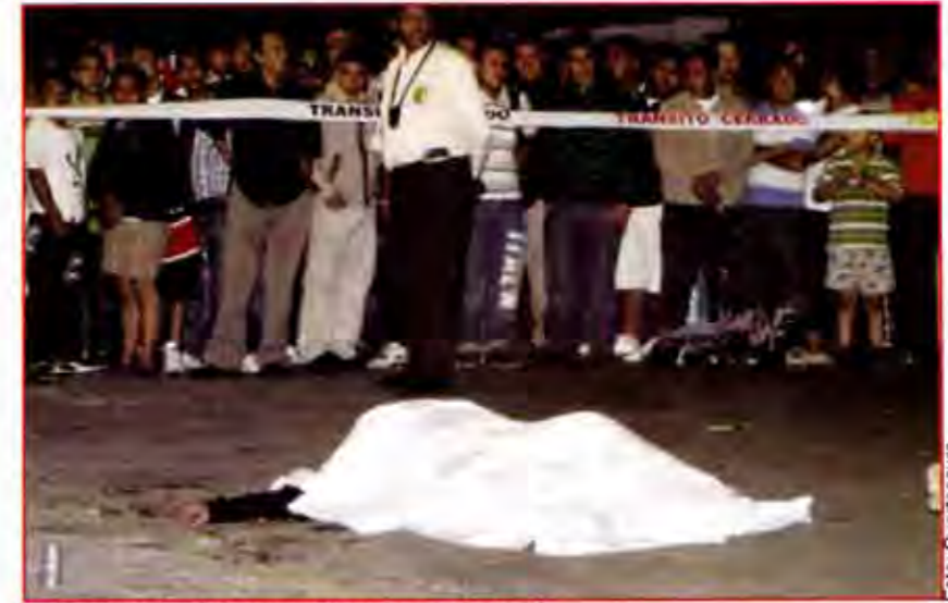
La "narcoviencia", presente en época electoral.