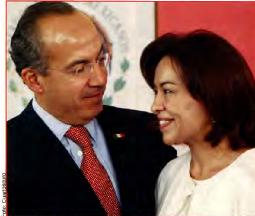
Vázquez Mota, comodín en tiempos difíciles.

perda la diputación ante la ola amarilla del Distrito Federal, fue una de las razones para que Vázquez Mota saliera de la SEP. En alguna ocasión, cuando la líder del Sindicato Nacional de Trabajadores de la Educación (SNTE), llamó "ignorante" a Vázquez Mota, la panista advirtió que no estaba a gusto en su puesto y que así no podía trabajar. Durante meses gestionó su salida de la SEP e incluso, propuso a Juan Carlos Romero Hicks, director general del Consejo Nacional de Ciencia y Tecnología (Conacyt), para sucederla. Pero la orden desde Los Pinos era que no podía moverse de su encargo. Menos con la ACE en plena negociación con el SNTE.