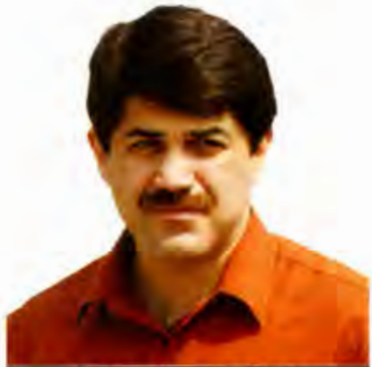
BRASIL ACOSTA PEÑA

El gobierno mexicano solicitó recientemente al Fondo Monetario Internacional (FMI) una línea de crédito de 47 mil millones de dólares, mientras que sus reservas internacionales son actualmente de 79 mil 4 millones de dólares. Esta noticia le cae de sorpresa a cualquiera que haya seguido, con o sin cuidado, las declaraciones de los funcionarios encargados de la política económica.