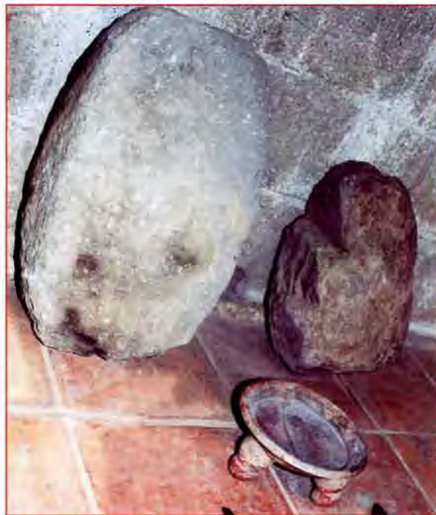
Piezas arqueológicas, hallazgo de Barranca Honda.

parte de la instancia ministerial se hagan las investigaciones y que el de Barranca Honda es un sitio que no ha sido estudiado ni delimitado específicamente. Se tenía conocimiento del mismo por los asentamientos arqueológicos que hay en el estado, pero algunos no se han explorado como este caso.