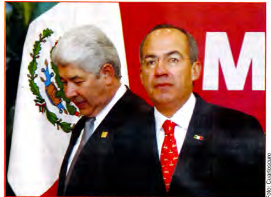
Ramírez Acuña, el retorno del incondicional.

La primera señal de la inminencia del Congreso de los "incondicionales" fue dada con la salida de César Nava del primer círculo presidencial para buscar una diputación federal por el Distrito XV. La búsqueda de su curul obe-