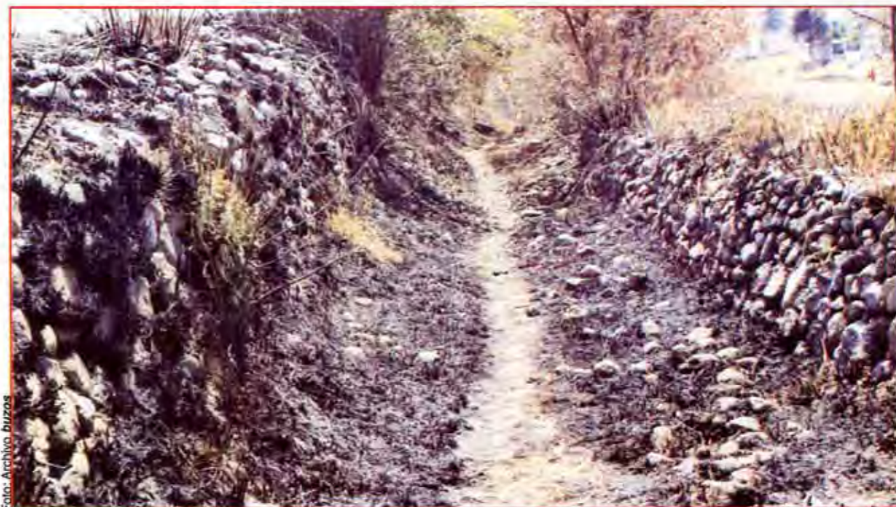
Vestigios que INAH-Puebla se niega a proteger.