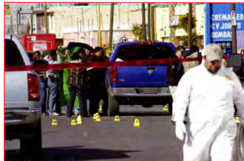
México y Estados Unidos, corresponsables de la violencia.

Y no sólo eso. Estados Unidos también debe mejorar la seguridad fronteriza. De acuerdo con un informe del Departamento de