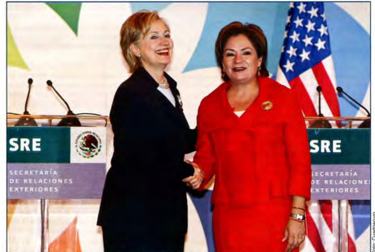
Hillary Clinton, Secretaria de Estado y Patricia Espinoza, de Relaciones Exteriores: todo es miel sobre hojuelas.

"Hillary Clinton viene con una encomienda descifrable en sus declaraciones. Por un lado, tiene la orden de calmar las aguas para que la visita de Obama en abril no