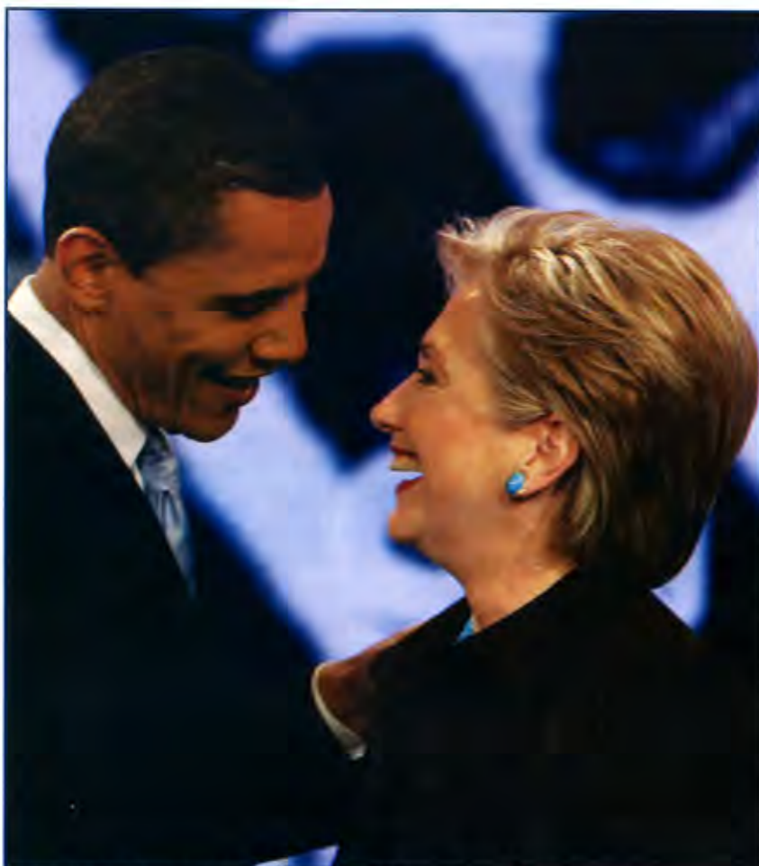
Presidente y secretaria de Estado, estrategia para México.

se realice en un ambiente ríspido. Ésa sería una primera lectura. La lectura de fondo es la estrategia que está utilizando y, me parece, revela el maquiavelismo y el oficio político de la secretaria de Estado: ante el evidente fracaso de la guerra contra el narcotráfico -ya van 10 mil muertos y según cifras de la Secretaría de Salud el consumo y las adicciones van en aumento- la sociedad americana comienza a preocuparse por lo que sucede del otro lado de la ventana. Estas preocupaciones, en el marco de un nuevo gobierno, fuerzan a actuar con lo que tienen a la mano, es decir, la Iniciativa Mérida. Y Estados Unidos despliega una campaña mediática contra México. Lo llama "Estado fallido", lo