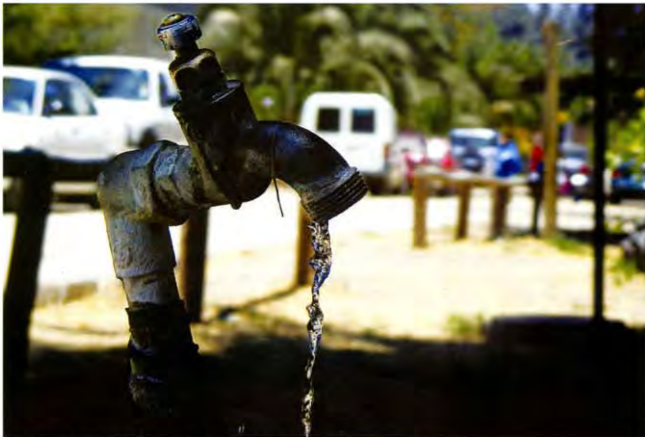
No hay agua, pero el alcalde quiere aumentar las tarifas, denuncian pobladores.

to, se elevaría la tarifa del agua potable, "aún viendo la cuestión de que cada dos meses tenemos que estar comprando entre cuatro y cinco tinacos. La verdad no estamos dispuestos a pagar, no tenemos los recursos suficientes Y no contamos con el servicio".