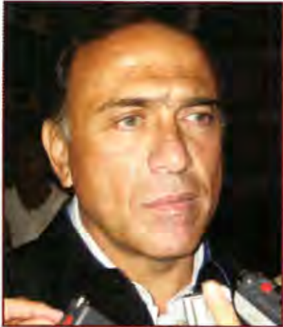
Yunes. Director general del ISSSTE

y enviarlas a terapia al Centro de Rehabilitación y Educación Especial (CREE) -dependencia del DIF Estatal-, aun cuando tienen conocimiento de que no es médicamente recomendable.