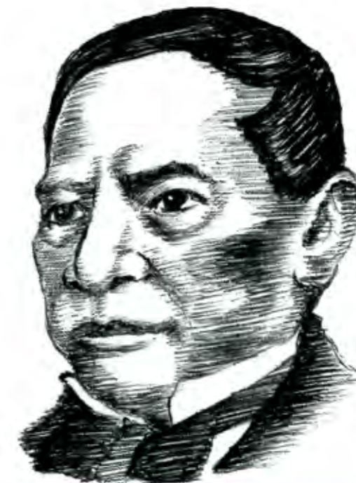
Mexicano entre los mexicanos; hombre entre los hombres.