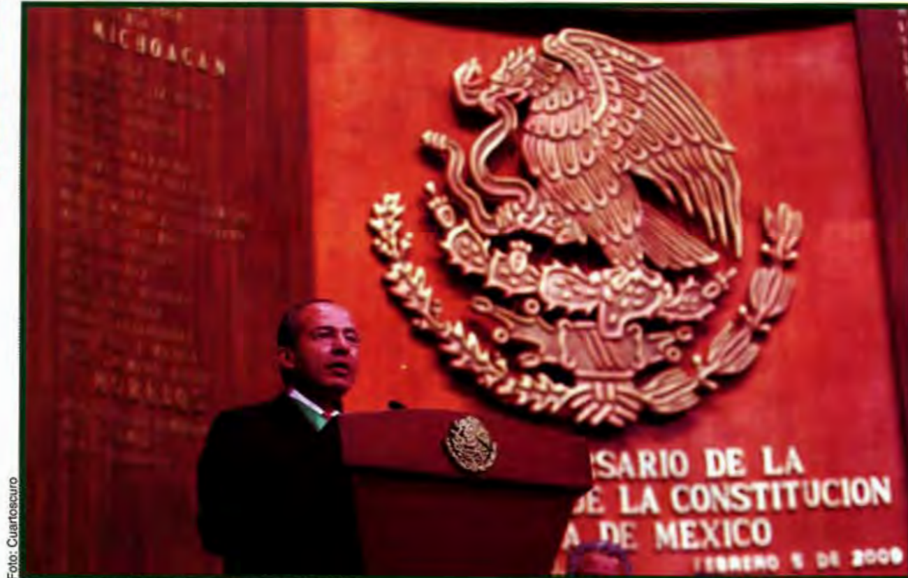
Cada vez se celebra una nueva Constitución.