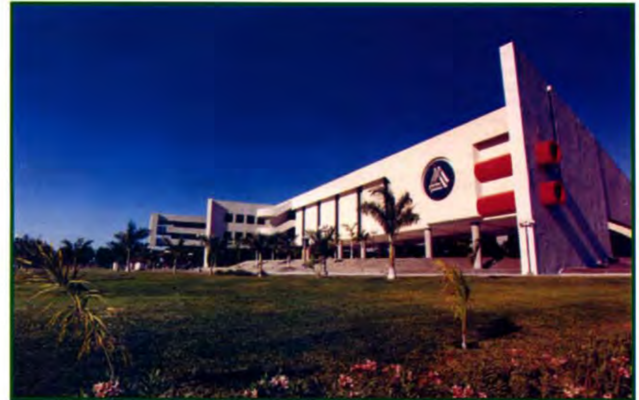
Educación religiosa, contra el Artículo 3°.

Los buenos propósitos del Artículo 3° reformado: "Además de impartir la educación preescolar, primaria y secundaria señaladas en el primer párrafo, el Estado promoverá y atenderá todos los tipos y modalidades educativos -incluyendo la educación inicial y a la educación superior- necesarios para el desarrollo de la nación,