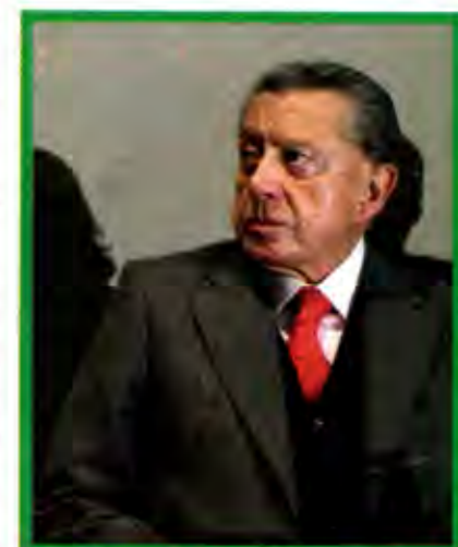
Miguel Alemán Velasco.

❖ ... la población de Chicontepec no sólo ve este proyecto con recelo, sino, incluso, con rechazo... la riqueza que hay debajo de la tierra sólo se ve reflejada en los funcionarios gubernamentales o de la paraestatal.