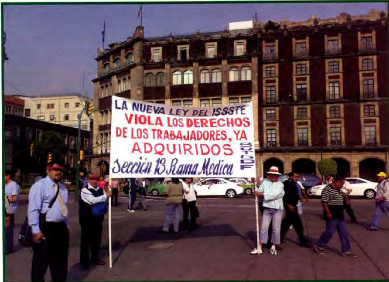
Nuevas leyes barren las ventajas de las antiguas.

una nueva Constitución. La Constitución no cojea, quien cojea es la propia autoridad, el Ministerio Público (MP). Y ¿por qué no lo hace? Porque el MP obedece a las autoridades que violan esa norma y eso es lo que crea la impunidad, de manera que es un círculo vicioso bastante complicado”, afirma el Doctor Barragán, quien agrega que la Constitución está completa en el sentido de que sus textos están en vigor reformados o no, pero que están completamente desactualizados. “La sociedad mexicana requiere de nuevas reglas, que esos excesos de autoridad efectivamente sean castigados conforme a un sistema que sea eficaz y que no se convierta en un Estado de impunidad como el que ahorita tenemos”, y que golpea a los más pobres. b