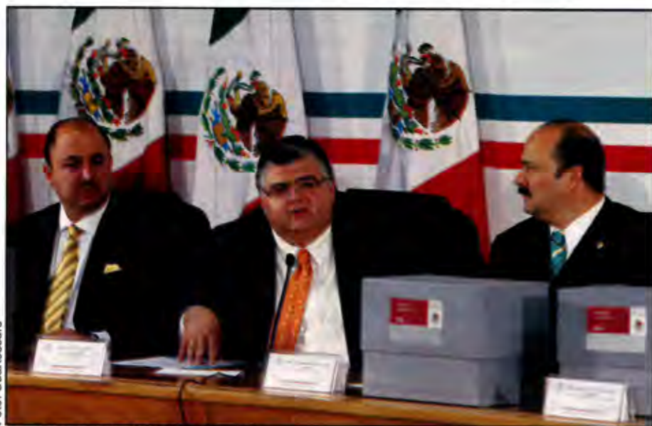
Para el secretario de Hacienda no hay crisis.

Las cosas se complican; la economía mundial sufre fuertes sacudidas... y México podría resentirlo en su gasto del próximo año. b