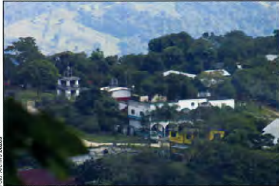
un pasado de abundante producción.

los vuelven cada vez más pobres. Antes, les sobraba hasta para hacer obra pública sin pedirle nada a nadie, allí está de muestra el camino vecinal que va de Ahuatitla al mero centro de Temango.