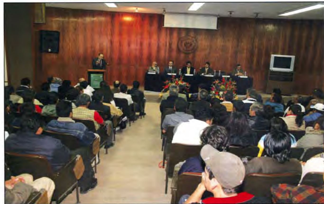
Presentación de la revista ante las comunidades universitaria y científica.

Por otra parte, la contabilidad de las naciones viene valorando la cantidad de riqueza creada, midiéndola, por ejemplo, por el Producto Interno Bruto, Nacional Bruto u otros indicadores, pero nunca considerando