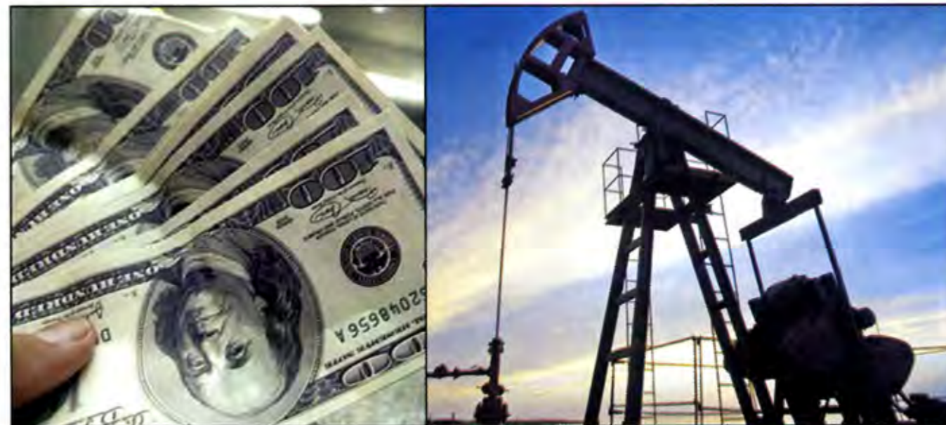
Remesas y petróleo cálculos optimistas para el presupuesto federal.