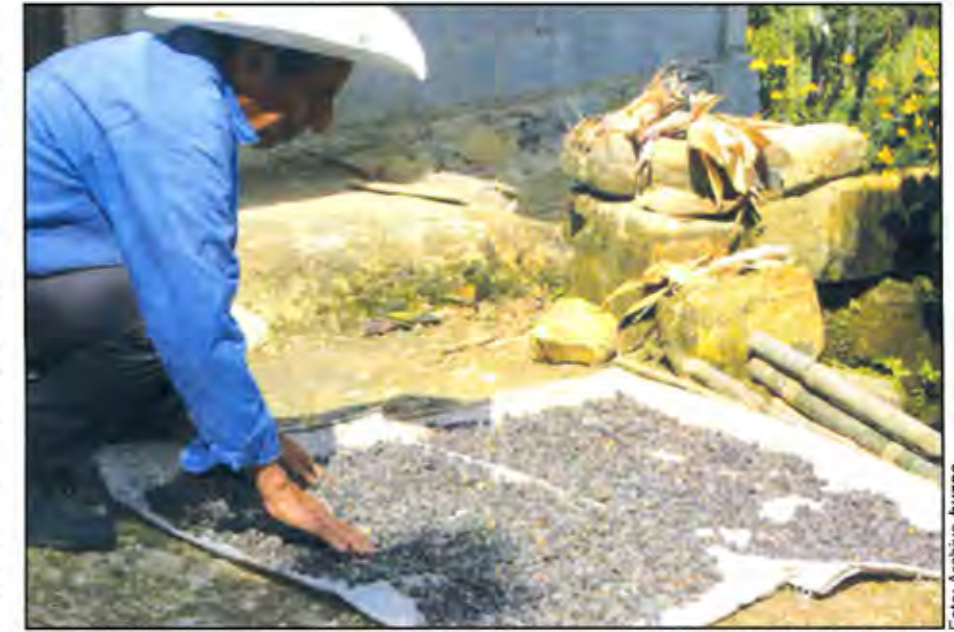
Los campesinos cada vez más pobres.