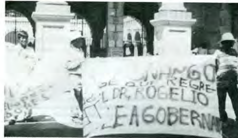
¿Qué camino le dejan al pueblo?

Por lo que hace a los titulares de los tres niveles de gobierno y a sus respectivos funcionarios, su aversión a todo tipo de lucha organizada de las ma-