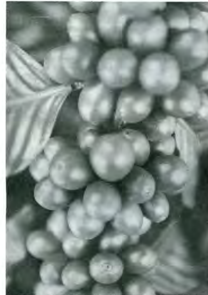
El precio de la mayoría de los productos en México, está determinado por la oferta y la demanda

Diplomado en Administración de Empresas del ITAM