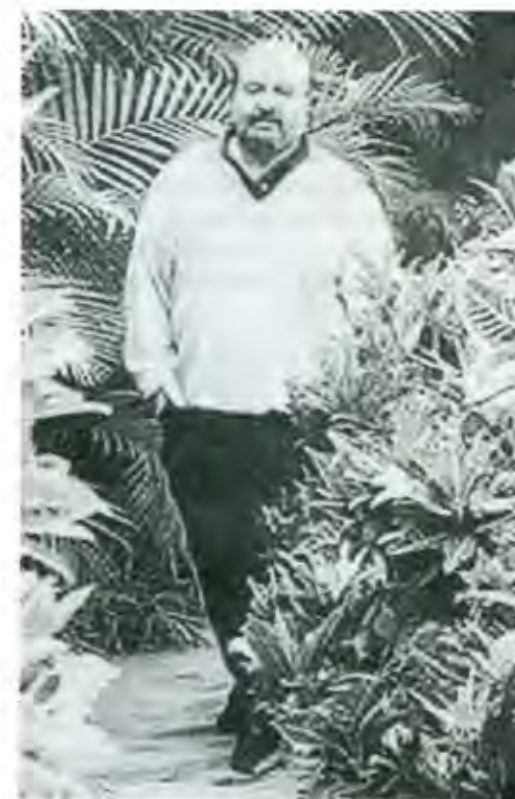
Hernando de Soto

Como alguna vez hemos comentado en estas páginas, la ley agraria, con intenciones que no viene al caso valorar, establecía una serie de mandatos como prohibir a los ejidatarios arrendar y vender su tierra, así como contratar mano de obra; igualmente, se les prohibía subdividir sus parcelas, en aras, supuestamente, de preservar el tamaño original de aquéllas. Al dejar de trabajarla por más de dos años, perdían el derecho a la tierra. Como consecuencia de esta legislación, las parcelas ejidales no podían convertirse en capital y funcionar como tal, debido a la precariedad de los derechos que sobre ellas existían, al estar sujetos a demasiadas restricciones; las parcelas no pertenecían plenamente a los ejidatarios, sino a la comunidad, al menos formalmente; en realidad era al Estado. Consecuentemente, la tierra no podía ser dada en prenda al contratar créditos, en el milagroso