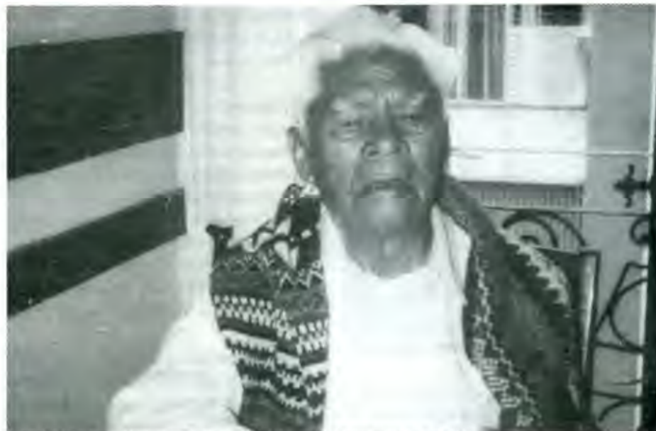
Los movimientos armados son una consecuencia de la injusticia y las promesas no cumplidas

Fernández de Lara se remite a la Constitución para justificar la lucha campesina por la tierra, el derecho a la tierra, afirma, es una cosa constitucional, está escrito en el artículo 27 de la Constitución, éste es como el 123 que defiende