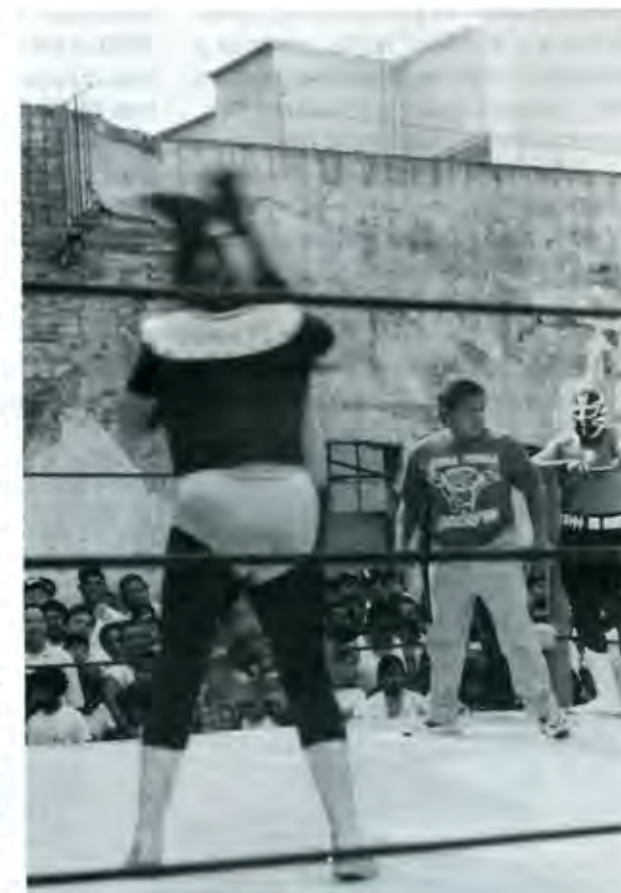
Fiesta profana con torneos de lucha libre