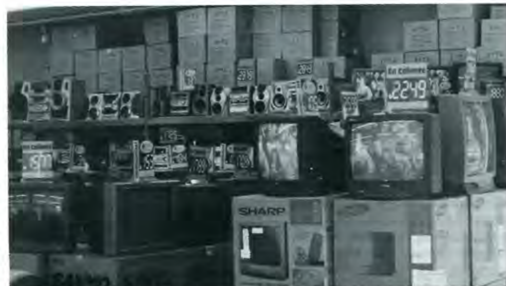
El nuevo orden mundial requiere de Estados Fuertes, capaces de regular las empresas transnacionales

Bajo esta óptica podemos entender algunas de las cosas que están pasando en nuestro país. El cual, paulatinamente se ha ido desmantelando de sectores clave para su propia fortaleza. Sectores como el agrícola, el industrial, y recientemente el bancario, por citar algunos, se han puesto en las vías de la penetración de capital externo. Este factor es entendible si consideramos el juego político de conformar un mundo con tres bloques comerciales. De esta manera todo país, indudablemente, pasará por el proceso de desregulación nacional, con el fin de