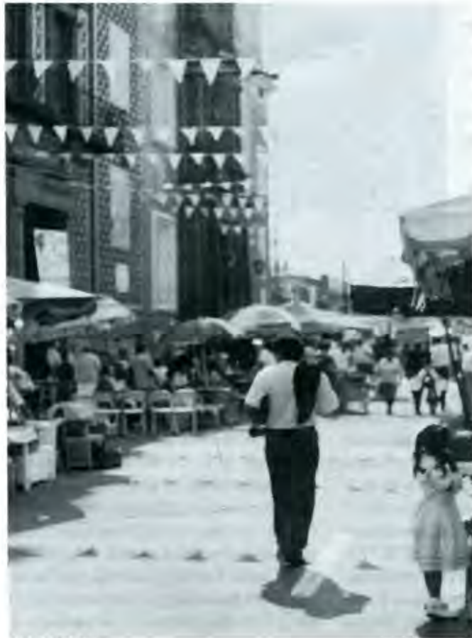
El Barrio de La Luz

Los aspirantes a la alcaldía de Puebla ¿tendrán contemplado proyectos reales de apoyo a los barrios y colonias?, educación, vivienda, salud y hasta diversión sana necesita el pueblo, pero el barrio de La Luz (un sólo ejemplo dentro de la inmensa ciudad) nos debe mover a reflexión, más que apoyos, los vecinos han vivido en el abandono y últimamente la incertidumbre. Ojalá no olviden los políticos que la gente del pueblo es la que con su voto los puede llevar al poder, la pregunta es ¿para qué?