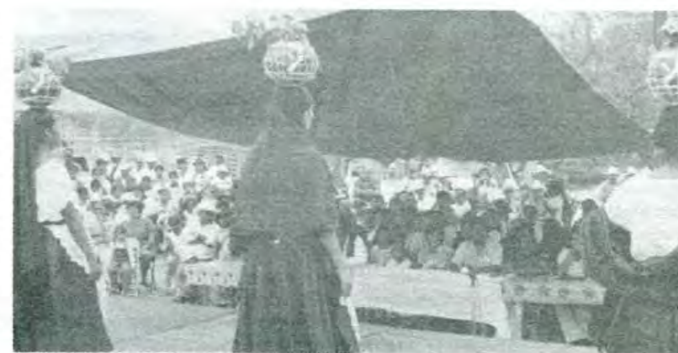
Programa sociocultural en la apertura de campaña

Yo soy originario y vecino de Petlalcingo, soy licenciado en derecho y quiero trabajar en beneficio de mi municipio, quiero servirle a mi pueblo,