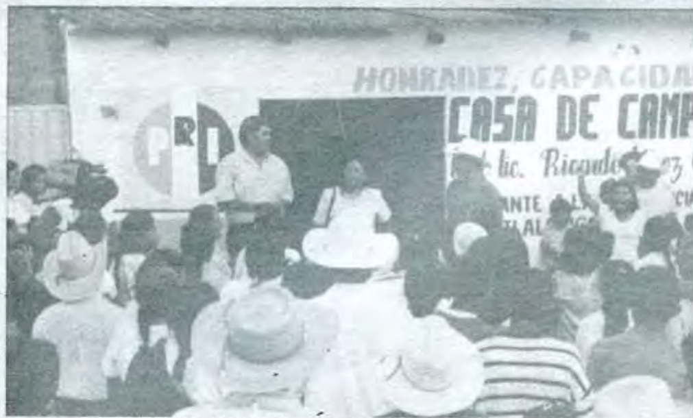
Inauguración de la casa de campaña ubicada en Emiliano Carranza No. 52, Barrio del Carmen Petlalcingo, Puebla

En Sección Sexta Guadalupe tendremos que construir sus instalaciones