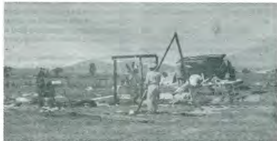
La pobreza se mide por las condiciones en que se encuentra la población: alimentación, vestido, vivienda, educación, etc

En Puebla, informa el funcionario, suman 125 los municipios considerados en pobreza o marginados, de ellos sesenta y cinco se ubican en la Sierra Norte, nueve en la Sierra Negra y cuarenta y siete en la Mixteca, en todos ellos se desarrollan acciones en beneficio de las familias, a las que se busca mejorar sus ingresos mediante la ejecución de proyectos productivos.