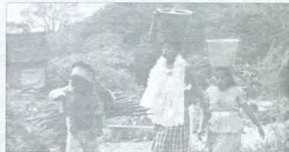
En el 2010 más de mil 400 millones de personas (23% de la población mundial) vivirán sin agua

Wade hace sus propios cálculos empleando el llamado coeficiente de Gini, conocido indicador que mide la desigualdad en una escala de cero a cien, donde el primer valor indica igualdad perfecta y el segundo sería el caso extremo en que un solo individuo recibe todo el ingreso. Pues bien, la desigualdad así medida pasó de 62.5 en 1988 a 66.0 en 1993, tasa que a