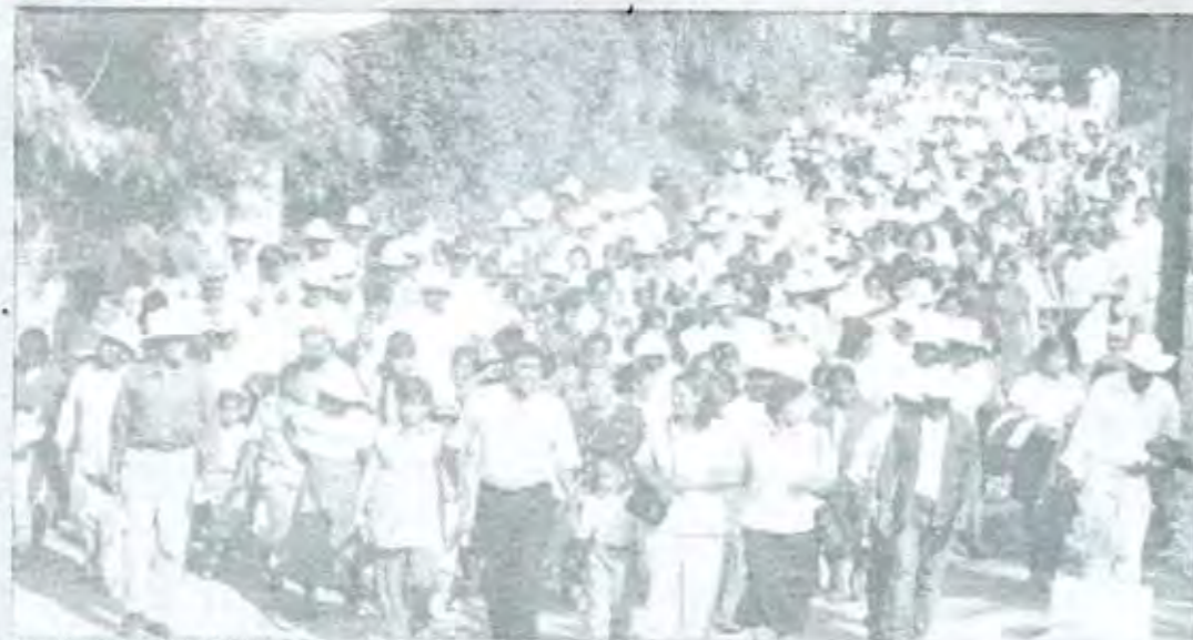
Apoyo de priistas a López Cázarez

Hay comunidades que no cuentan al cien por ciento con luz eléctrica, alumbrado, agua potable y caminos.