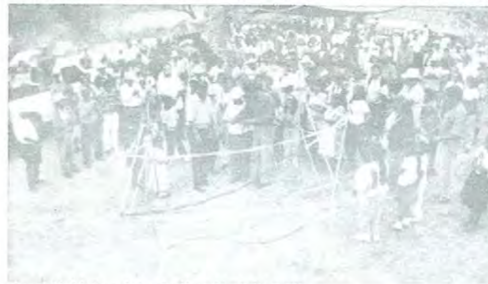
Inauguración del sistema de Agua Potable en el Barrio de San Isidro

Vamos a llevarles a todas las comunidades los servicios.