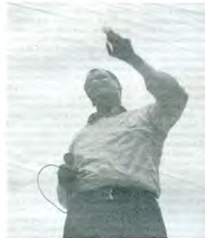
Fox prometió mejorar las cosas y parece que todo sigue igual