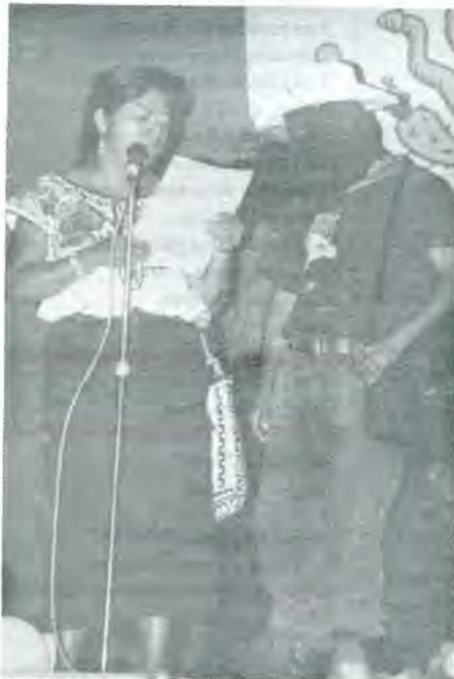
El surgimiento de grupos armados es reflejo del desinterés mostrado por el gobierno