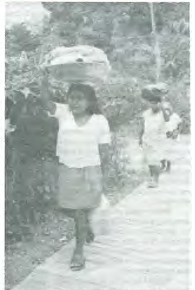
El sector indígena se encuentra por debajo de la línea de la pobreza

Estamos, dice, en el umbral en que el estado mexicano debe modificar leyes, políticas e instituciones para que no se excluya a la población indígena del verdadero desarrollo económico, superar la situación actual como simple mano de obra barata o proveedora de materias primas.