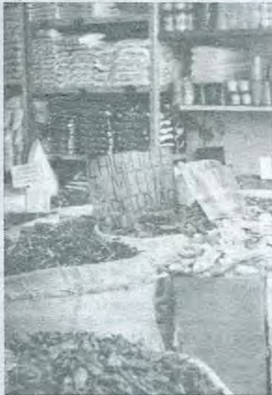
Gravar con IVA alimentos, medicinas y libros es precisamente profundizar la pobreza

Otro estudio reciente, éste publicado por la ONU, fue dado a conocer por El Universal el diez de mayo pasado. En él se hace referencia a los países menos avanzados en los siguientes términos: "La ONU clasificó por primera vez en 1971 a 24 países menos avanzados (PMA) . . . Desde entonces los PMA han crecido