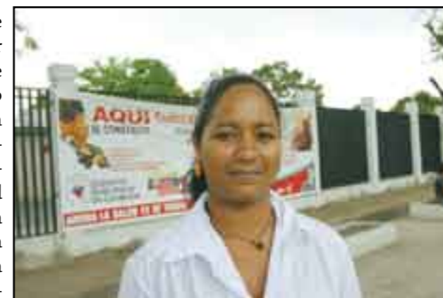
Los desheredados se quedaron sin posibilidad de disfrutar la riqueza social.

como las viejas clases en el poder, un gran abanico de posibilidades entre los hombres, sino que sus representantes más lúcidos y consecuentes son relativamente pocos y, en casos, únicos. Por eso los fideles castro y los hugos Chávez tienen que ser preservados en la dirección de las revoluciones, hasta en tanto la nueva clase cuente con todas las condiciones para desarrollar plenamente a sus hijos.