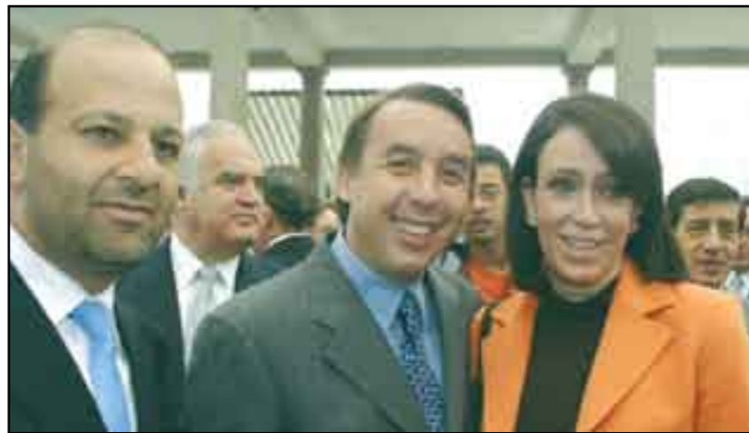
Azcárraga Jean y Aramburuzabala, tiburones empresariales.