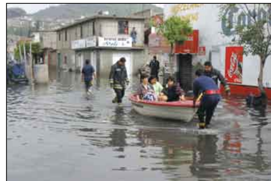
Si no se toman medidas a tiempo, el DF podría terminar como Tabasco.

“No debemos soslayar lo que comentan diversos especialistas en el sentido de que podría presentarse en el Distrito Federal una inundación de grados mayores o de dimensiones parecidas a la que ocurrió en Tabasco...”.