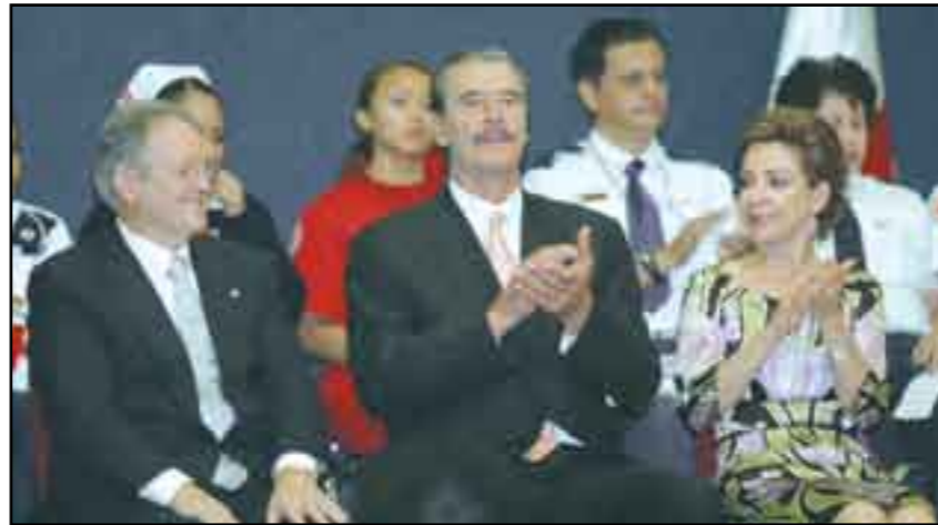
A través de los sexenios se afianza oligarquía.

El empresariado político integrado al Consejo Coordinador Empresarial (CCE) escuchó azorado en 2006 al candidato presidencial de la alianza Por el Bien de Todos , Andrés Manuel López Obrador, anunciar la ruptura de sus privilegios y se lanzaron a respaldar el proyecto de aniquilamiento vía