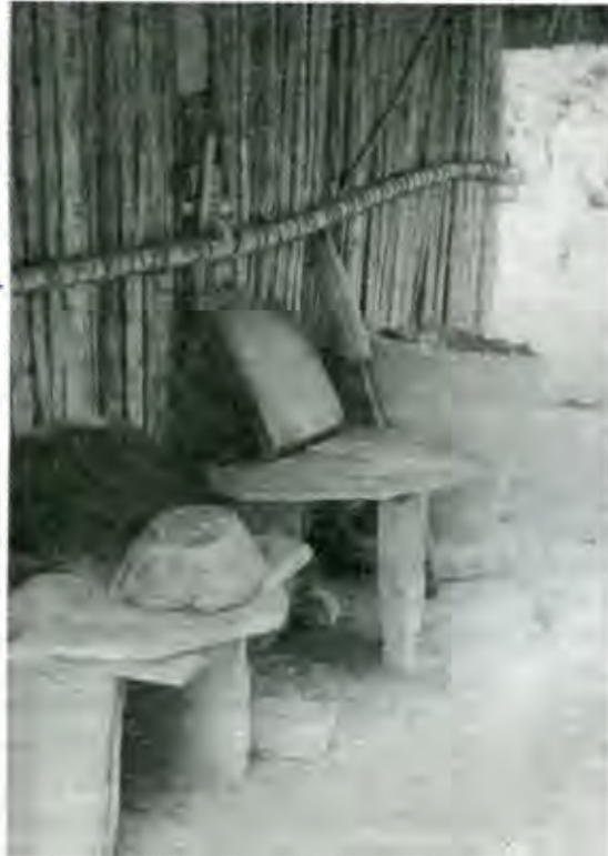
* Sentar las bases para desarrollar la industria en el campo*

4 "MILENIO DIARIO" pags interiores 16 de marzo.