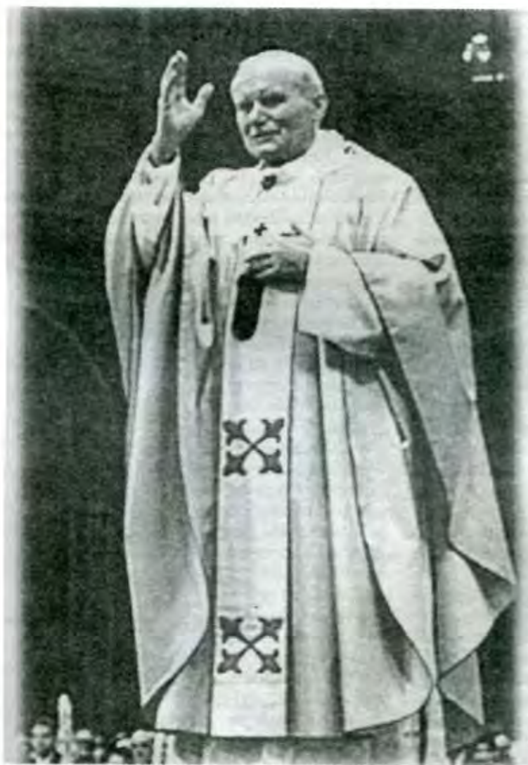
Karol Wojtyła, no duda en calificar de capitalismo salvaje el proyecto de los mercados

tancia – han pasado ya cien días de gobierno de Vicente Fox y todavía usufructúa el áurea del impresionante triunfo sobre el P.R.I. – en México "los mercados" tienen otro objetivo apuntado distinto, al menos por ahora según se ve, que la guerrilla indígena. Y por eso seguramente no