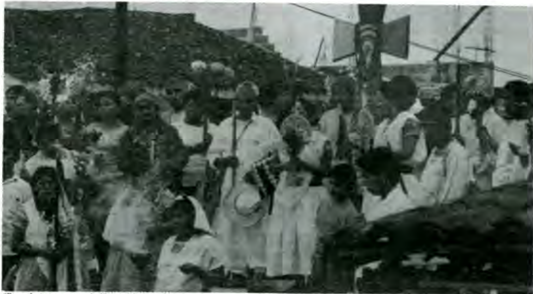
"No se siente un respeto a la diferencia histórica"

Tal vez lo único que sentimos los que somos indígenas es que no haya sido ninguno de los indígenas el que lo haya