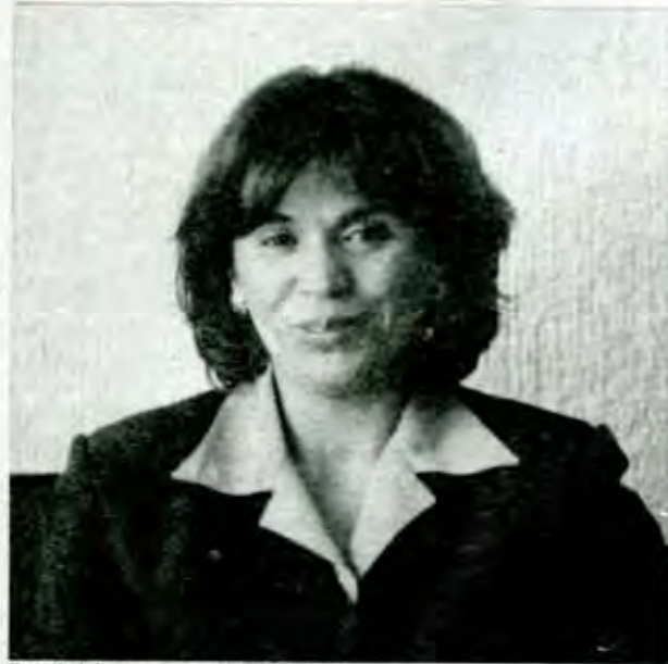
El triunfo de las mujeres es un triunfo colectivo