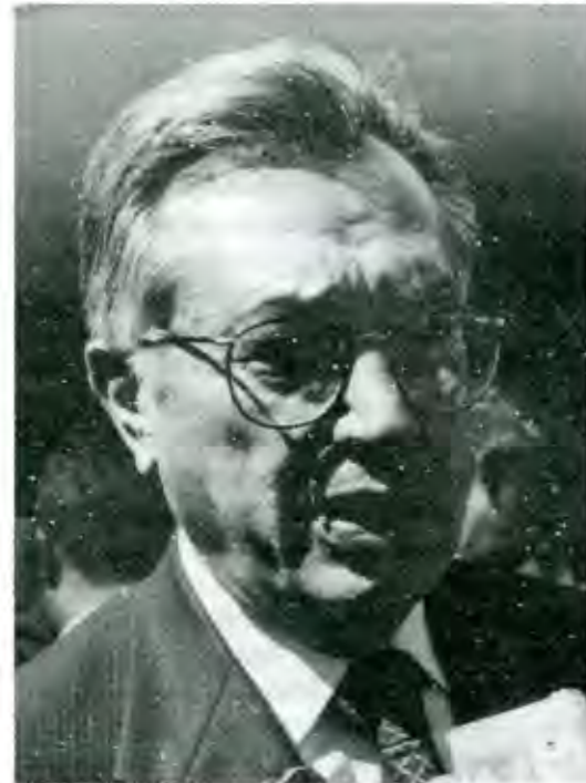
Manuel Bartlett Díaz

Conductor del Programa Radiofónico "Portero de Noche"