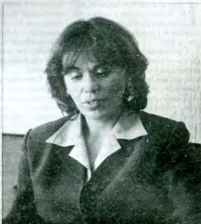
Todos tenemos el derecho de aspirar a trabajar por nuestra ciudad

Bueno, se ha tenido que ir rompiendo todo un proceso histórico que