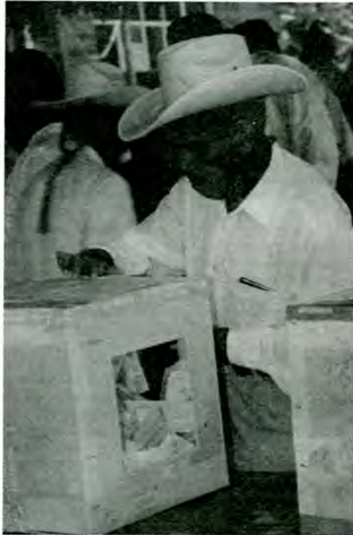
"Llevar a cabo los cambios y ajustes necesarios que lo pongan en condiciones de captar el voto ciudadano"

La segunda causa la constituyen la actitud y la forma de ejercer el poder de los funcionarios de todos los niveles surgidos del PRI. Es mi convicción que la porción mayor del desprestigio del partido, sobre todo en el seno de las grandes masas populares, no se debe a culpas imputables directamente a éste como tal, sino a la mala imagen que le fueron creando quienes ejercían (y aún ejercen) el poder en su nombre y, supuestamente, poniendo en práctica sus principios y su programa de acción. La prepotencia, la soberbia, la corrupción, el autoritarismo, la insensibilidad y aún las actitudes francamente conservadoras y contrarrevolucionarias para enfrentar y resolver las demandas de la gente humilde, fueron prácticas consuetudinarias del gobierno y no del partido. Sin embargo, la opinión pública siempre culpó a este último por ser quien promo-