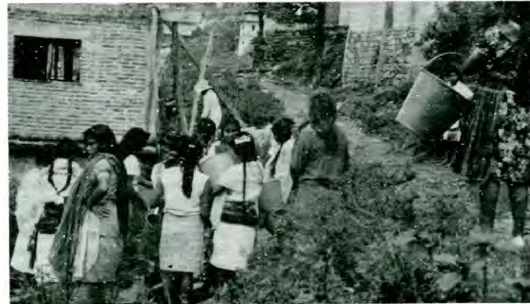
"No hubo desarrollo a pesar de que se invirtió el dinero"

Si va a ser de paga, como es su costumbre, va a ser difícil que la usen, y en cambio es mucho el perjuicio que les están causando.