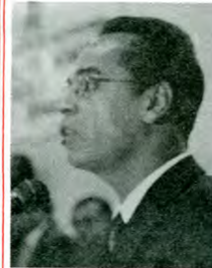
La dirigencia priista advierte una posición de semiabandono