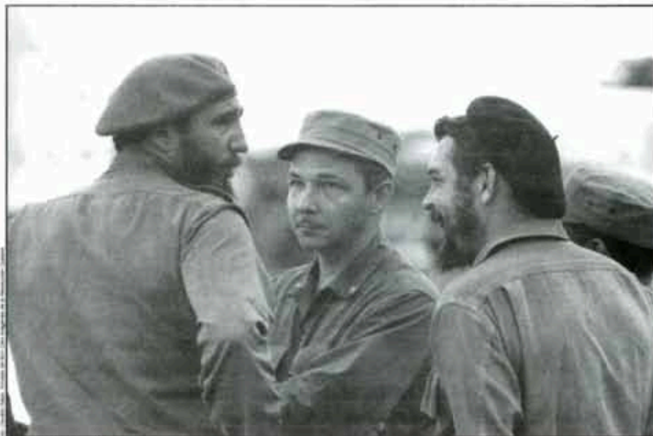
Tres hermanos, 1963.