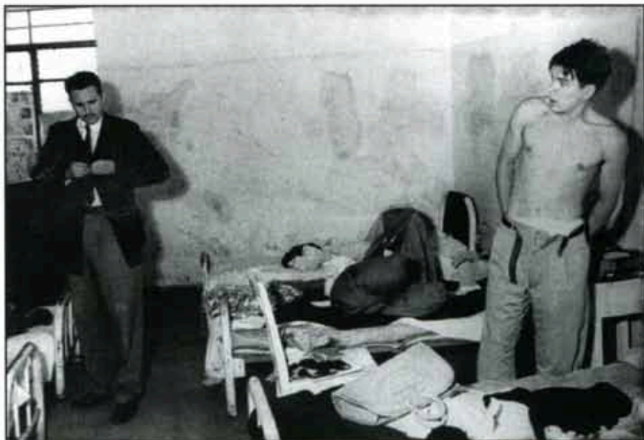
En la cárcel de Miguel Schultz, 1956.

Relata que a los dos minutos de haberlo conocido, "sin saber quién era, sin saber nada, me puse a sus órdenes, pues me di cuenta que era una persona fuera de lo común". De esta manera comenzó a colaborar para la Revolución, sin