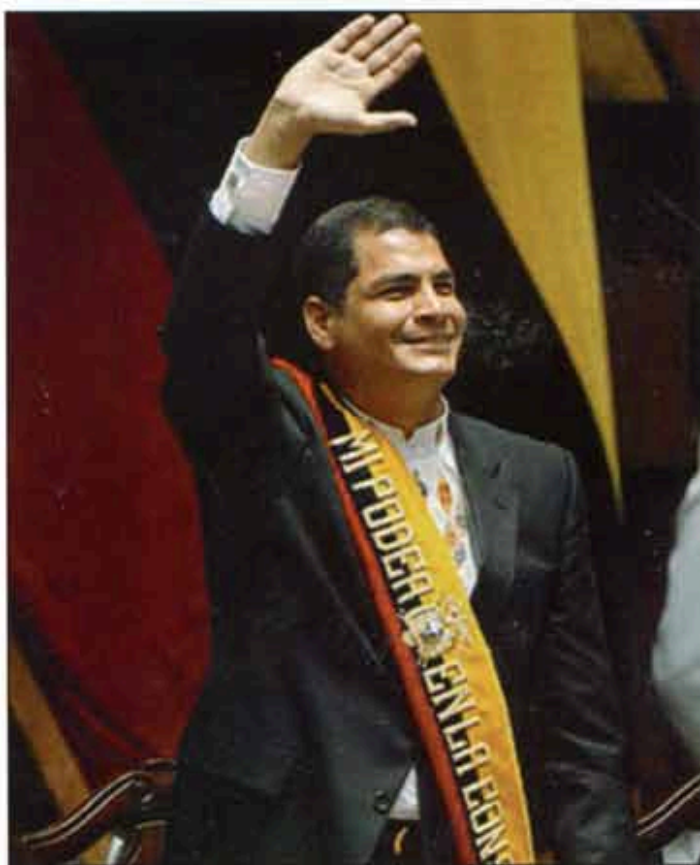
Rafael Correa. Arrasó su partido.