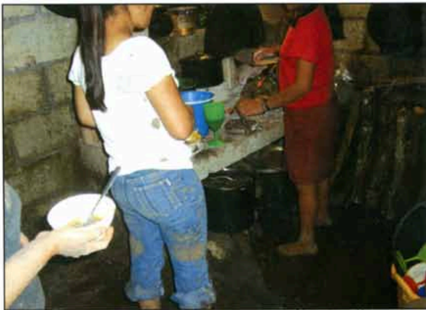
Pérdidas irreparables para esta gente.

En Villa Ávila Camacho, junta auxiliar del municipio de Xicotepec, fue necesario que los afectados realizaran una manifestación de protesta para que las cobijas, colchonetas, agua y despensas entregadas por el Fondo de Desastres Naturales (Fonden), para