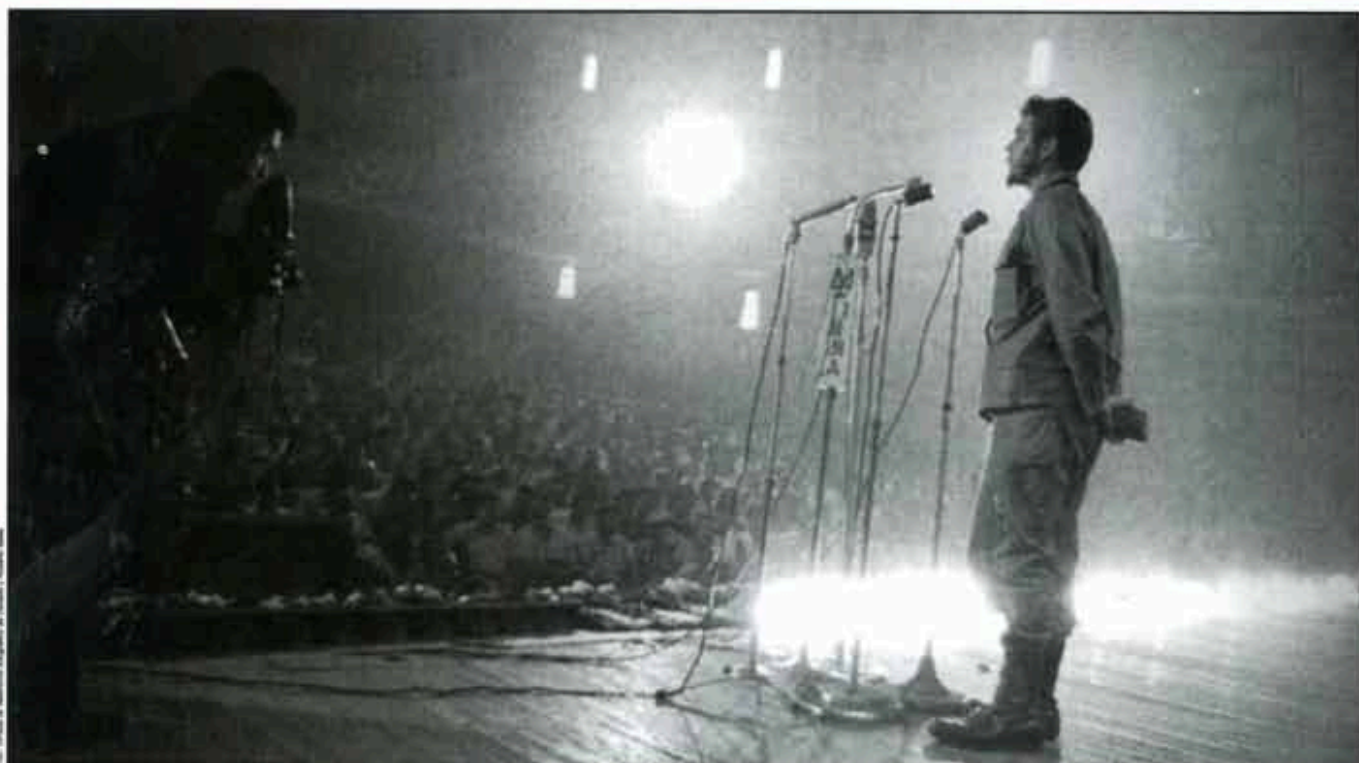
Acto en el teatro de la Central de Trabajadores de Cuba, La Habana, 1962.

damente, sí murió el Comandante Guevara y a mí me afectó profundamente. Fue una pérdida irreparable para mí, porque fue mi jefe directo, porque viví con él, porque me educó con él.