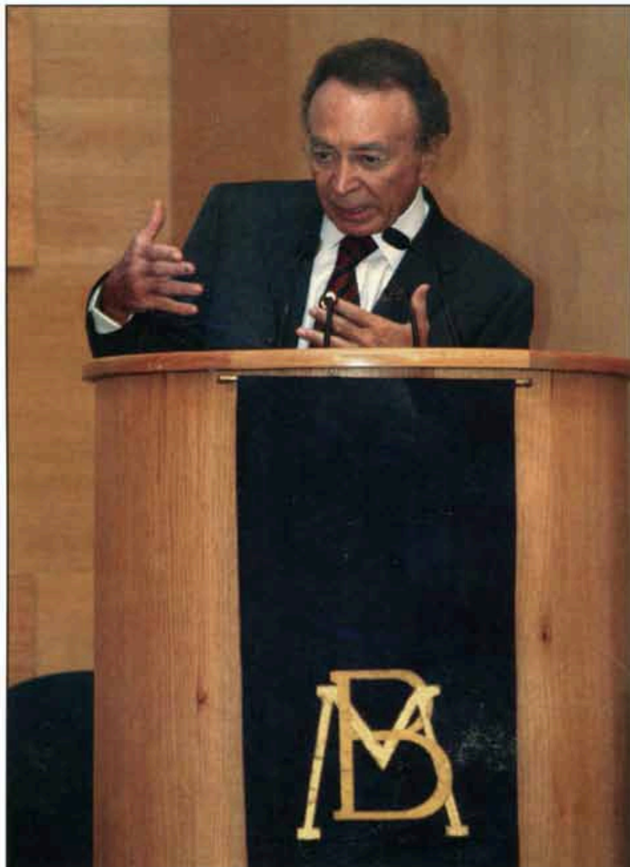
Guillermo Ortiz alertó sobre la inflación.

PRI y PAN calcularon cuántos recursos podían sacar del aumento a las gasolinas y, de acuerdo con sus expectativas, sólo afectaría a alrededor de 24 millones de mexicanos que tienen un automóvil en el país y dijeron estar dispuestos a asumir el costo político, pero su arrojada actitud cambió, porque el solo anuncio del aumento impacta