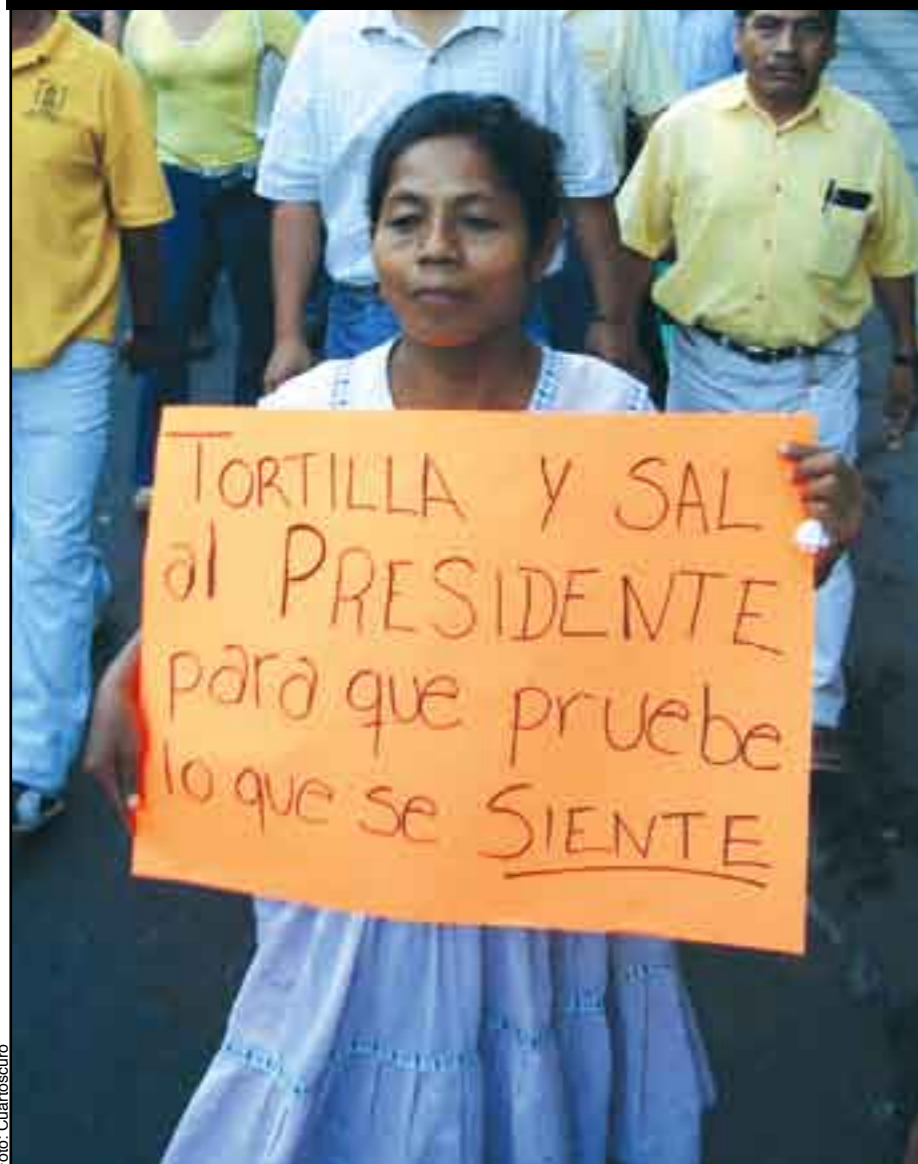
Los sectores más desprotegidos se levantan.

“La iniciativa aprobada por el Congreso desatará el ascenso de los precios de la canasta básica y del transporte público, que en el primer trimestre de 2008 se espera que crezcan un promedio de 10 a 15 por ciento.”