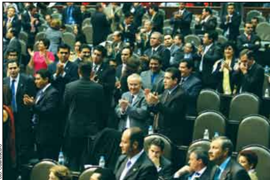
Los medios de comunicación contra los legisladores.

se la reforma, en 2009 el gasto en spots sería de mil 68 millones de pesos y de 2 mil 670 millones para 2012.