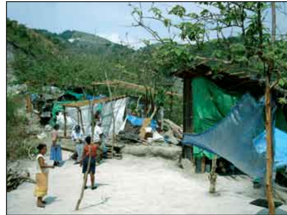
Con el sistema actual no se erradicará la pobreza.

De los 600 mil afiliados al IMSS de los que habla el presidente Calderón, el 50 por ciento son even-