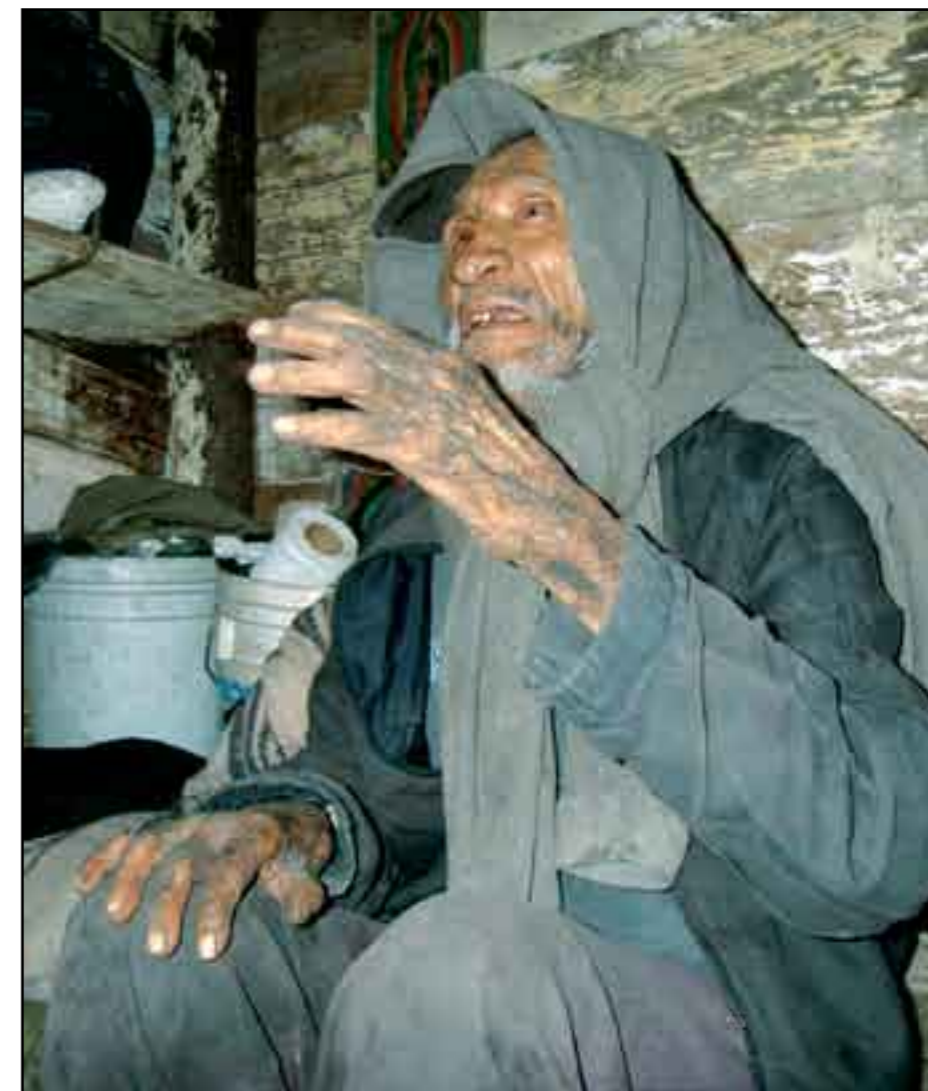
La pobreza en México incrementa más y más.